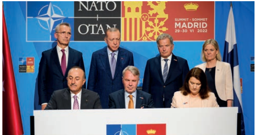
Firma del Acuerdo Trilateral entre Turquía, Suecia y Finlandia

En la Declaración de Madrid del 29 de junio de 2022 los líderes reunidos en la Cumbre reafirmaron su compromiso con la Política de Puertas Abiertas de la OTAN y decidieron invitar a Finlandia y Suecia a convertirse en miembros y a firmar los protocolos de adhesión. El Concepto Estratégico de Madrid también recoge la mencio-