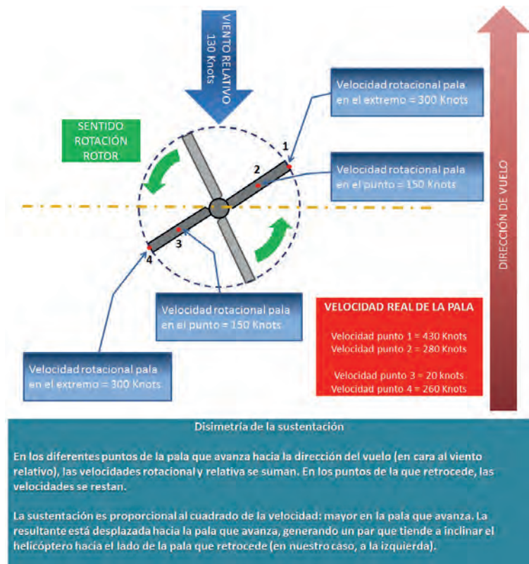
Explicación simplificada con fines divulgativos del fenómeno de la disimetría de la sustentación. (Autor)

Este efecto puede describirse, a grandes rasgos, como sigue: en motores de un único rotor la sustentación generada durante el giro del mismo es desigual entre la pala que avanza y la que retrocede, debido tanto al avance del helicóptero como a la velocidad de rotación entre distintos puntos de la pala, siendo mayores en los extremos y menores conforme nos acercamos al centro mismo del rotor; para contrarrestar este efecto, se emplea la llamada articulación de batimiento, cuya función es cambiar el ángulo de ataque, de forma que, a grandes rasgos y sin entrar en más detalles, el ángulo de ataque de las palas del rotor se “autorregule” y se disminuyan los efectos perjudiciales de la disimetría de sustentación. En el caso del Ka-52, dado que cada rotor gira en un sentido diferente, el efecto de disimetría de sustentación desaparece casi por completo, siendo la transmisión la que permite el mo-