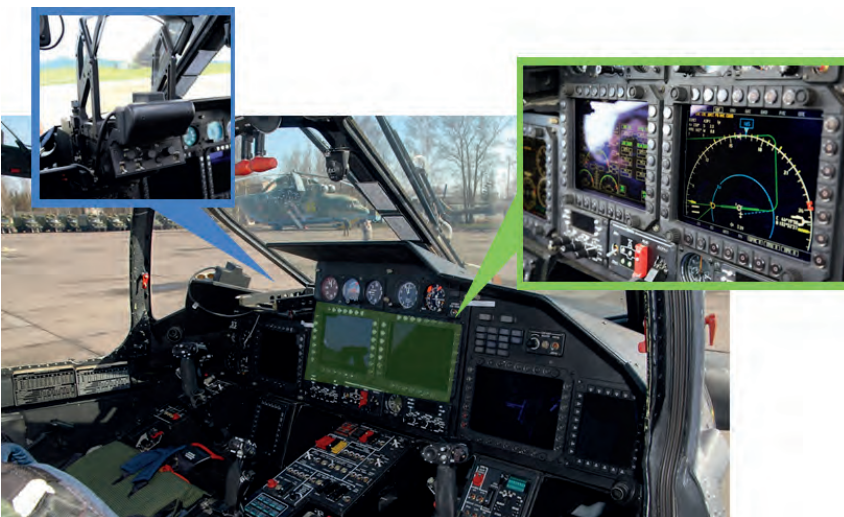
Cockpit del Ka-52, en el que se muestra tanto el HUD ILS-31 (desmontado en la imagen principal) y la información presentada en las pantallas centrales.

Dada la misión del Ka-52 y su exposición al fuego antiaéreo, las protecciones pasivas dispuestas para preservar las vidas de la tripulación se corresponden con un parabrisas reforzado capaz de soportar el im-