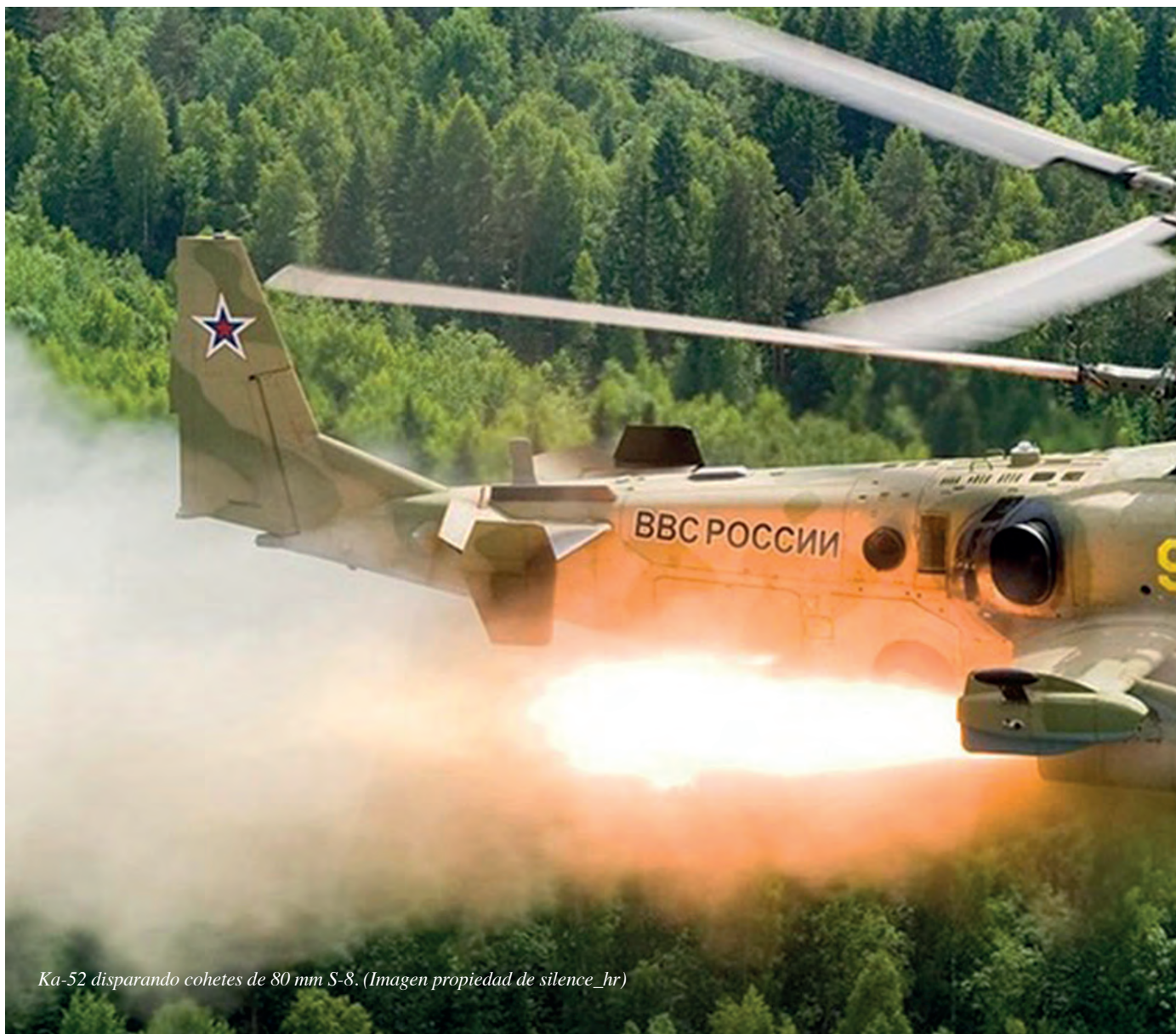
Ka-52 disparando cohetes de 80 mm S-8.

en modo dual). Siendo la motorización igual que el Ka-52 original, la variante marina incorpora en su rotor un conjunto de rótulas elastoméricas en las juntas de las palas, que le permiten operar con total efectividad cuando la configuración de combate adoptada implique un peso máximo al despegue superior al del Ka-52 terrestre.