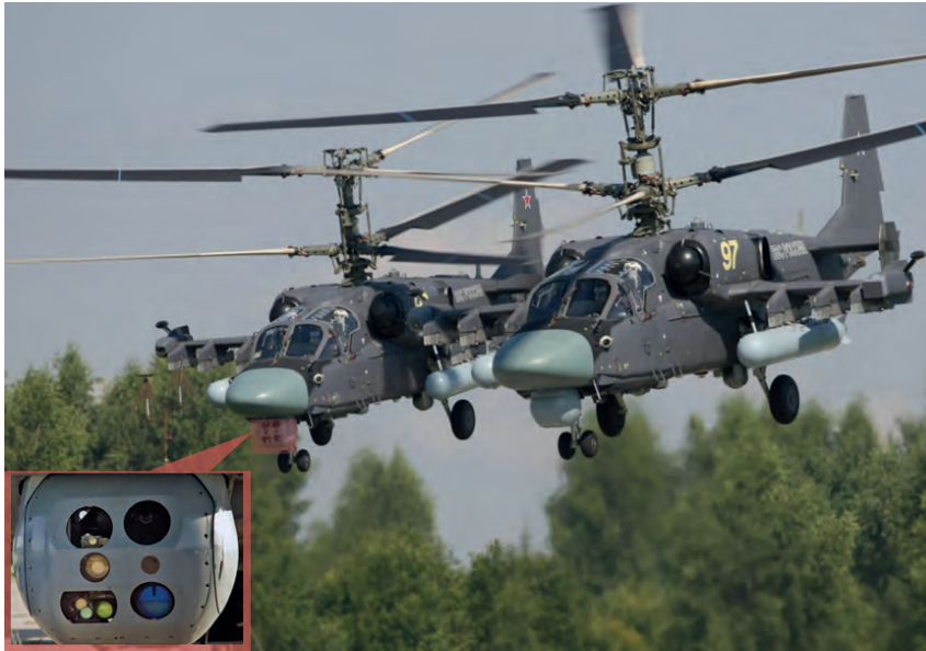
Sendos Ka-52 en vuelo. A destacar el punto derecho (izquierdo en la foto), que lleva desplegada la torreta GOES-451, cuyo imagen en detalle, correspondiente a la última revisión de este equipo, se muestra en la figura.

pacto directo de proyectiles de calibre hasta 12,7 mm. El morro también está reforzado, en esta ocasión, contra munición del calibre 23 mm, empleando un método de fabricación de tipo sándwich, en el que se disponen dos capas de armadura, con una cámara de aire intermedia.