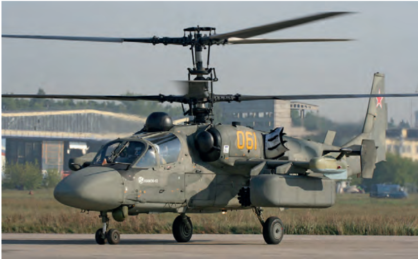
Primer prototipo del Ka-52 Alligator.

guiada y de una suite completa de aviónica que permite la operación todotiempo, el Ka-52 también era el indicado para llevar a cabo misiones de soporte aéreo cercano y antitanque con mayor éxito que el Mi-28N. Siendo sometido a una rigurosa evaluación positiva por parte de las autoridades, que coincidieron plenamente con lo expuesto por Mikheev, el Ka-52 vio aumentado espectacularmente el número de pedidos en 2011 respecto a la orden original, del orden de entre 100 a 140 helicópteros, de tal forma que actualmente, el Ka-52 está siendo entregado a la fuerza aérea y desplegado en unidades de combate de primera línea en mayores cantidades que el Mi-28N, siendo el total estimado de unidades entregadas hasta el año 2020 de al menos 143, a un precio por unidad del año fiscal 2012 de 25,13 millones de dólares.