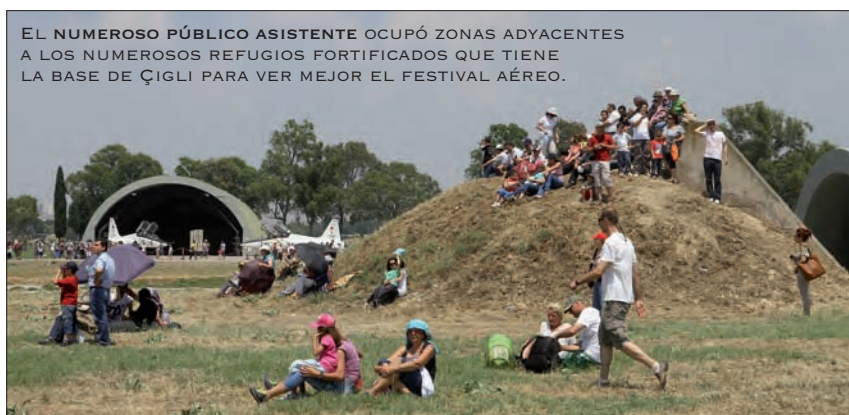
EL NUMEROSO PÚBLICO ASISTENTE OCUPÓ ZONAS ADYACENTES A LOS NUMEROSOS REFUGIOS FORTIFICADOS QUE TIENE LA BASE DE ÇIGLI PARA VER MEJOR EL FESTIVAL AÉREO.

za una espectacular exhibición, que incluye lanzamiento de "chaffs" y bengalas. En total tres pilotos turcos están entrenados para realizar esta tabla, el mayor (comandante) Keles y los capitanes Batmaz y Ahabab.