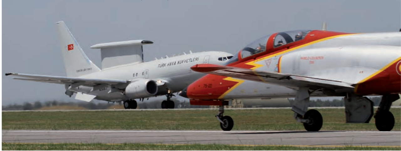
UN C-101 DE LA PATRULLA ÁGUILA, RODANDO HACIA LA CABECERA, SE CRUZA CON UN BOEING 737 TURCO DE AIRBORNE EARLY WARNING AND CONTROL/ALERTA TEMPRANA Y CONTROL AEROTRANSPORTADO (AEW&C).

LA FUERZA AÉREA DE TURQUÍA, CON OCASIÓN DE SU CENTENARIO, HA DESTINADO, CON UNA DECORACIÓN ESPECIAL, UNO DE SUS F-16C A CREAR EL EQUIPO "SOLO TÜRK", QUE REALIZA UNA BRILLANTE TABLA DE EXHIBICIÓN ACROBÁTICA.