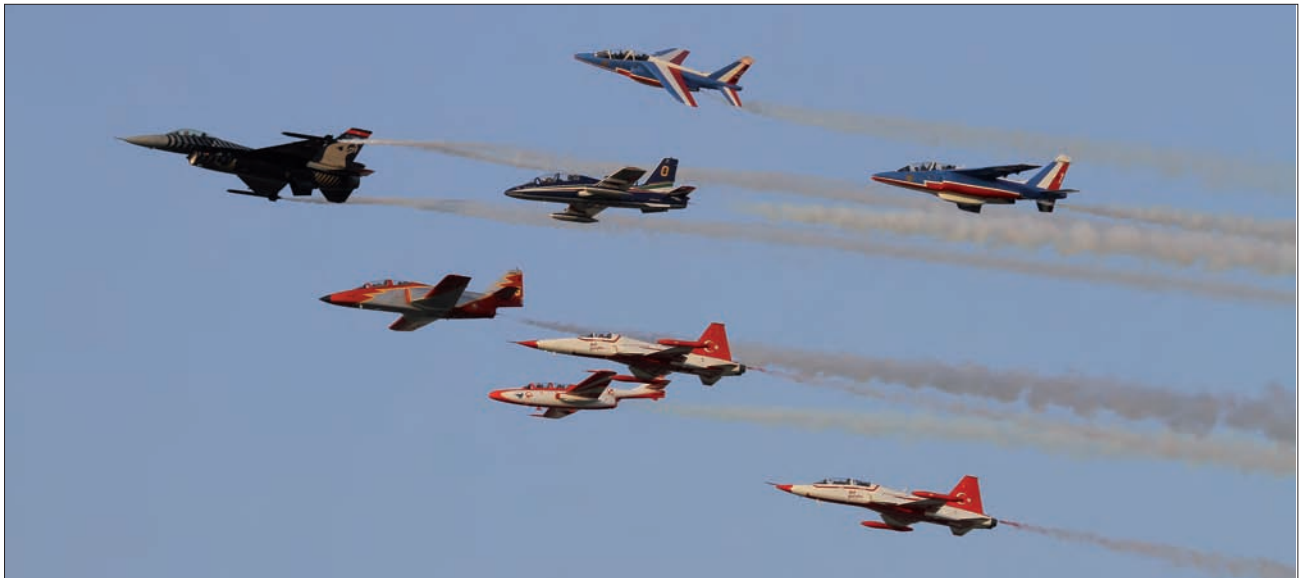
UNA DE LAS NOVEDADES DEL FESTIVAL DEL CENTENARIO DE LA AVIACIÓN MILITAR TURCA FUE PLANIFICAR UNA FORMACIÓN MIXTA DE AVIONES DE LAS PATRULLAS PARTICIPANTES, ENTRE LOS QUE ESTABA UN C-101 ESPAÑOL, ENCABEZADA POR EL F-16 "SOLO TÜRK".

de fabricación rusa está llegando al final de su vida operativa en Europa, lo que no es óbice para que, como se pudo ver en Izmir, lo empleen las Fuerzas Aéreas de Croacia, Eslovaquia, Hungría, Rumania y Serbia.