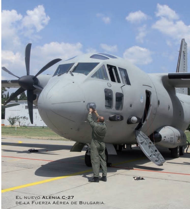
EL NUEVO ALENIA C-27 DE LA FUERZA AÉREA DE BULGARIA.

FAT, lo que facilitará ir dando de baja los antiguos T-37, los T-Birds.