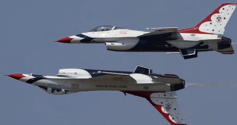
UN BUEN ESPEJO DE DOS F-16 DE LA PATRULLA "THUNDERBIRDS"/PÁJAROS TRUENO DE LA USAF.