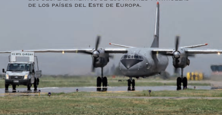
UN APARATO DE FABRICACIÓN RUSA ANTONOV AN-26 FUE EL TRANSPORTE QUE MÁS SE VIO, APOYANDO LOS DESPLAZAMIENTOS DE LOS AVIONES Y PATRULLAS DE LOS PAÍSES DEL ESTE DE EUROPA.