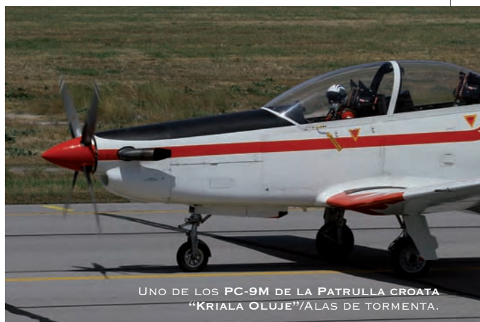
UNO DE LOS PC-9M DE LA PATRULLA CROATA "KRIJALA OLUJE"/ALAS DE TORMENTA.

presa Turkish Aerospace Industries/Industria aerospacial turca (TAI), y que recoge parte de la gran experiencia obtenida por la industria turca en su colaboración con las empresas de Defensa de Israel. Recordemos que hasta el año pasado, a raíz del incidente de la Flotilla de ayuda a la Franja de Gaza que controla Hamas, Turquía e Israel rompieron oficialmente sus relaciones en materia de Defensa.