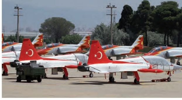
LOS AVIONES NF-5 DE LA PATRULLA TURCA "TURKISH STARS" EN LA PLATAFORMA DE ÇIGLI; FRENTE A ELLOS LOS C-101 DE LA "PATRULLA ÁGUILA".