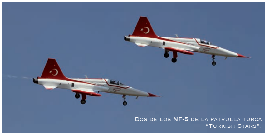
DOS DE LOS NF-5 DE LA PATRULLA TURCA "TURKISH STARS".