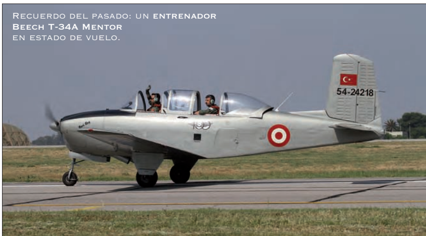
RECUERDO DEL PASADO: UN ENTRENADOR BEECH T-34A MENTOR EN ESTADO DE VUELO.

cierto eran de los que acaba de adquirir el país árabe en Bélgica, procedentes de los dados de baja por esta última nación de la OTAN.