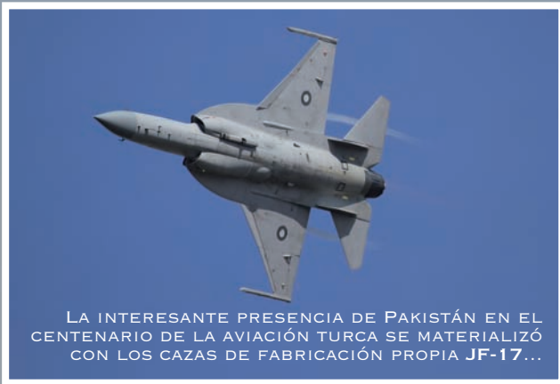
LA INTERESANTE PRESENCIA DE PAKISTÁN EN EL CENTENARIO DE LA AVIACIÓN TURCA SE MATERIALIZÓ CON LOS CAZAS DE FABRICACIÓN PROPIA JF-17...