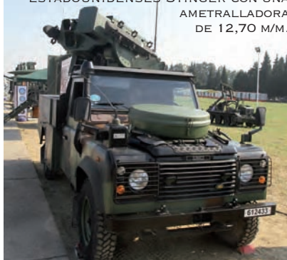
ENTRE EL MATERIAL ANTIAÉREO EXPUESTO SE PUDO VER EL SISTEMA DE CORTO ALCANCE ZIPKIN, CREADO POR LA EMPRESA TURCA ASELSAN, QUE INTEGRA DOS LANZADORES DE MISILES ESTADOUNIDENSES STINGER CON UNA AMETRALLADORA DE 12,70 M/M.

truido por la empresa Israel Aerospace Industries (IAI).