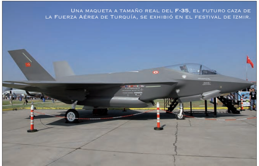
UNA MAQUETA A TAMAÑO REAL DEL F-35, EL FUTURO CAZA DE LA FUERZA AÉREA DE TURQUÍA, SE EXHIBIÓ EN EL FESTIVAL DE IZMIR.

Una de las plataformas de la base mostraba una excelente selección de aviones en estática. Así el público pudo incluso entrar en las cabinas de aparatos tan modernos como los Eurofighter de la Luftwaffe y un Gripen húngaro, pasando por las de aviones clásicos como las de un Mig-29 búlgaro o de una pareja de F-16 de la Fuerza Aérea de Jordania, que por