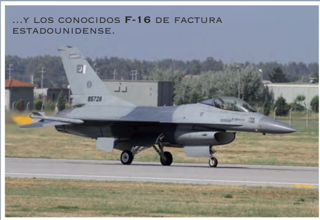
...Y LOS CONOCIDOS F-16 DE FACTURA ESTADOUNIDENSE.