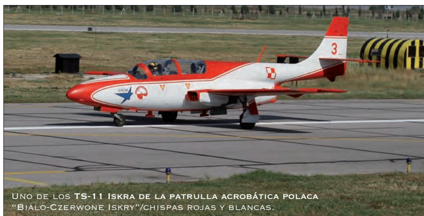
UNO DE LOS TS-11 ISKRA DE LA PATRULLA ACROBÁTICA POLACA "BIALO-CZERWONE ISKRY"/CHISPAS ROJAS Y BLANCAS.