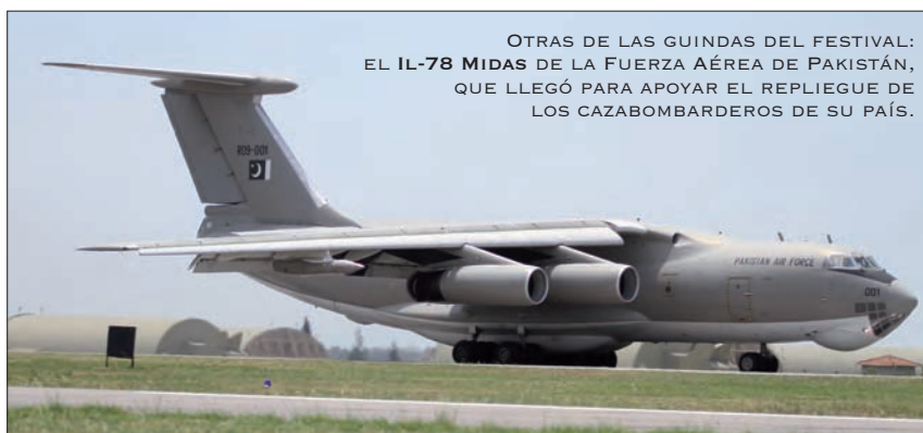
OTRAS DE LAS GUINDAS DEL FESTIVAL: EL IL-78 MIDAS DE LA FUERZA AÉREA DE PAKISTÁN, QUE LLEGÓ PARA APOYAR EL REPLIEGUE DE LOS CAZABOMBARDEROS DE SU PAÍS.