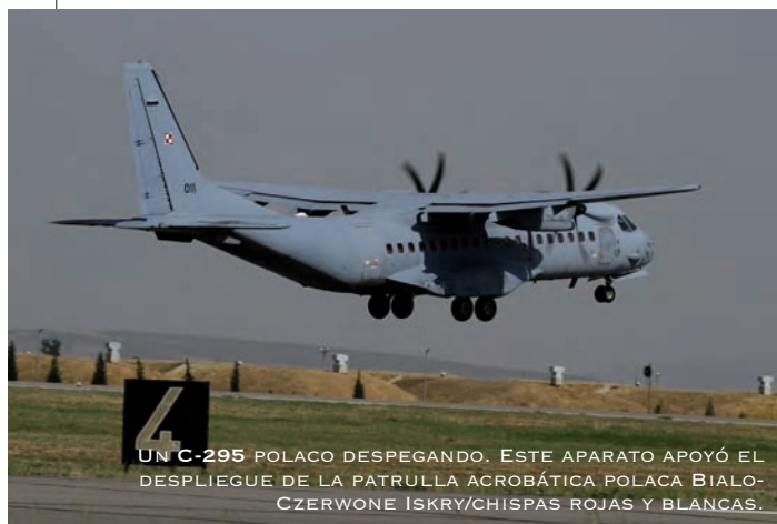
UN C-295 POLACO DESPEGANDO. ESTE APARATO APOYÓ EL DESPLIEGUE DE LA PATRULLA ACROBÁTICA POLACA BIALOCZERWONE ISKRY/CHISPAS ROJAS Y BLANCAS.

Lo más novedoso han sido los tres JF-17 Thunder, pertenecientes al 26º Escuadrón "Black Spiders". Estos cazas, diseñados y construidos, a medias, entre Pakistán y China, están propulsados por la poderosa turbina Klimov RD-33, la misma que equipa los cazas rusos Mig-29, aunque en este caso sean dos. También llegaron un par de F-16 del 11º Escuadrón, desde su Base de Mushaf. Esta Unidad es la responsable de formar a todos los pilotos paquistaníes de F-16, misión