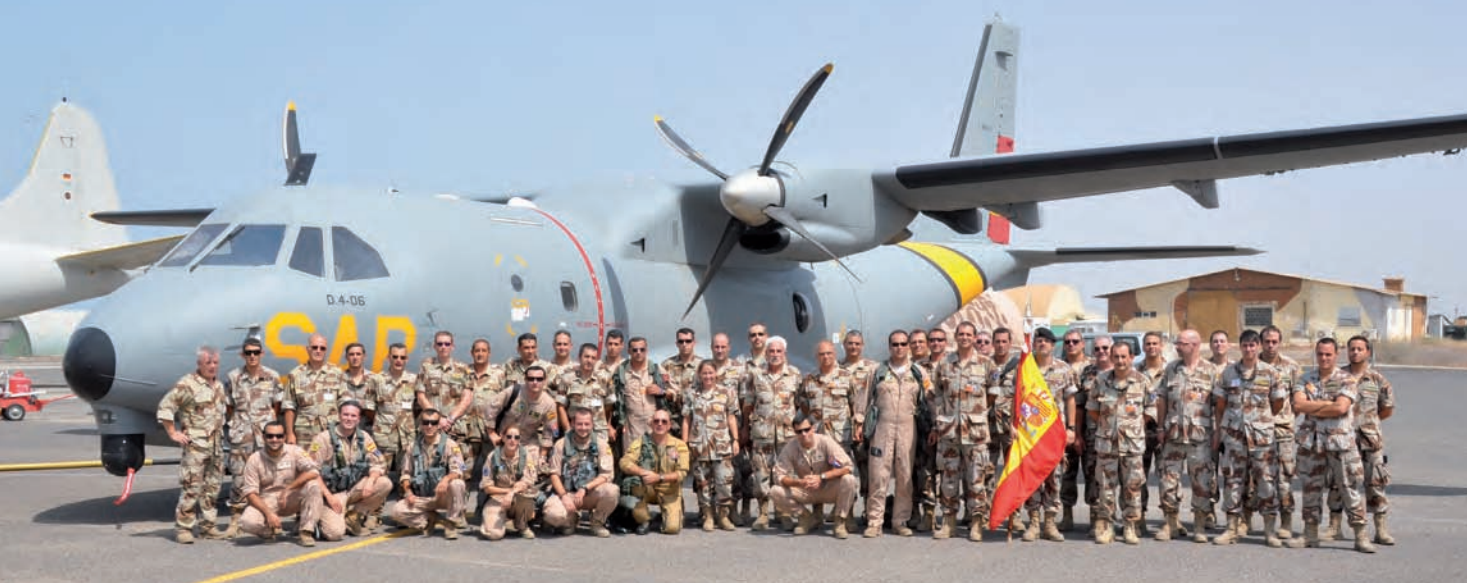
Julián Moreno Salguero

misión completo, un sistema AIS (Sistema de Identificación Automática) de identificación de barcos de superficie y de transmisión de datos y un sistema de comunicaciones por satélite y HF para voz y datos.