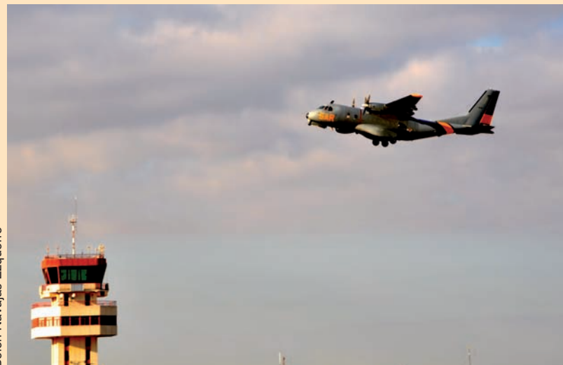
Belén Navajas Ezquerro