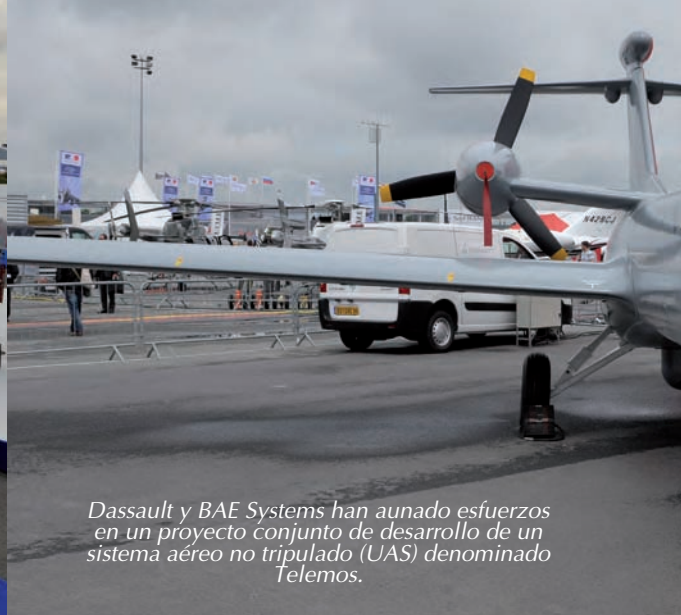
Dassault y BAE Systems han aunado esfuerzos en un proyecto conjunto de desarrollo de un sistema aéreo no tripulado (UAS) denominado Telemos.

El Panther combina el vuelo con ala fija y ala rotatoria, aunque la forma responde a una aeronave de ala fija.