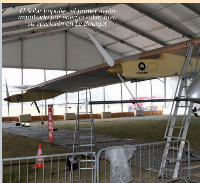
El Solar Impulse, el primer avión impulsado por energía solar, hizo su aparición en Le Bourget