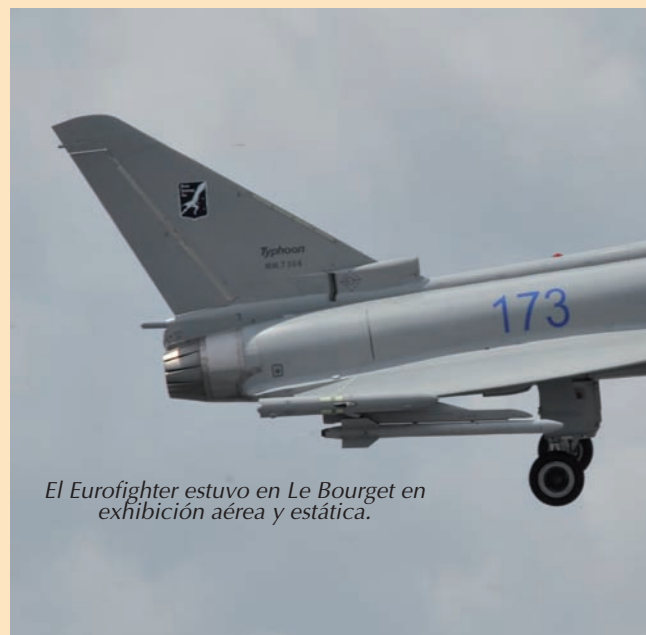
El Eurofighter estuvo en Le Bourget en exhibición aérea y estática.

El Telemos como solución responde a la mayoría de los requerimientos del proyecto de UAV británico Scavenger, cuyo coste asciende a 3.250 millones de dólares. Esto hace imposible la supervivencia de los dos programas. Por otro lado el Telemos debe ser lanzado en breve plazo para evitar la necesidad de soluciones interinas. El Telemos está previsto que entre en servicio en una configuración inicial IOC en una fecha entre el 2015 y 2020.