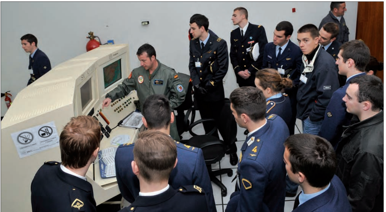
Visita a las instalaciones de la Academia General del Aire por alumnos de otras academias europeas.

• Una parrilla digital ubicada en la página web del proyecto ( www.emilyo.eu ) en el que cada Academia ofertará los módulos que crea conveniente o incluso toda su currícula, facilitando así la elección de posibles destinos de