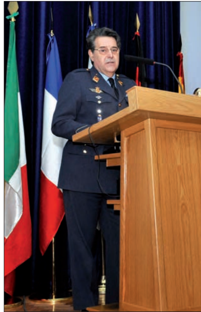
El general Arnáiz (actual SEJEMA) en seminario UE de PCSD, en la Academia General del Aire en marzo de 2010.

Se decide por tanto crear 5 grupos de trabajo y 7 líneas de desarrollo, para tratar de desarrollar el programa, definidos del siguiente modo: