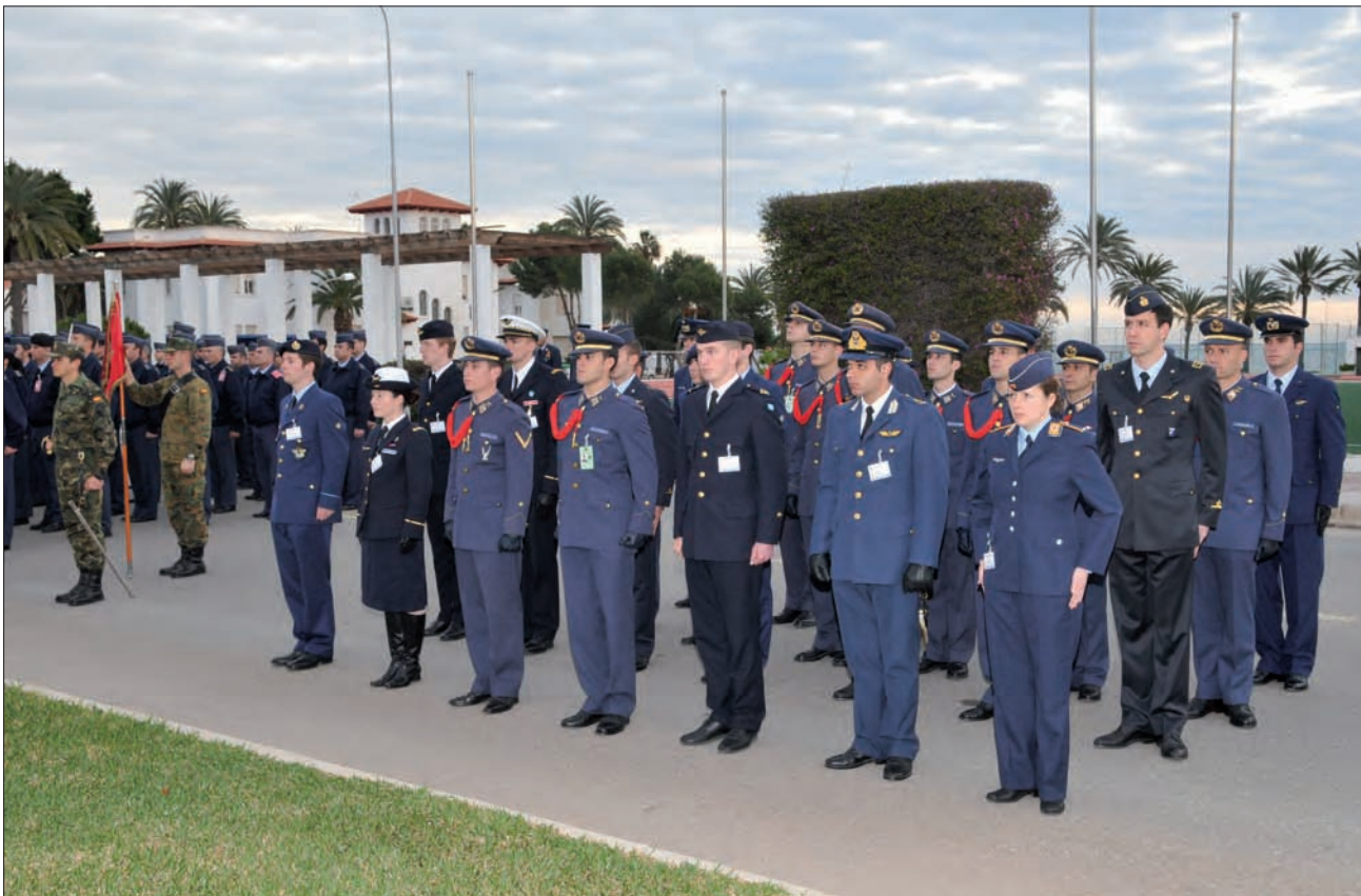
Acto de clausura, seminario PCSD en la AGA, marzo de 2010.

Los EEMM participan y la enseñanza (los seminarios) es de calidad, pero resulta caro y es una duplicidad de esfuerzo con respecto a la idea inicial de incluir los módulos en la curricula para posteriormente poder ofrecerlos en los intercambios bilaterales o multilaterales de alumnos a través de una parrilla informática de acceso limitado a las Academias.