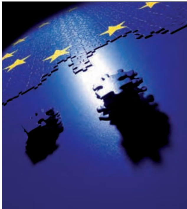
DIGEREM lidera en España el programa Erasmus Militar.

La formación que a partir del próximo año adquieren los oficiales de las Fuerzas Armadas, constará de una parte de formación universitaria (formación de grado) y otra de formación militar general y específica. Dado que es requisito indispensable para acceder a las escalas el haber supera-