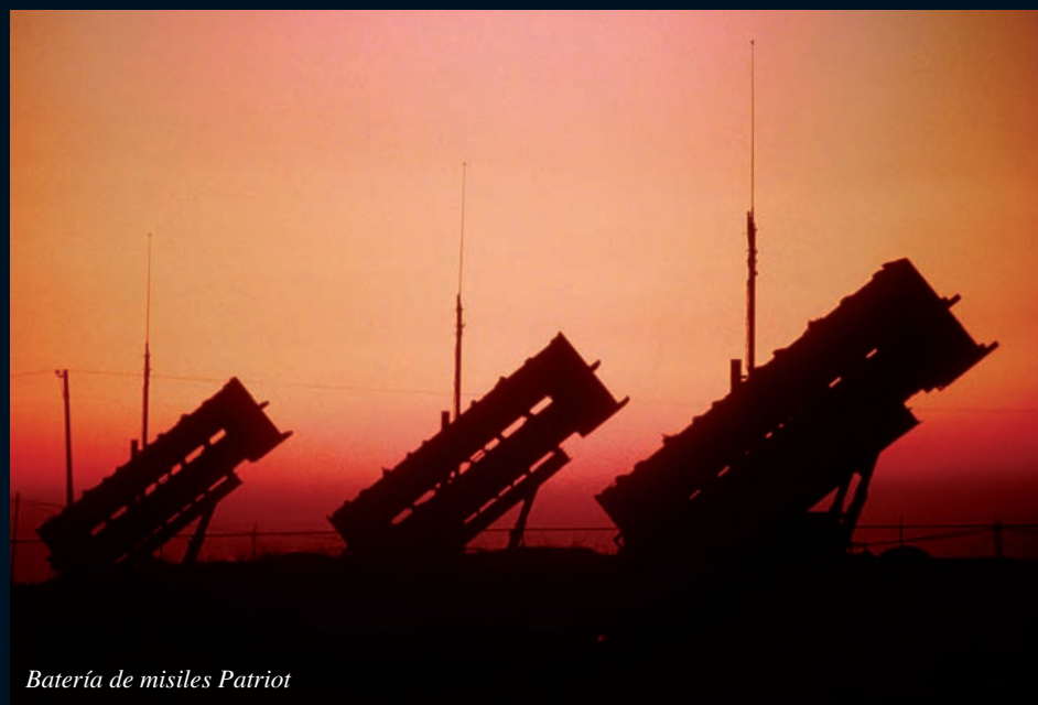
Batería de misiles Patriot

misiles balísticos. De momento, la fiabilidad de los sistemas antimisiles ha demostrado una eficacia limitada. Los disparos hechos durante las fases de prueba y certificación han sido, generalmente, contra objetivos “controlados” en tipo, lugar y hora de lanzamiento, trayectoria, etc. En conflictos reales su índice de aciertos ha sido muy variable, escaso en algunos casos, y se puede plantear una gran duda ya que jamás, afortunadamente, uno de estos misiles ha tenido que detener o destruir un misil balístico nuclear lanzado por un enemigo con