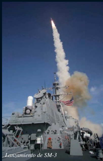
Lanzamiento de SM-3

tes de fuego amigo, al abatir a un Tornado de la R.A.F. británica y a un FA-18 "Hornet" de la Navy estadounidense. En ambos derribos las tripulaciones perdieron la vida. Pensado en los años sesenta como arma antiaérea comenzó a entrar en servicio en 1984,