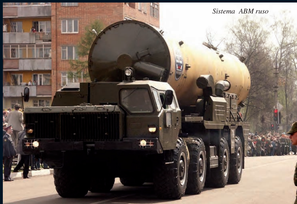
Sistema ABM ruso