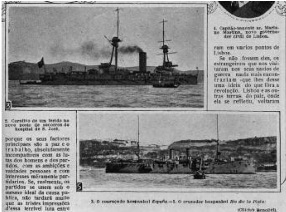
Noticias de barcos españoles en Lisboa después de la revolución de mayo de 1915 ( Ilustração Portuguesa , núm. 484, 31 de mayo de 1915)

Este acercamiento a España, antes de 1914, obedeció a que Inglaterra tenía como objetivo evitar a todo trance que Alemania obtuviese puertos fuera del Mar del Norte que le permitieran tener libre acceso al océano. Y España era una de las posibilidades, especialmente sus islas Canarias o la costa norte de su protectorado marroquí. Londres propuso a Madrid un entendimiento simple: estaba dispuesto a apoyar las pretensiones españolas en Marruecos y a reconstruir la Escuadra, destruida en 1898. El precio consistía en garantizar que no se otorgaría concesión alguna a una potencia extranjera para instalaciones navales en las islas Canarias u otras zonas del litoral español sin la aprobación previa del Reino Unido. España aceptó, comenzó su expansión en Marruecos con luz verde de Francia e Inglaterra, y rehízo la industria naval con apoyo británico 5 .