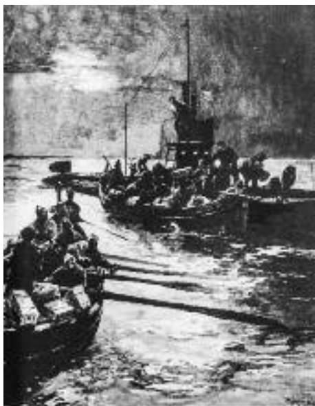
Así vieron los franceses, en su momento, el apoyo dado por los pescadores españoles a los submarinos alemanes ( Le Miroir , núm. 105, 28 de noviembre de 1915)

España hubo varias empresas más con conexiones en Alemania. Los británicos identificaron las siguientes: Actividad, Bilbaína de Navegación y Unión. Pero había otros, no conectados a la navegación comercial. Por ejemplo, un submarino alemán habría regresado a Zeebrugge con mineral de hierro proveniente de las siguientes firmas con sede en Bilbao: Sociedad Anónima Minas de Cala, Compañía de Arragola y Pepita de Galdámez. En noviembre de 1917, otro submarino habría recibido explosivos de la Sociedad Anónima Española de Dinamita 33 .