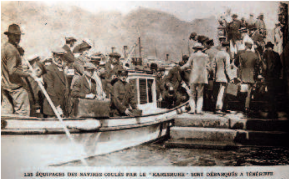
Desembarco en la isla de Tenerife de las tripulaciones de los buques aliados hundidos por el crucero alemán Karlsruhe ( Le Miroir , núm. 105, 28 de noviembre de 1915)

tendrían derecho al 2 por 100 del valor del buque y de la carga, en caso de pérdida total 68 .