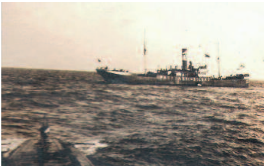
El vapor español Pagasarri (3.287 t) antes de ser hundido por el U-35, el 11 de agosto de 1916, frente a Cerdeña. Este barco también hizo un viaje entre Inglaterra e Italia transportando carbón

tripulación –excepto el personal de máquinas, a cuyo jefe se le ordenó dar la máxima potencia–, bajo la dirección del primer oficial, ocuparon sus puestos de abandono del buque.