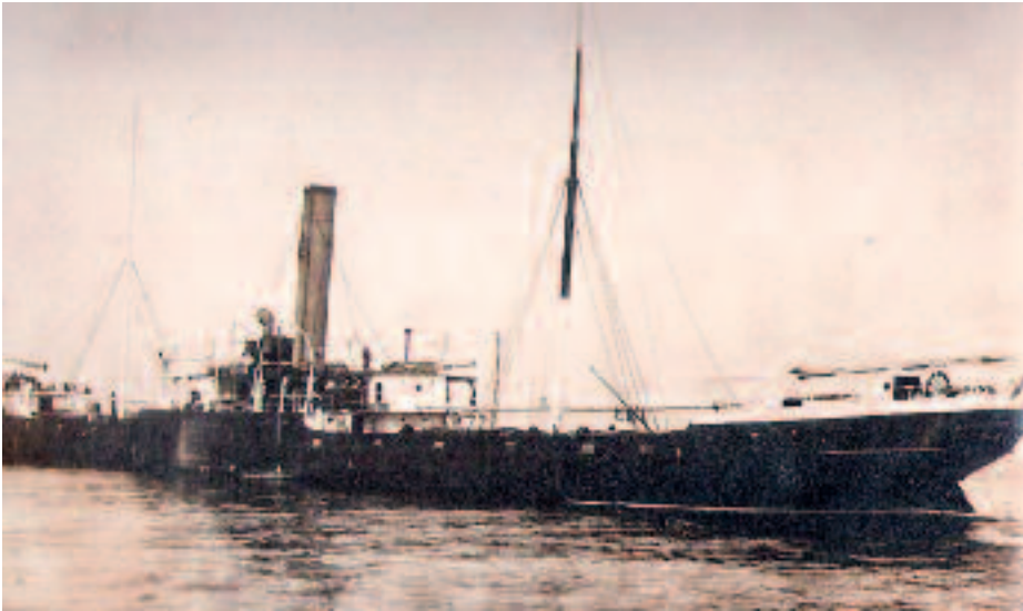
El vapor español Ganekogorta Mendi (3.061 t) antes de ser hundido por el U-35, el 9 de agosto de 1916, en el Mediterráneo, 10' al NE de Port Vendres

Gijón, Juan Fries. Aparentemente, este último utilizaría dos veleros españoles, Manuel y Purísima Concepción , en el transporte de correspondencia de ida y vuelta para los submarinos imperiales, correspondencia que incluía periódicos alemanes con dieciocho días de retraso. Estas operaciones se llevarían a cabo los días 5 y 12 de cada mes, junto al cabo Quejo, y el cónsul pagaría 50.000 pesetas anuales por el uso de dichos barcos 57 .