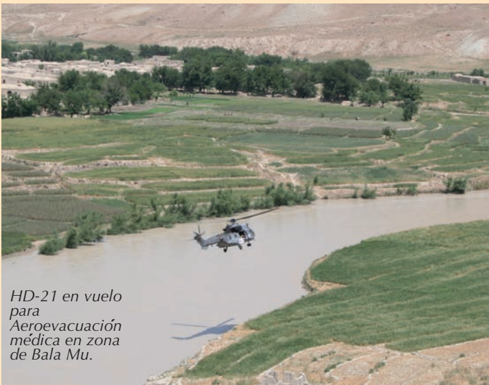
HD-21 en vuelo para Aeroevacuación médica en zona de Bala Mu.

Las PRT (Equipos de reconstrucción provincial) de la zona oeste están situadas en las capitales de las cuatro provincias. PRT de Herat (liderada por Italia), PRT de Qual-eh-naw, capital de Badghis (liderada por España), PRT de Farah (liderada por EE.UU.) y PRT de Chaghcharan, capital de Ghor (liderada por Lituania).