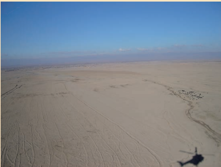
Paisaje árido y polvoriento en Afganistán.

• Prioridad B - Cirugía Urgente: el paciente necesita una operación quirúrgica en menos de 2 horas.