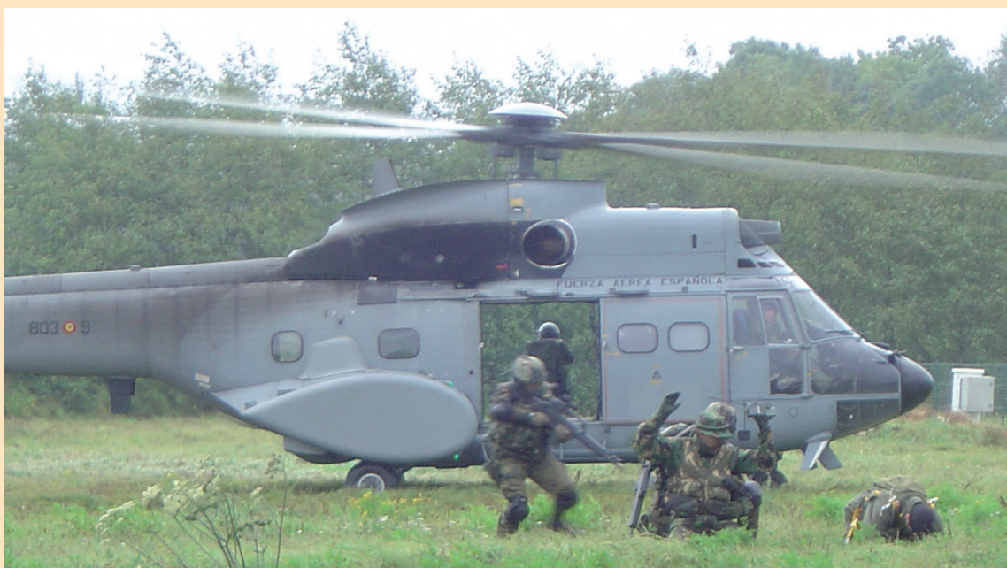
Recuperación de Supervivientes en ejercicio CSAR.

El personal de HELISAF con su enorme esfuerzo, su sacrificio personal y familiar y su profesionalidad fuera de toda duda, demostrada en cada una de sus misiones contribuye día a día a enaltecer el prestigio de nuestro Ejército del Aire. •