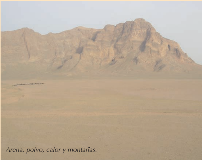
Arena, polvo, calor y montañas.