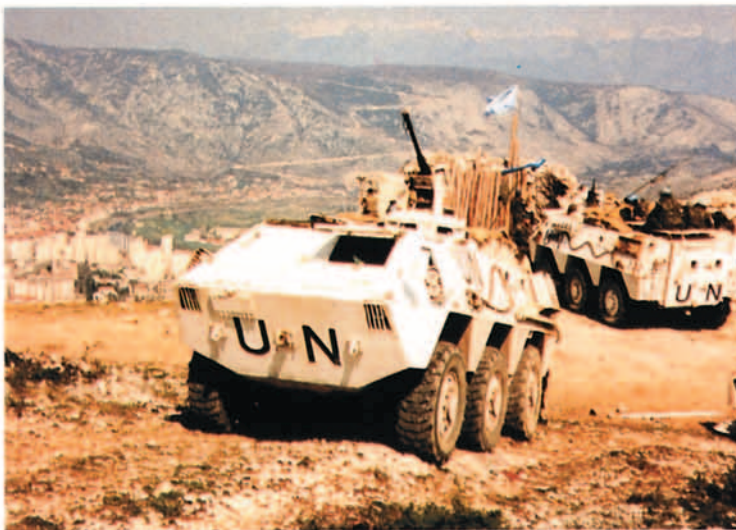
BMR del Ejército del Aire en Bosnia, mayo de 1994.

servizio para el control del tráfico marítimo en la zona.