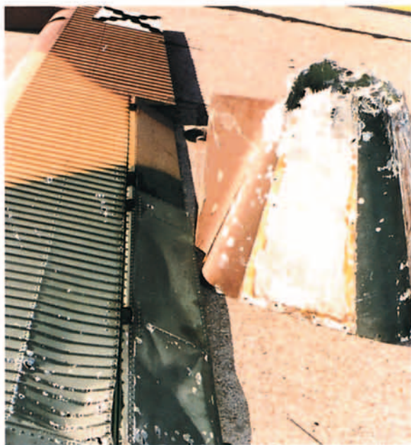
Estado en que quedó el C-212 del Ala 37 que sufrió el fuego antiaéreo cuando volaba entre Zagreb y Split.

Desde los inicios de la puesta en marcha de esta operación, se da comienzo al envío de expertos de Estado Mayor en operaciones aéreas para reforzar y formar parte de los órganos de decisión de la Alianza implicados en el conflicto. Así, tanto el CAOC de Vicenza como el Estado Mayor de AMSOUTH contaría con la colaboración y con el bien hacer de nuestros hombres para coordinar y