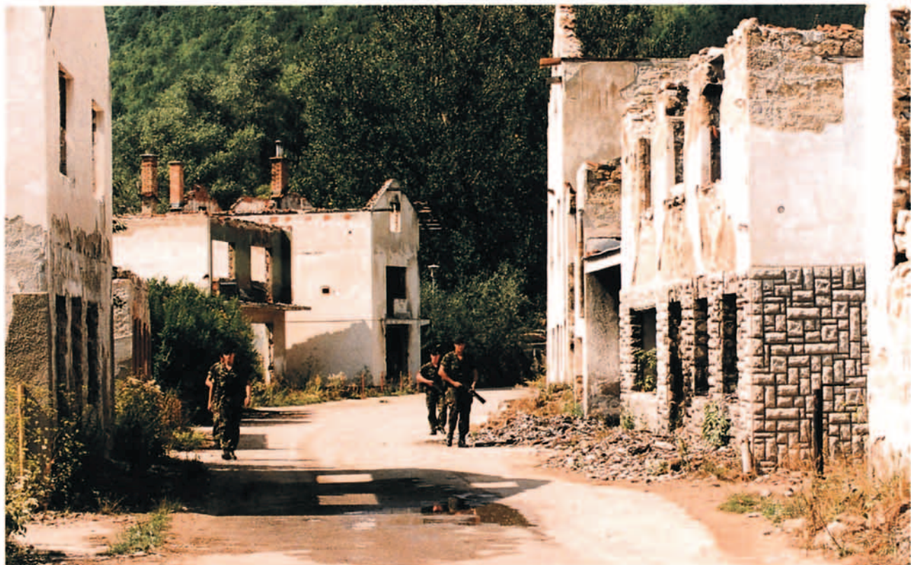
Fuerzas de la OTAN integradas en la Fuerza de Implantación (IFOR) en sus funciones de mantenimiento de la Paz en Bosnia.

Para poder cumplimentar las misiones aéreas contempladas en dicho plan, la 5ª ATAF se vio necesitada de reforzar el Centro Aéreo de Operaciones Combinadas (CAOC) -situado en la Base Aérea de Vicenza (Italia)- como sede del Mando Aéreo Operativo organizado al efecto.