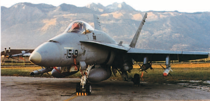
Los F-18 del Grupo 15 fueron los encargados en un primer momento para operar en los cielos de Yugoslavia.

En estas operaciones nuestros aviones realizaron una inestimable labor