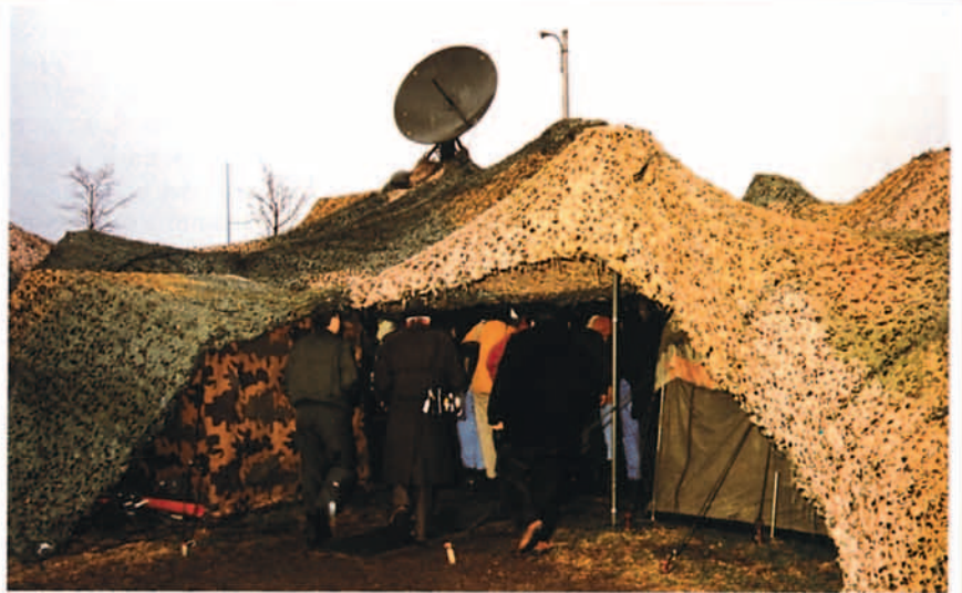
En junio de 1993 el Gobierno español adopta la decisión de que medios humanos y materiales formen parte de la operación "Deny Flight".