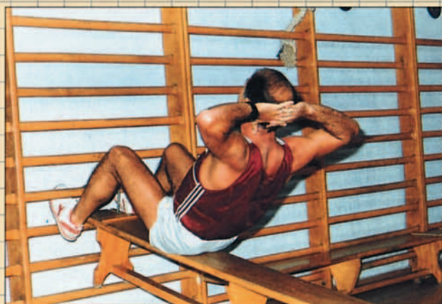
Flexión del tronco en plano inclinado.

ejercicios (ver tablas), con un breve descanso entre las series (1 a 2 minutos), para permitir la recuperación.