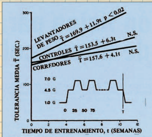
Fig. 2. Efecto de la condición física sobre la tolerancia a las +Gz.

Los efectos de esta redistribución de la sangre se concretan, en el caso de las Gz+, en una serie de sín-