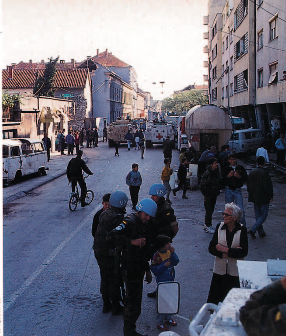
Mostar se erigió como una ciudad emblemática y representativa del conflicto, por lo que la Comunidad Europea decide buscar una solución a su problema, entendiendo que aquella podría ser extrapolada a todo el país.

Con respecto a necesidades primarias como agua y electricidad, estas no esta-