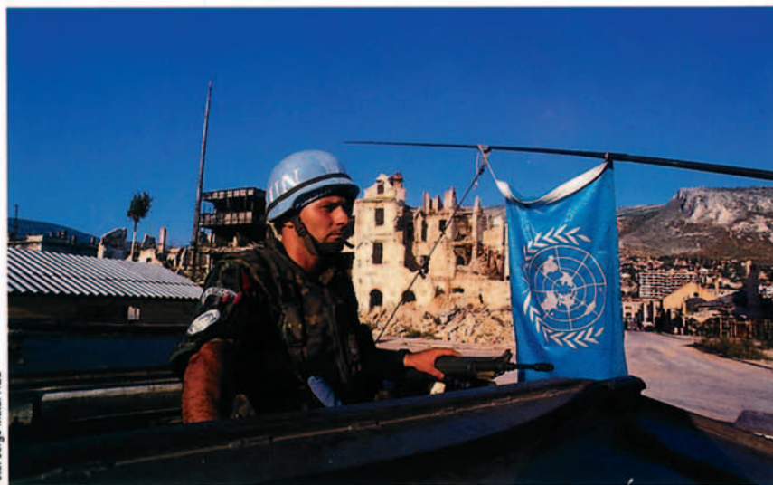
La Administración de Mostar de la Unión Europea (EUAM) tiene como misión genérica la reconstrucción de la ciudad y su desmilitarización.

Enviados por sociedades y empresas de los diferentes países anteriormente mencionados. Sus funciones se dirigen fundamentalmente al análisis de posibles mercados, ofertas de reconstrucción, viabilidad y rentabilidad de los proyectos; sus emolumen-