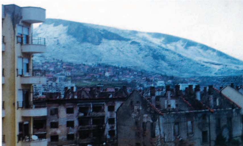
En la parte izquierda se ve la fachada del hotel Ero, reparado después del atentado que sufrió Hans Koschnick.

para el personal local musulmán que trabaja para la EUAM.