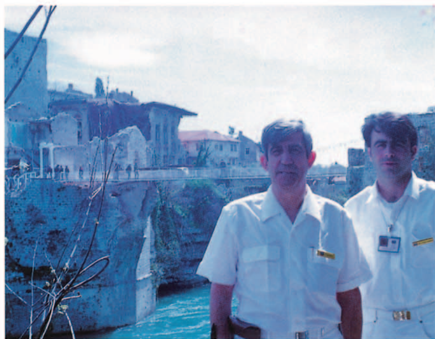
Dos miembros de la EUAM en la inauguración de la pasarela (Stari Most) sobre el río Neretva.

En la reconstrucción de Mostar se pretendía, en primer lugar, recuperar las estructuras urbanas que habían sido destruidas por las guerras y, por otra parte, la Unión Europea buscaba crear un ambiente psicosocial capaz de facilitar el retorno de la vida ciudadana a la normalidad.