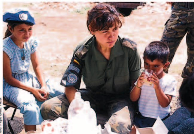
Entre el personal perteneciente a la EUAM están los seleccionados directamente por los gobiernos nacionales de los países pertenecientes a la Unión Europea y a la Organización para la Seguridad y Cooperación Europea.

Los "mosterinos", palabra acuñada recientemente por los extranjeros que trabajan en Mostar pero sin ningún tipo de arraigo popular, ya que ante la pregunta ¿de dónde eres? la respuesta siempre era: musulmán, croata o serbio; se distribuían en sus dos terceras partes en el ambiente urbano y un tercio en el rural, dedicados los primeros a la industria y los