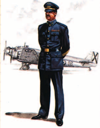
Sargento con uniforme de invierno, 1946.