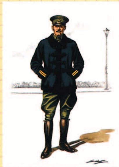
Suboficial de Aerostación, 1912.