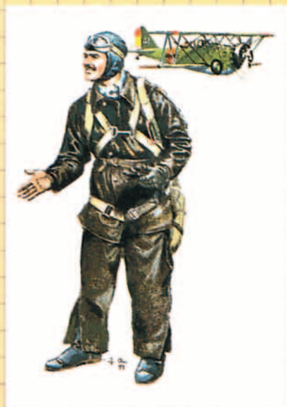
Piloto de la República, 1936.