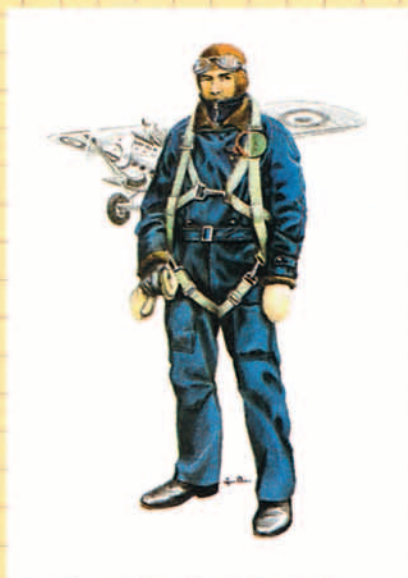
Traje de vuelo, 1933, de uso común.

la Edad Media, la fuerza más poderosa del ejército estaba formada por la Caballería, que con el perfeccionamiento de las armas portátiles de fuego primero el arcabuz y después el mosquete vió paulatinamente ocupado su lugar por la Infantería. Y es aquí, cuando el empleo de sargento alcanza su fundamentalidad al