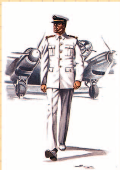
Uniforme de diario para verano, 1966.