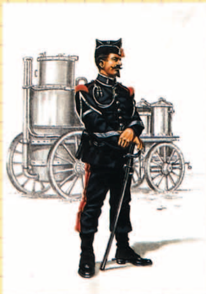
Sargento Primero de Ingenieros, 1884.