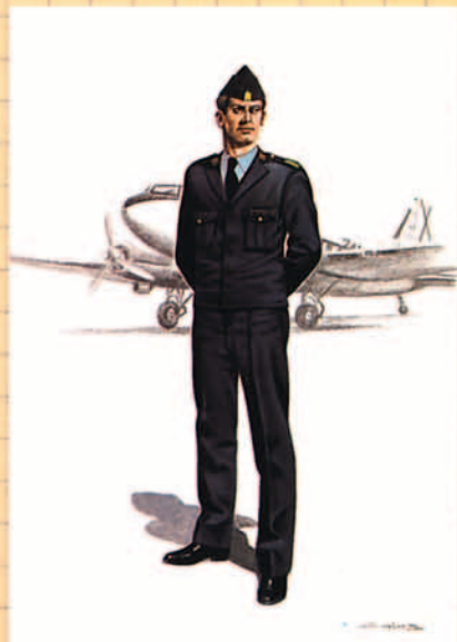
Uniforme de trabajo, 1989.