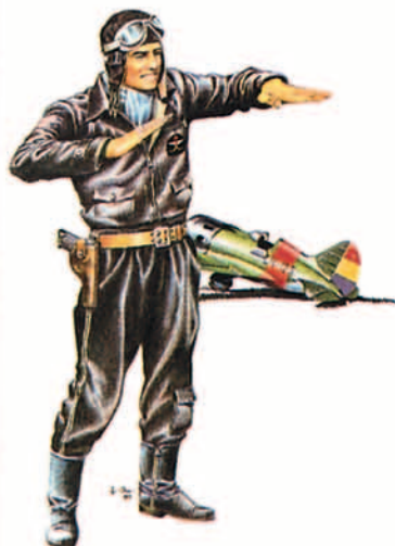
Piloto de caza gubernamental, 1937.