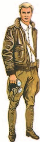
Piloto ruso, años 1936-1939.

(Sevilla). En junio de 1936 pidió el traslado al grupo 31 de Getafe, donde le sorprendió la Guerra Civil, participando en los bombardeos de la sierra y defensa de Madrid con los Breguet XIX. Al recibirse los bombarderos soviéticos Katiuskas SB-2, fue uno de los primeros españoles que los pilotaron, participando en las batallas de Pingarrón, Jarama, Brunete, toma de Belchite y frente de Aragón, operando desde Reus. Por su actuación, tuvo tres ascensos por méritos de guerra. El 15 de octubre de 1937 al mando de la 3ª Escuadrilla de Katiuskas bombardeó el Aeródromo de Sanjurjo (Zaragoza), destruyendo seis Heinkel-46 y seis Fiat CR-32. Durante el invierno de 1937-38, intervino con su escuadrilla en la Batalla de Teruel y después en la del Ebro. El 16 de diciembre de 1938 pese al mal tiempo bombardeó la base nacional de «La Cenia», destruyendo varios ME-109, aunque perdió dos de sus bombarderos, al internarse en territorio enemigo. Por los bombardeos italianos sobre Barcelona, pidió permiso para despegar del norte de Cataluña para bombardear las fábricas Fiat en Turín (Italia) lo que no se le concedió. Ascendido a teniente coronel por méritos de guerra, en septiembre de 1938 se le otorgó la Placa de Laureado de Madrid, único aviador que la obtuvo. Al final de la guerra aterrizó con su avión en Orán (Argelia), donde estuvo hasta 1942, marchando después a Méjico. Regresó a España en 1967 donde reside actualmente. Le fue reconocida la condición de militar profesional.