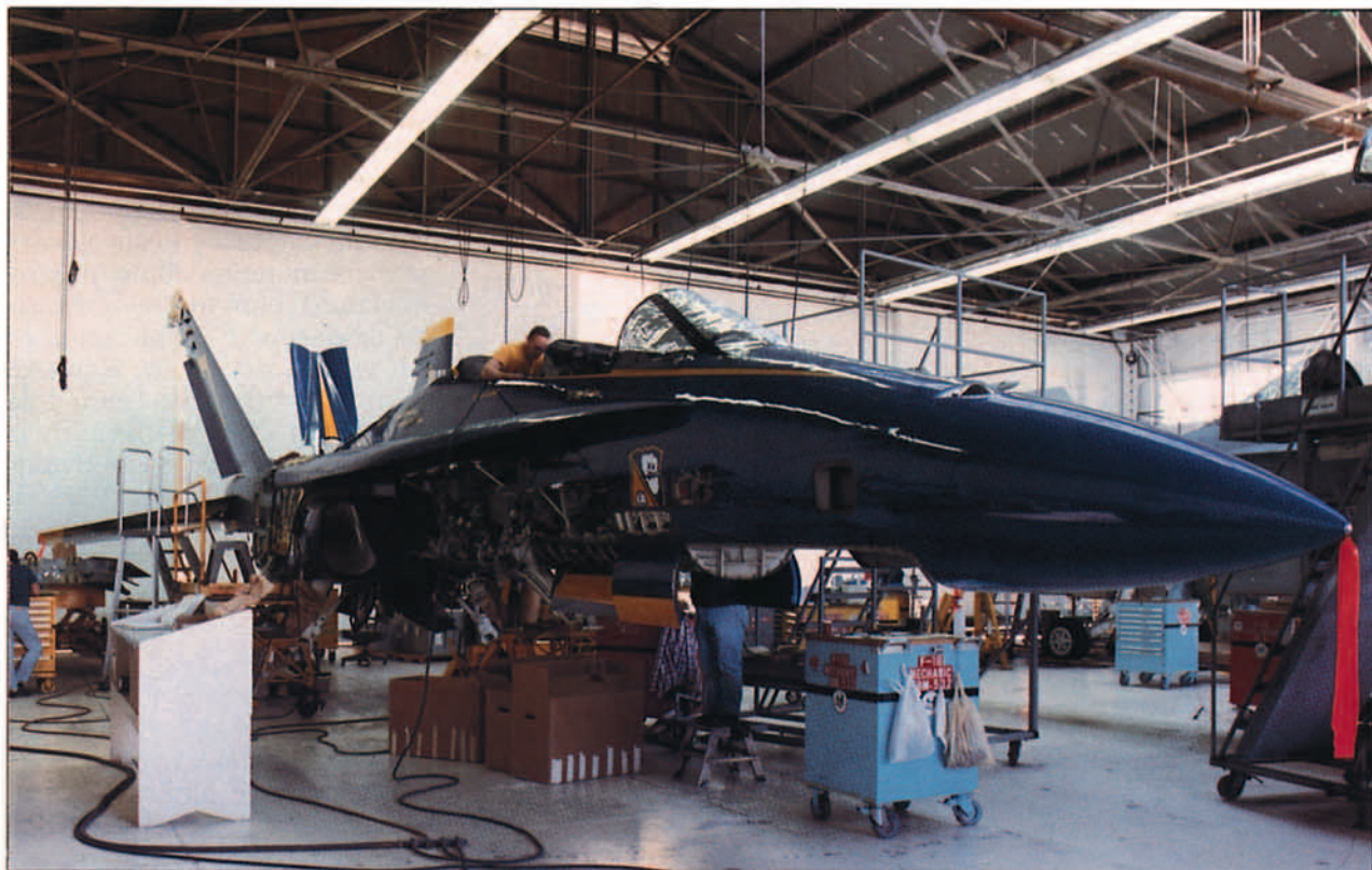
El F-18 "Hornet" es la asignación más reciente. El de la fotografía pertenece a la patrulla acrobática de la USN "Blue Angels".

el hecho de que su presupuesto de gastos alcanza los 373 millones de dólares (tabla 4).