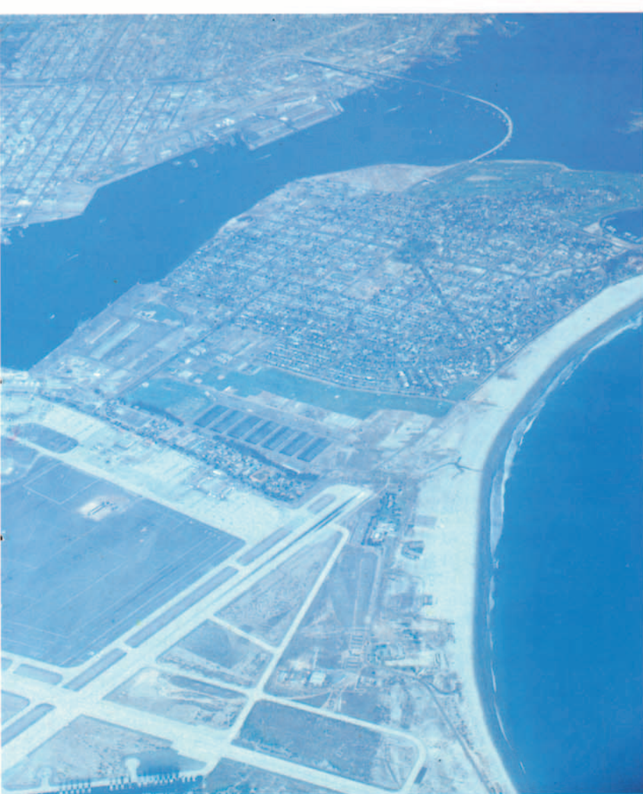
La Estación Aeronaval de North Island se encuentra ubicada en San Diego.