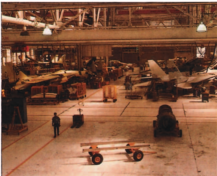
El F-14 "Tomcat" es uno de los sistemas mantenidos en tercer escalón.

Aunque el método de contabilidad de costos y de presupuestación de Defensa en EE.UU. difiere del nuestro, ya que se presupuestan tareas y actividades de forma específica, en competencia económica entre los Navdep y empresas civiles, actuando unos y otros según los casos como contratista principal de una labor y, por lo tanto, pagando las tareas encomendadas a los otros. Una idea del volumen monetario que mueve anualmente el Navdep la da