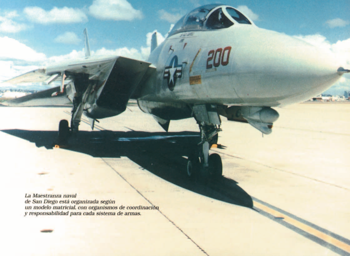
La Maestranza naval de San Diego está organizada según un modelo matricial, con organismos de coordinación y responsabilidad para cada sistema de armas.