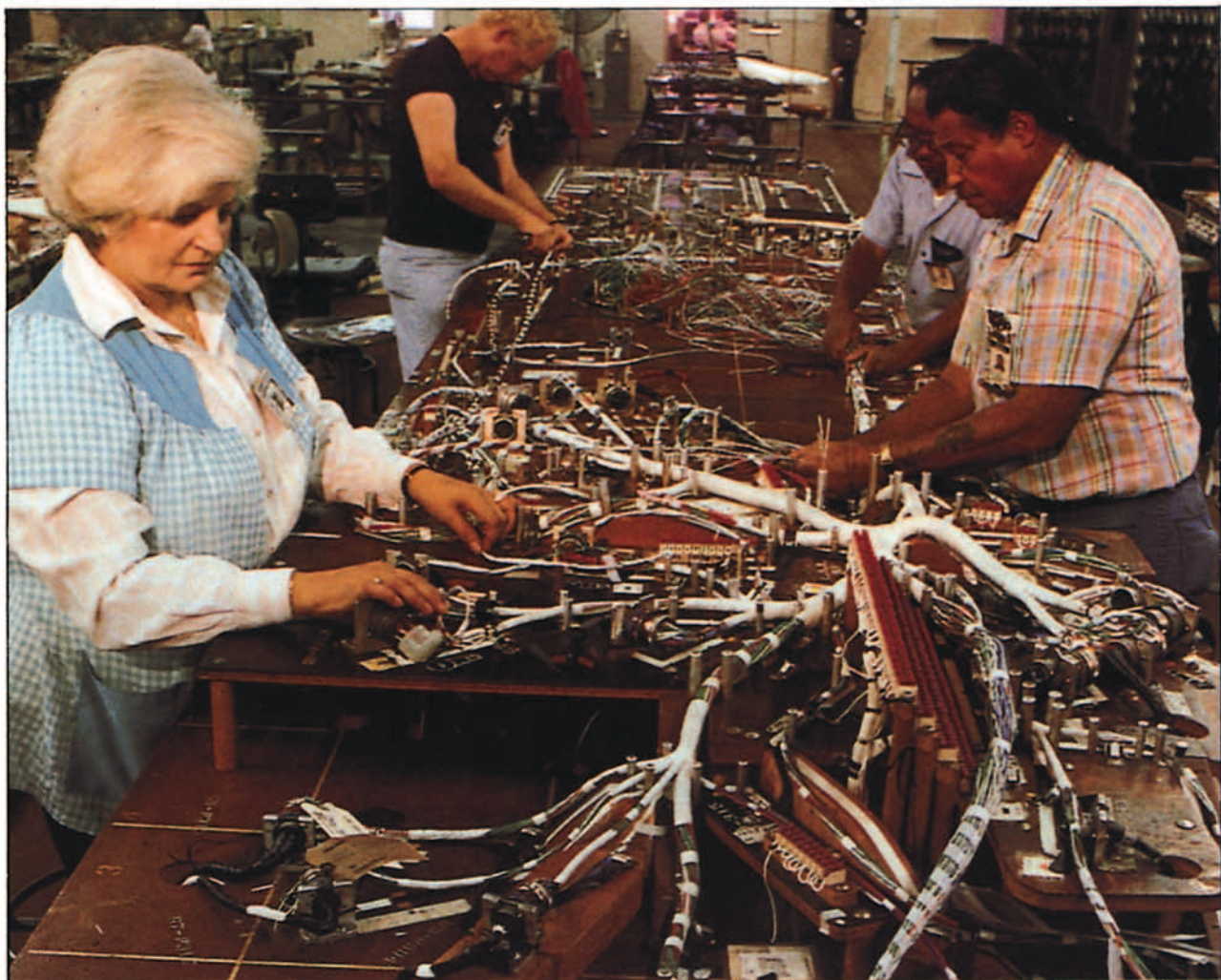
La reconstrucción completa de cableado es operación frecuente durante el mantenimiento en tercer escalón.

mada que le han sido encomendados donde quiera del mundo que hayan sido destinados o destacados. El Laboratorio de Patrones Primarios de la Armada mantiene y disemina las más exactas unidades de medida del programa de metrología y calibración de la Armada (Metcal). Proporcionan además apoyo de ingeniería metrológica y entrenamiento de personal a otros laboratorios subordinados.