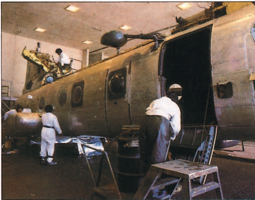
La eliminación de la pintura (decapado) es operación previa a la inspección.

El negociado de Ingeniería (NAVAIR Engineering Support Office), conocido como NESO, proporciona servicios de ingeniería pura a todas las actividades del Navdep y apoyo logístico de ingeniería a los aviones, motores y componentes de la Ar-