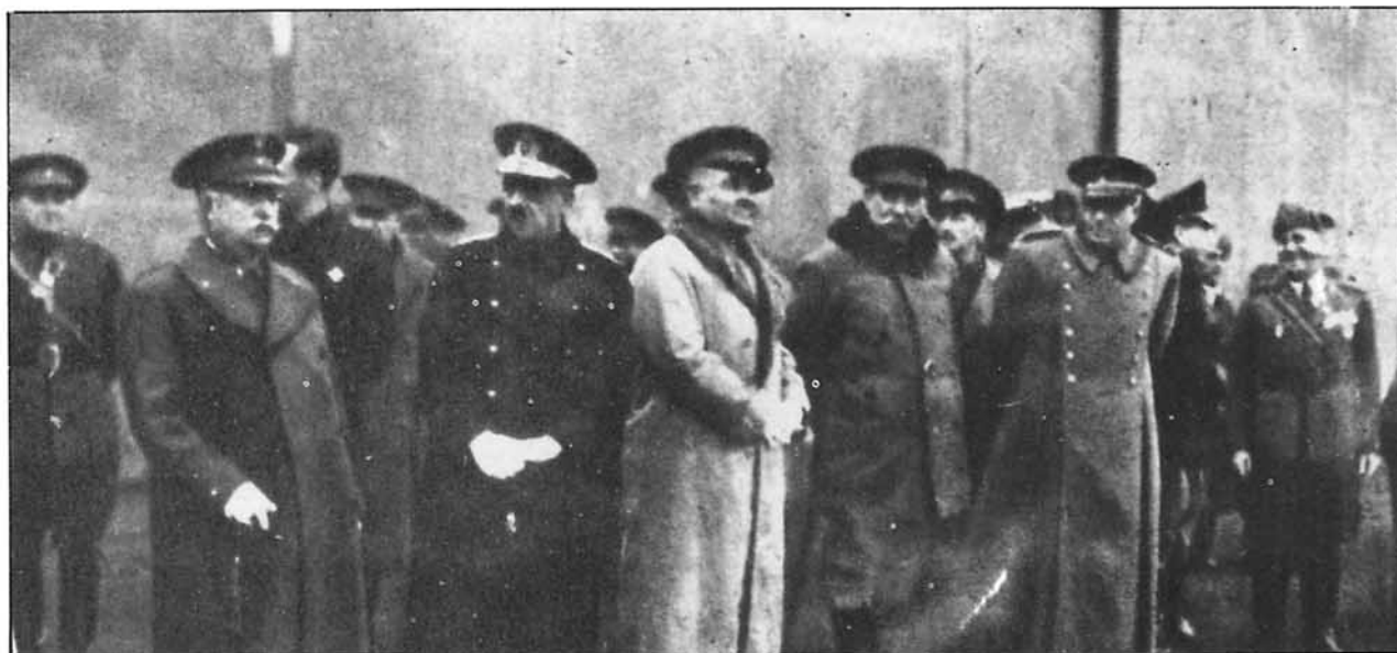
Autoridades que asistieron a la Misa y bendición de la imagen de Ntra. Sra. de Loreto en la Base Aérea de Getafe.

Con motivo de la festividad del día de Loreto, tuvo lugar en el aeródromo de Sania Raimel (Tetuán), de la Zona Aérea de Marruecos, una misa de campaña con asistencia del Alto Comisario. En Melilla la celebración fue en la iglesia del