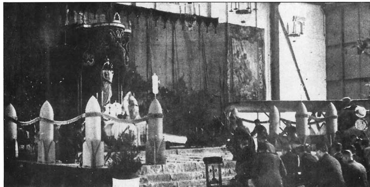
La imagen de Ntra. Sra. de Loreto, ya en el altar, preside la Misa en la B.A. de Getafe el día de su festividad el 10 de diciembre de 1936.