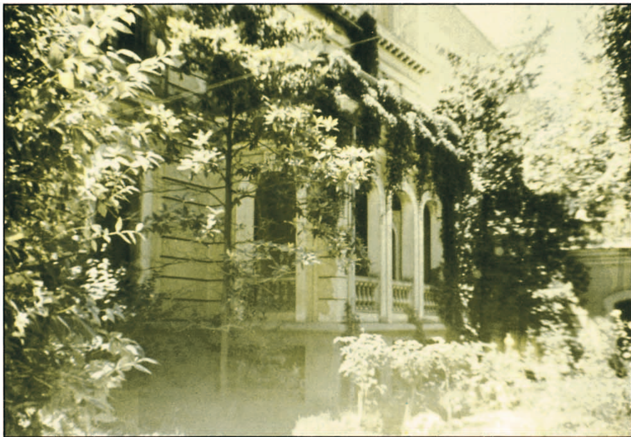
Clinica de la calle del General Oraá. Madrid.