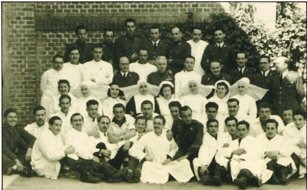
Personal de la Clínica de la calle del General Oraá. 1943.

La Jefatura radicaba en el Aeródromo de Cuatro Vientos, siendo desempeñada por el Comandante Médico Puig Quero, de la que dependían Capitanes Médicos destinados en los Aeródromos de Cuatro Vientos, Getafe, Alcalá-Guadalajara, Barcelona, Sevilla, León, Logroño, Los Alcázares, y en Africa los de Tetuán, Larache, Atalayón y Nador.