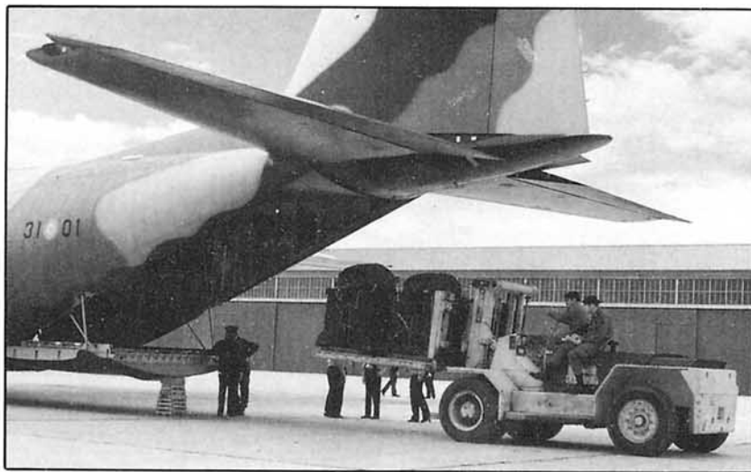
En OCTOPUS 88 se encontraron en las bases aéreas de partida el grueso de las fuerzas Aerotransportables, al tiempo que se activaron los órganos y elementos del Sistema Operativo Aerotáctico.

como Ambientación del Ejercicio, que justifica cómo, cuándo, dónde y para qué se emplean los medios; ambientación que debe reflejar de la manera más escrupulosa y realista factible lo que puede acontecer en cuanto a esfuerzo, forma de operar y uso continuado del Transporte Aéreo.