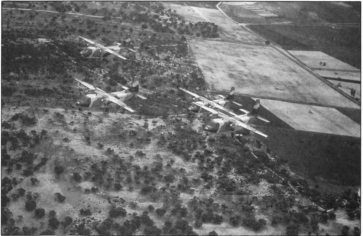
Dentro de los cometidos asignados, los T-12 tenían, junto a los T-9, la misión de efectuar tomas de asalto en campos no preparados para evacuar ficticios heridos y prisioneros.

— Complimentación simultánea de todas las acciones rutinarias encomendadas al MATRA fuera del Ejercicio.