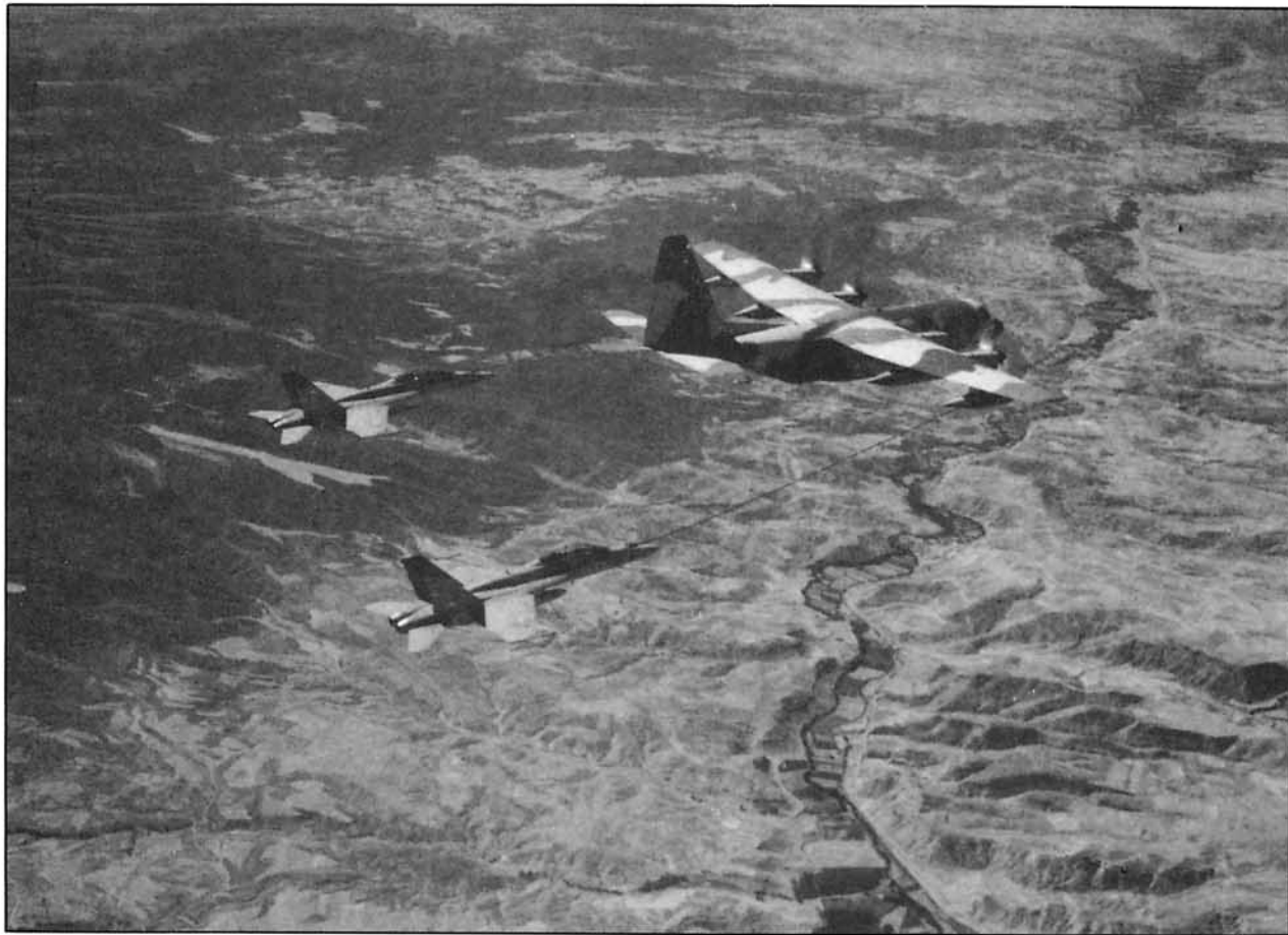
Un factor esencial que resultó determinante para mantener constantemente abierto el paraguas protector desplegado por el sistema EF-18 para cubrir las formaciones de transporte, fue la actuación de los TK-10 nodriza.

— Tercera Etapa: Repliegue del dispositivo y fuerzas actuantes