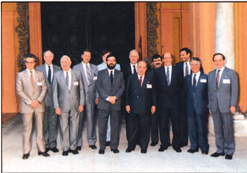
Los trece ministros de Defensa de los países de la OTAN en la última reunión del Grupo Europeo Independiente de Programas, en Sevilla.

ses: PAPS ("Programme Armaments Phased System") de la OTAN, si la cooperación resulta satisfactoria se avanzará creando Grupos de Proyectos, de Producción Dual o Grupos