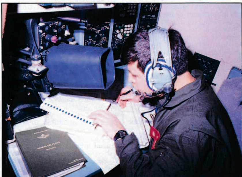
Intensa actividad del navegante durante la misión.

Es justo destacar aquí el inestimable apoyo prestado en cada uno de los países visitados por los respectivos Embajadores y personal de las Embajadas, particularmente en aquellas escalas en las que tuvimos que pernoctar; el conocimiento del país, sus costumbres y particularidades por parte de este personal, nos resultó de una importancia extraordinaria, sobre todo a la hora de los trámites aduaneros, el pago de las tasas aeroportuarias o del