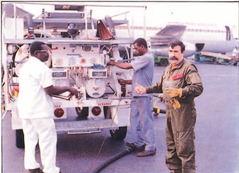
Haciendo un análisis del combustible que va a ser suministrado.

Ningún problema en todo el viaje. Todas las misiones se preparan concienzudamente en el Ala 31, no queda nada a la improvisación; en esta ocasión, el compacto equipo que forma una tripulación estudió todas las parcelas posibles en briefing previos: sobrevuelos, planes de vuelo, meteorología, cartas, fichas, pasaportes, visados, provisiones, medidas sanitarias, alojamientos... todo dispuesto desde antes de comenzar la misión. También se habían determinado con anterioridad