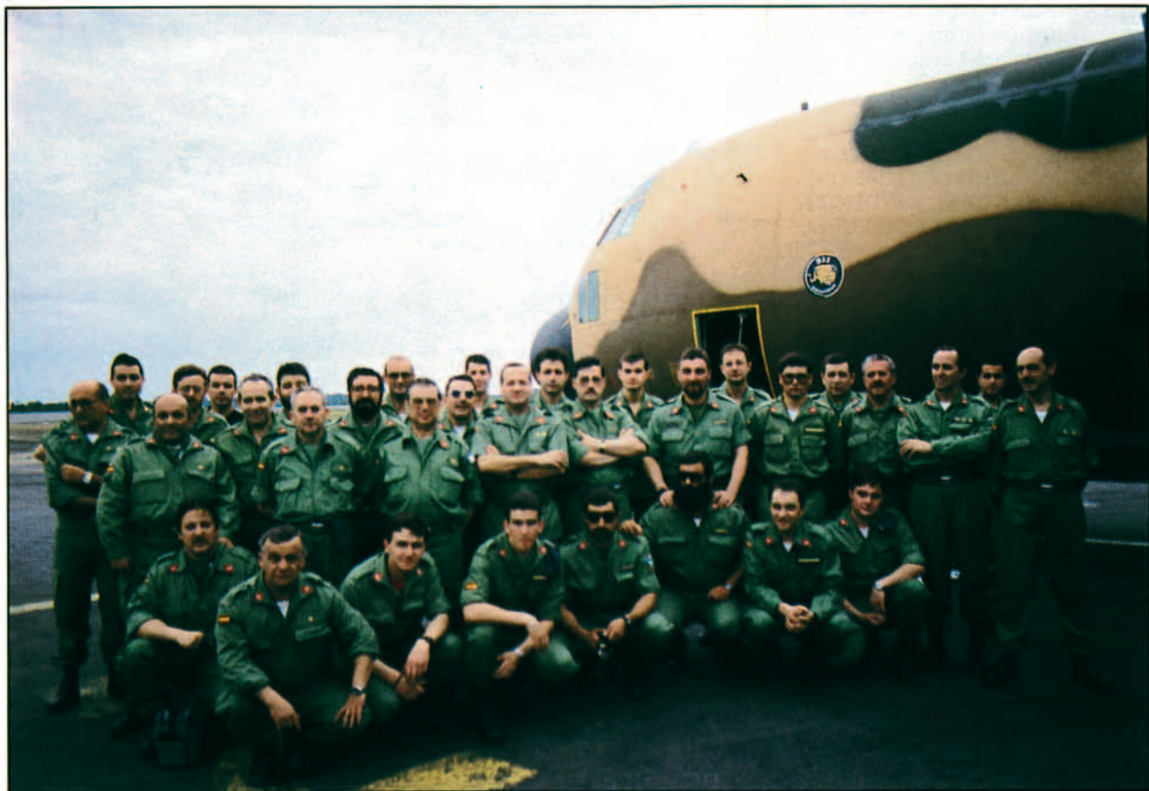
Primer contingente de Cascos Azules españoles.