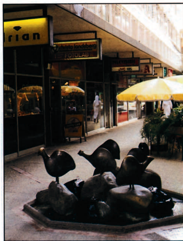
Una calle peatonal de la capital.