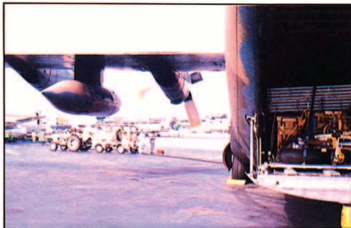
Repostando en Abidján.

Ya sin carga, los saltos a la vuelta pudieron ser de mayor duración; así hasta Abidján, en Costa de Marfil, alrededor de nueve horas de vuelo directo, y al día siguiente, hasta Gando otras siete horas. La desinfección reglamentada inmovilizó el avión durante 12 horas y la tripulación pudo descansar en Las Palmas; cuatro horas más correspondientes al último tramo nos situarían en nuestra casa, en la Base Aérea de Zaragoza. Una vez en el aparcamiento recibimos instrucciones de que nos dirijamos hacia el Escuadrón, donde en nuestra sala de briefing fuimos recibidos y saludados por el Teniente General