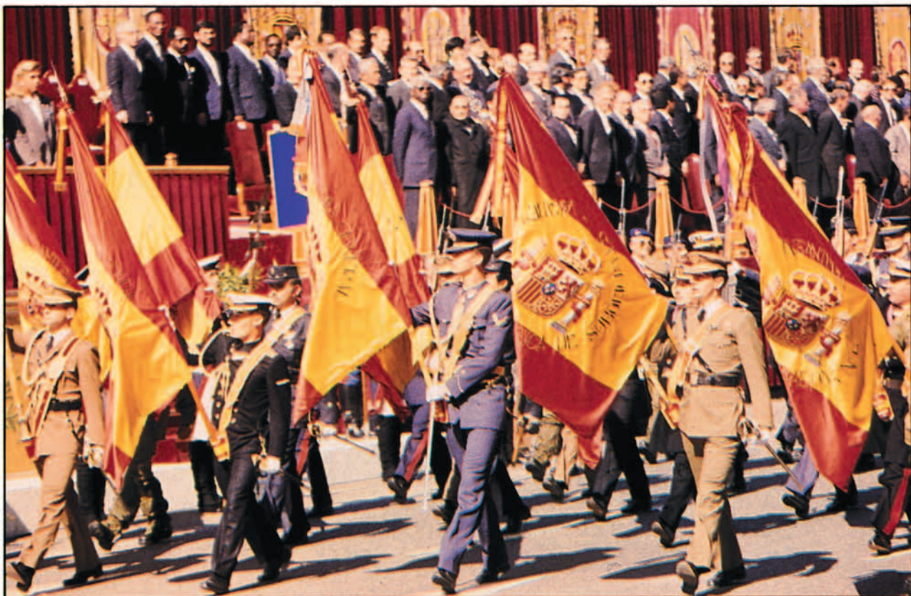
El Príncipe Don Felipe de Borbón, portador de la bandera de la Academia General del Aire, durante el desfile conmemorativo del día de la Fiesta Nacional.

Al frente de todas las unidades aéreas iba el Tte. Gral. Delgado Sánchez-Arjona, Jefe del MACOM y Capitán General de la Primera Región Aérea volando en un avión E-25 al que le acompañaba otro. Tras ellos pasaron 16 aviones C-15, F-18, la gran novedad de este desfile: 12 aviones C-12, Phantom: 9 C-11,