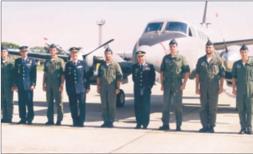
Los pilotos de la unidad que realizaron la pasada en homenaje a los caídos, fueron recibidos por el teniente general jefe del MACÉN, general jefe del MAPER y teniente coronel jefe del 42 Grupo, tras realizar el aterrizaje.

pericia en vuelo para la obtención del Título de Piloto Comercial, misiones de vigilancia en los Juegos Olímpicos de Barcelona 92, así como la participación en diversos ejercicios y eventos deportivos y aeronáuticos.