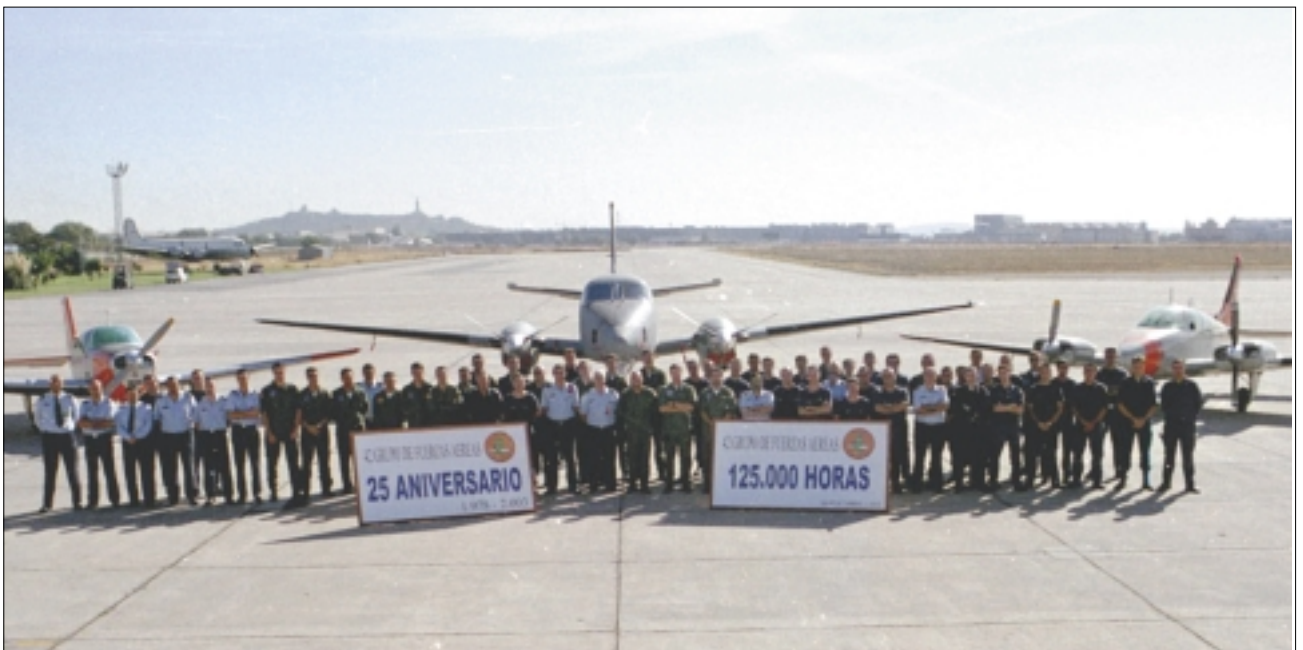
Foto de familia de todo el personal destinado en el 42 Grupo de Fuerzas Aéreas con motivo de la celebración de los 25 años de la Unidad y la realización de las 125.000 horas de vuelo.