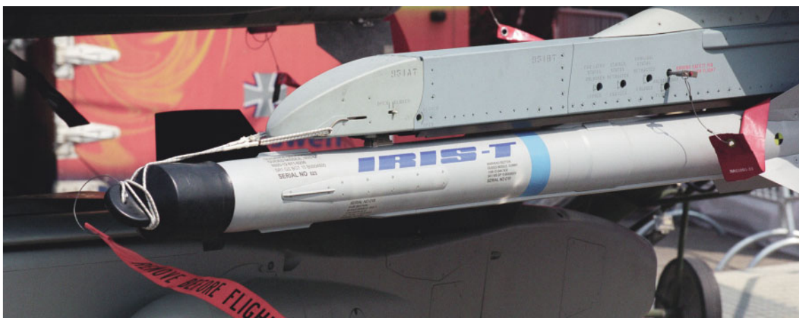
El EA incorporará próximamente el misil A/A IRIS-T

En 2004 se ha iniciado la incorporación de reservistas voluntarios en el Ejército del Aire, cubriéndose 132 de las 200 vacantes convocadas. De esta manera se completa el proceso iniciado tras la publicación de la Ley 17/99 en relación con la aportación suplementaria de recursos humanos a las Fuerzas Ar-