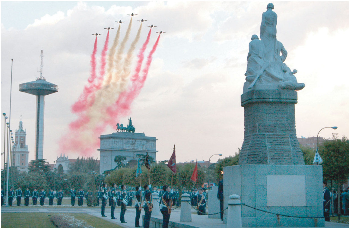
La PAPEA en la Lonja del Cuartel General del EA y La Patrulla "Águila" sobrevuela Madrid.

cuación) participaron entre el 24 y el 29 de noviembre en la primera edición de la Feria Internacional sobre la Salud (FISALUD), que tuvo lugar en el Parque Ferial Juan Carlos I y durante la cual han podido dar a conocer al ciudadano tanto las misiones que tienen asignadas como los equipos de los que están dotadas.