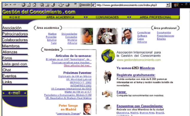
http://www.gestiondelconocimiento.com/ Asociación Internacional para la Gestión del Conocimiento. Un buen punto de inicio.

Se puede pensar que esto no es nada nuevo y que una vez más acumulamos a resaltar la importancia de la información y la sorpresa en el arte de la guerra, algo que los más antiguos tratados ya resaltan, de forma que si Sun Tsé nos dice "Conoce a tu enemigo y conócete a ti mismo, serás cien veces victorioso", Flavio Vegecio nos lo recordó, mil años después: "Es difícil vencer al que