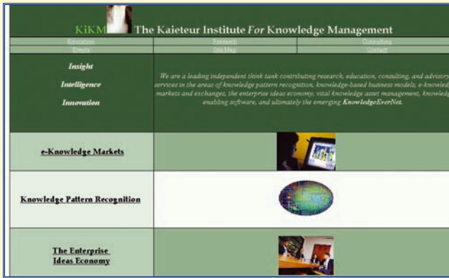
http://www.kikm.org/ The Kaiteur Institute For Knowledge Management