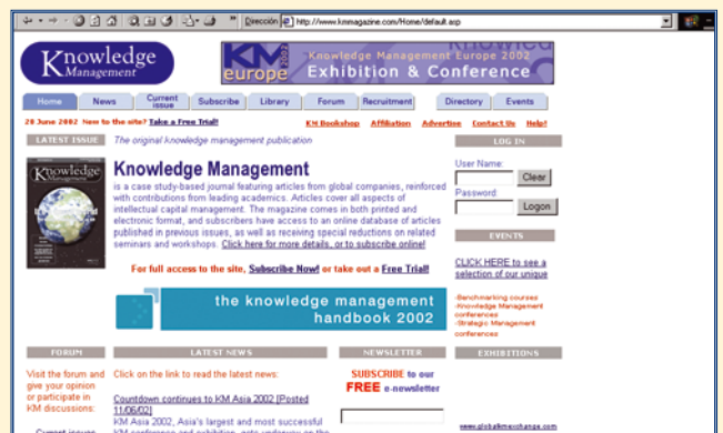
http://www.kmmagazine.com/ Knowledge Management. Prestigiosa publicación sobre Gestión del Conocimiento.