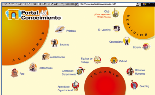
http://www.portaldelconocimiento.net/ Portal del Conocimiento Un recurso importante en múltiples áreas.