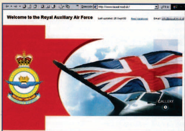
http://www.rauxaf.mod.uk/ Royal Auxiliary Air Force

do. No he conseguido averiguar si las habitaciones disponen de baño o ducha. Quizás sea algo obvio o quizás sea mucho suponer. Quien quiera averiguarlo deberá ponerse en contacto vía e-mail con el Club.