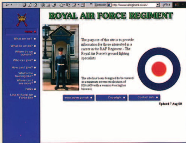
http://www.rafregiment.co.uk/default.htm Royal Air Force Regiment "Some of the best RAF fighters operate on the ground"