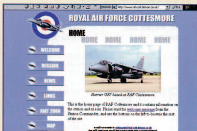
http://www.raf-cott.demon.co.uk/ RAF Cottesmore, es una base que alberga una unidad dotada de Harrier GR7