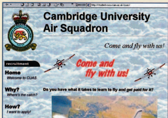
http://student.cusu.cam.ac.uk/cuas/ Cambridge University Air Squadron