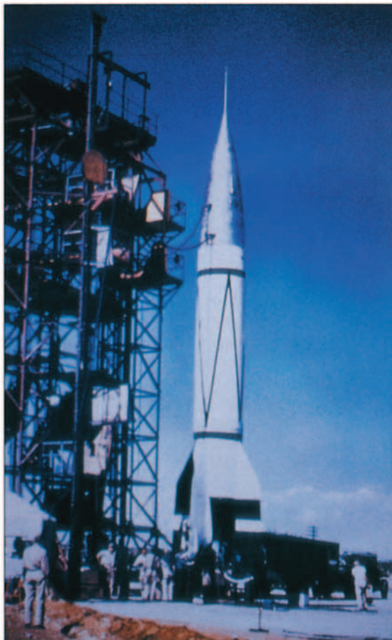
Un cohete V-2 capturado por el Ejército americano, durante unas pruebas en White Sands.

to, se recibían propuestas para el desarrollo de mayores y más poderosos misiles intercontinentales, como fue el caso del proyecto MX-774, éstas eran rechazadas de forma sistemática o sólo parcialmente estudiadas. Sin embargo, con el enrarecimiento de la actividad política mundial y la imparable escalada de armamen-