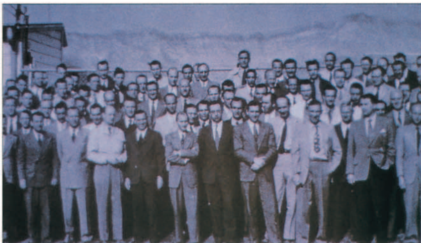
Integrantes alemanes del Proyecto Paperclip, trasladados a los Estados Unidos, con Von Braun al frente.

Los años 20 y 30 contemplarían gran número de estudios teóricos y el desarrollo de los primeros motores, tanto de