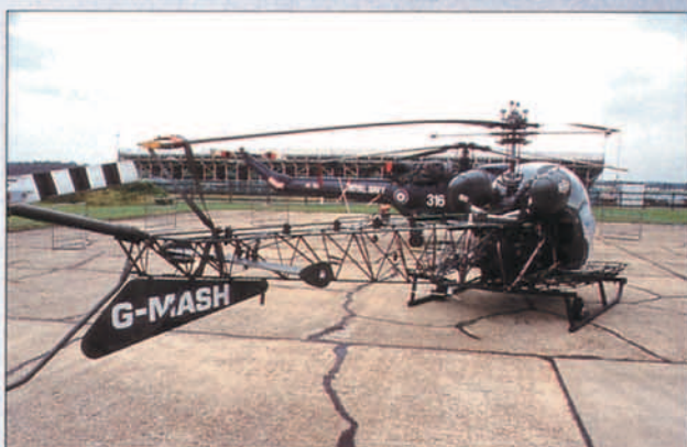
Tal y como puede apreciarse, este helicóptero fue el utilizado en el rodaje de la película MASH.