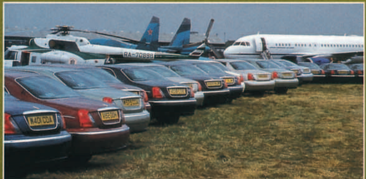
Los propietarios de Rover 75 disponían de un recinto exclusivo para aparcar en una situación privilegiada dentro del recinto.