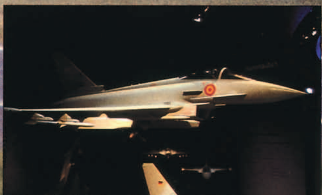
En el stand de EADS se mostraba esta maqueta que delata el que alguien ha asumido la dotación del EF-2000 español con misiles Taurus.