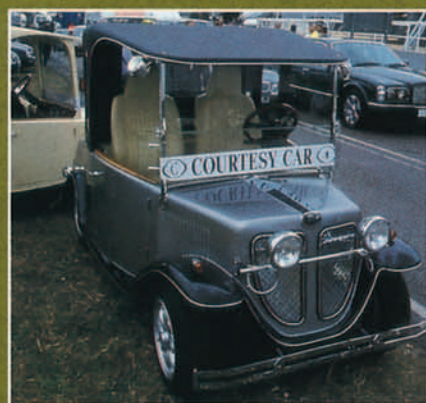
....aunque hubo excepciones muy originales