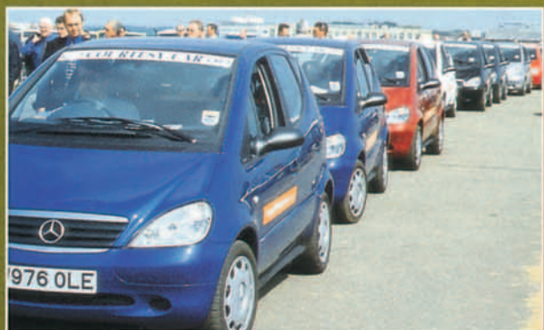
Sorprendía el observar que el vehículo utilizado como coche de cortesía por la organización del salón no era británico sino alemán.