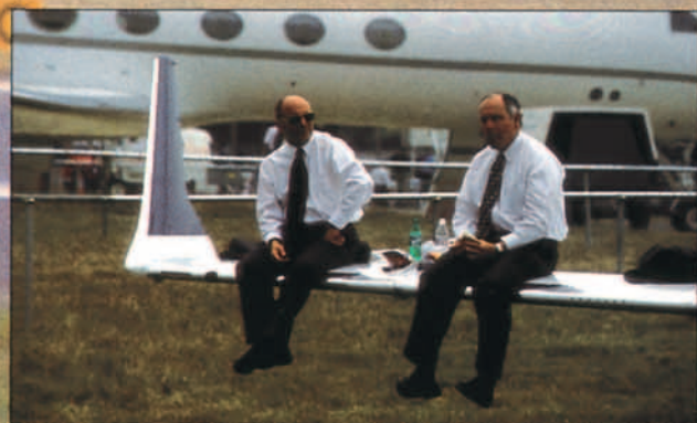
Cualquier lugar es bueno para reponer fuerzas, pero en el caso de un certamen aeronáutico el plano de un avión puede ser idóneo.