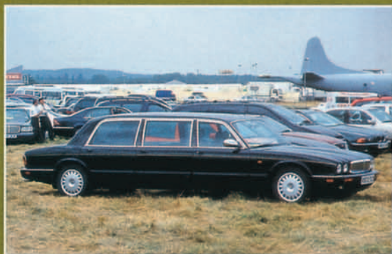
Extraño ejemplar de limousine de seis puertas basada en un Jaguar.