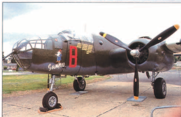
Una de las joyas más admiradas del área histórica de Farnborough fue este impecable B-25.