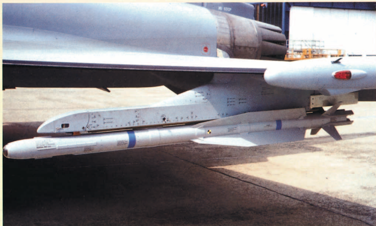
IRIS-T. Puede observarse la diferencia de tamaño de las aletas de control con las del ASRAAM.

atendiendo a distinta utilización operativa. En cualquier caso, cualquiera de los dos supera con creces todas las características del actual AIM-9L, sin embargo, merece la pena explicar brevemente la diferente visión que del combate cercano del futuro tienen los que apoyan un proyecto o el otro.