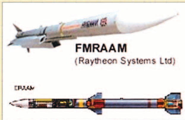
Familia de misiles de alcance medio de Raytheon.

Raytheon, junto con la empresa británica Shorts Missiles y las francesas Aérospatiale y Thomsom-Thorn proponen una gran mejora del AIM-120 denominado FMRAAM. Al igual que el Meteor, el requisito de alcance para el FMRAAM hace necesario la utilización de un tipo de motor denominado Ramjet. En particular, el motor a utilizar sería el de Aérospatiale de combustible líquido denominado RASCAL (Ramjet for Small CALibre). Es de suponer que se incluirán otras mejoras como la actualización del seeker , data link de dos vías, ECM