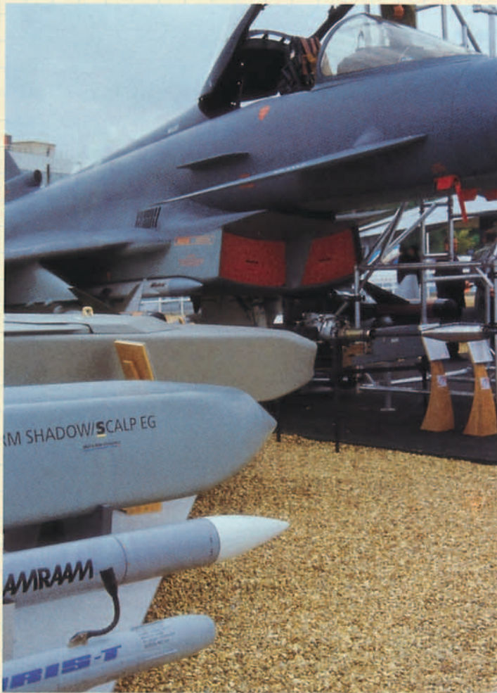
Despliegue de armamento del EF-2000 en Farborough.

La característica principal de este misil IR reside en su gran velocidad (3.5 M+). Esta capacidad le proporciona un alcance cinemático excepcional que, combinado con la sensibilidad del seeker , permite el disparo y desenganche del combate a distancias considerables 12 . Este