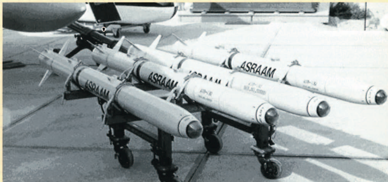
El pequeño tamaño de las superficies de control del ASRAAM favorece su alta velocidad.