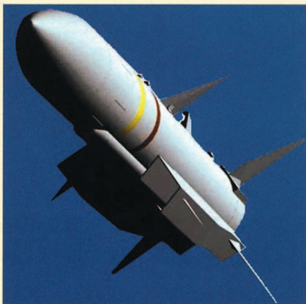
Veáse la tobera de admisión característica del motor Ramjet del Meteor.

En un futuro próximo, la columna vertebral de la defensa aérea española contará con dos sistemas de armas: C-15 y C-16 3 . En la actualidad, el misil aire/aire de alcance medio más capaz del Ejército del Aire es el AIM-7F SPARROW, estando prevista la llegada del AIM-7P y del AIM-120A a lo largo del año 2001. Para complementar estos misiles, el Ejército del Aire mantiene un programa denominado FAMRAAM con el que se pretende adquirir un nuevo misil avanzado de alcance medio. España ha apoyado la opción europea del Meteor cuyo desarrollo ha estado pendiente del gobierno británico, el cual no había expresado su decisión de apoyar al mismo hasta el pasado mes de mayo.