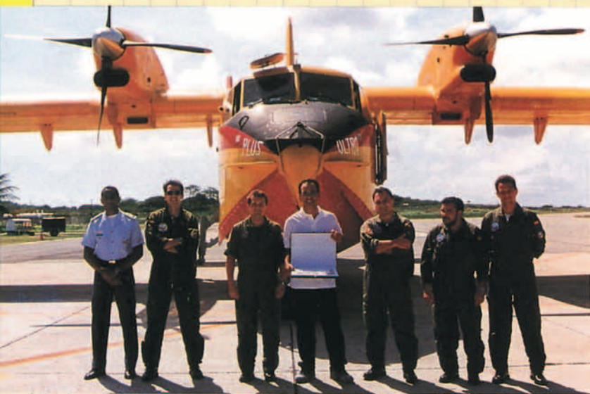
Entrega de Placa al Administrador de Fernando de Noronha.