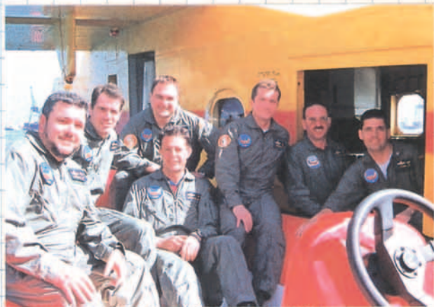
Excelente apoyo del Club Náutico de Las Palmas.

de viabilidad en el que se habían descrito las condiciones operativas y técnicas se dio luz verde a la realización de la misión. Pocos días antes de la Navidad del año 2000, se había puesto fecha a la llegada a Buenos Aires de un CANADAIER CL-215T del Ejército del Aire que, siguiendo la misma ruta que el Plus Ultra, un Dornier Wal, conmemoraría tal hazaña histórica y aeronáutica 75 años después del 10 de febrero de 1926.