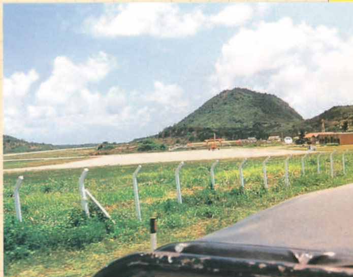
Aeropuerto de Fernando de Noronha (Brasil).

Iban saliendo miles de cifras que en las misiones de extinción al ser standard no se manejan con tanta precisión, pero todos los parámetros iban convergiendo eso sí, con cálculos exhaustivos hacia el vector final. ¿Sería posible finalmente el salto del Atlántico Sur? El informe reflejaba las condiciones necesarias para que dentro de los límites de seguri-