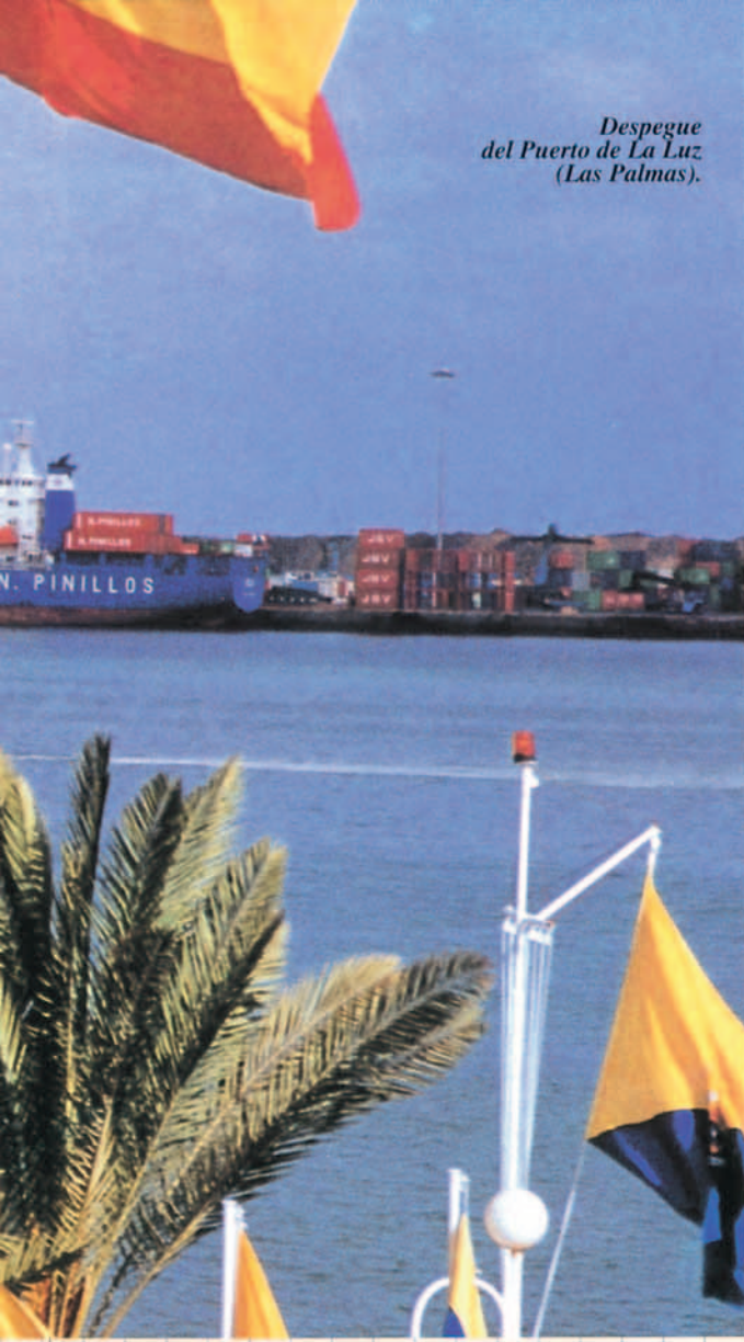
Despegue del Puerto de La Luz (Las Palmas).