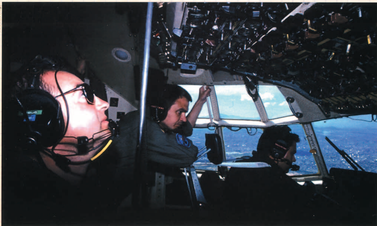
Los ojos de nuestros compañeros del Hércules nos guiaron todo el viaje.

tura, y posiciones de ruta que nuestros queridos compañeros de viaje, como cariñosamente acabamos llamando "Ultra Plus", un Hércules C-130 del Ala 31, iban supervisando y fundamentalmente apoyando la navegación y comunicaciones de nuestro corto enlace de comunicaciones HF, fueron nuestros ojos al penetrar el gigantesco frente intertropical, guiándonos sabiamente con su radar para atravesar en la ida y el regreso la inmensa masa nubosa del ITCZ, colándonos entre cumulonimbos que alcanzaban los 41000 pies en su desarrollo vertical y separándonos de los núcleos de mayor actividad que se embebían en la masa nubosa.