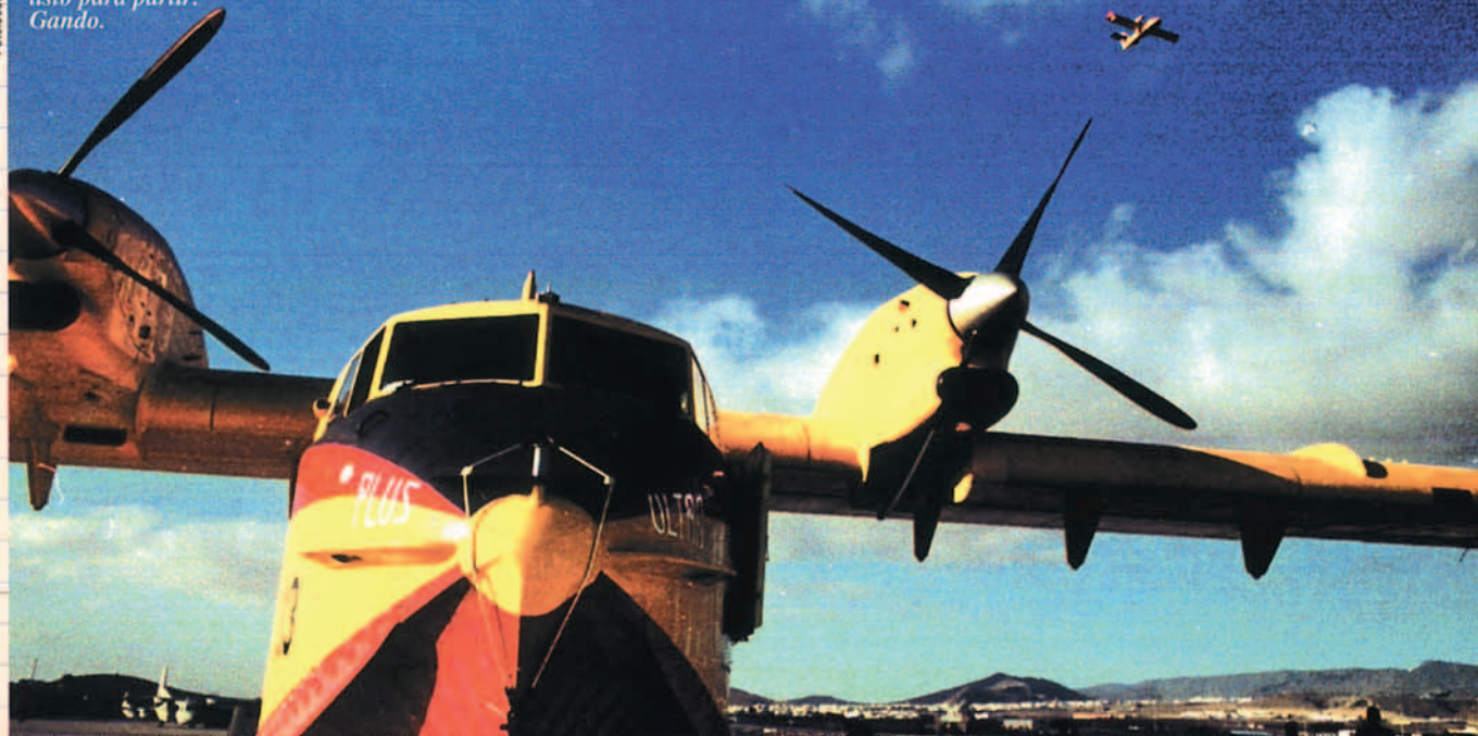
Nuevo Plus Ultra listo para partir. Gando.