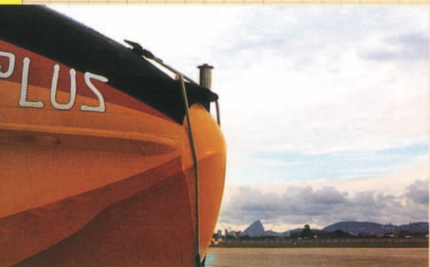
El Plus Ultra II admira Rio de Janeiro.

bilidad política en la zona africana, se decidió regresar a España deshaciendo el camino volado.