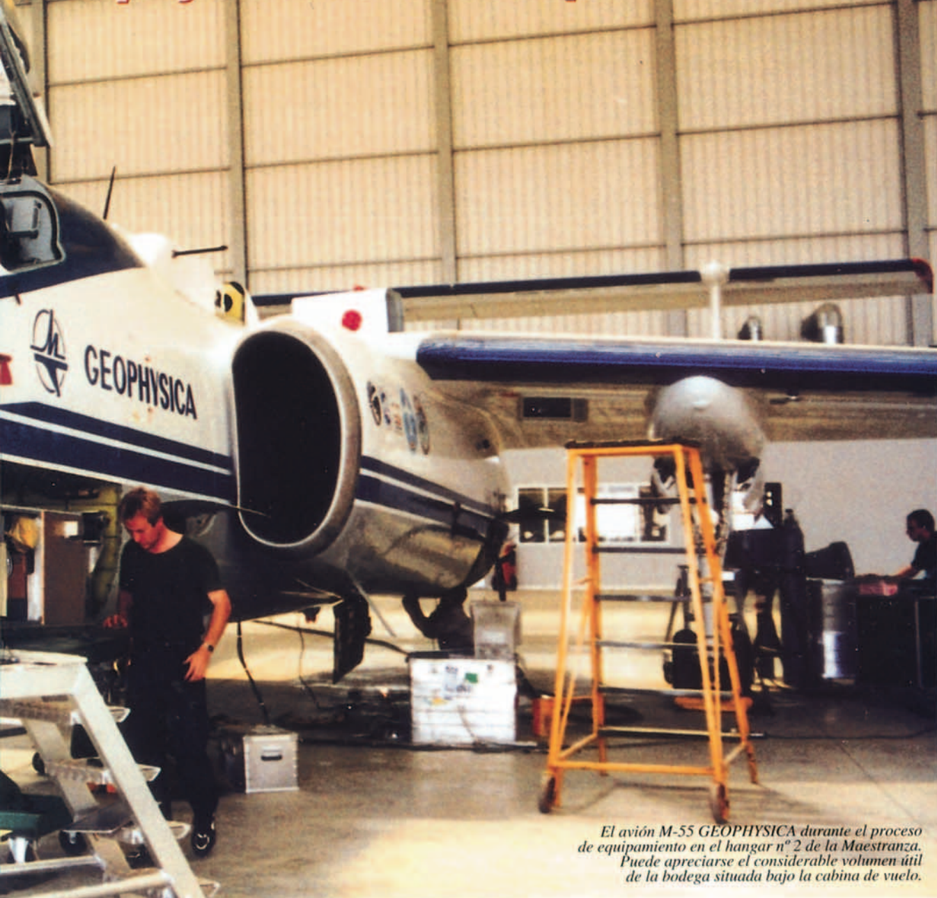
El avión M-55 GEOPHYSICA durante el proceso de equipamiento en el hangar nº 2 de la Maestranza. Puede apreciarse el considerable volumen útil de la bodega situada bajo la cabina de vuelo.

te, el Programa contempla otros aspectos como la formación de nubes polares estratosféricas de origen orográfico y el transporte ó desplazamiento del aire polar hacia latitudes medias.