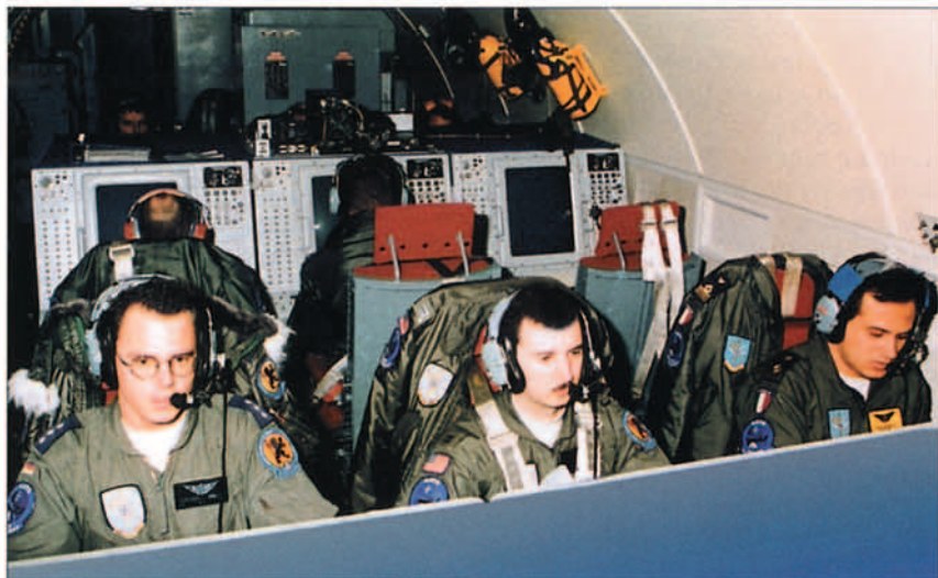
Tripulación multinacional de un E-3A

La operación Allied Force en Kosovo ha marcado una línea divisoria entre el antes y el después, no sólo para la OTAN, sino también para el mundo entero. Esta operación ha significado un hito importante y sus resultados tendrán efecto a largo plazo en el curso futuro de la Historia. Si la OTAN continúa con el buen hacer demostrado hasta el momento, todos reconocerán que no es un "tigre de papel" y su fuerza política continuará ganando en credibilidad, respaldada por una fuerte y competente capacidad militar, que pueda ser usada con efectividad cuando nuestros responsables políticos lo requieran.