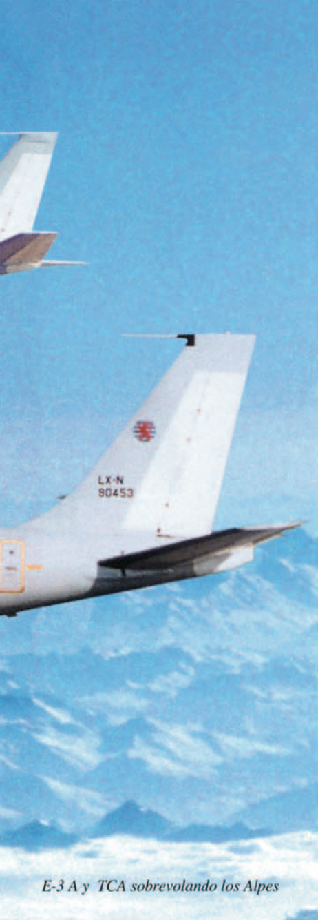
E-3 A y TCA sobrevolando los Alpes

fuerzas estaban integradas y coordinadas por medio de estructuras comunes de mando, permanecían, como ocurre actualmente, esencialmente separadas como unidades nacionales asignables a la OTAN.