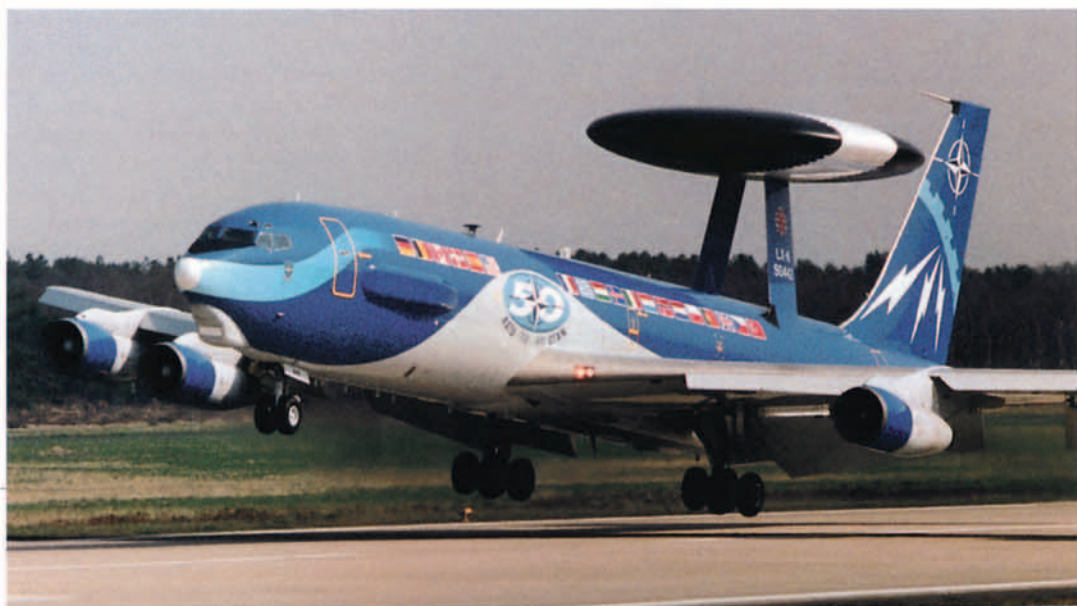
E-3 A pintado para conmemorar el cincuentenario de la OTAN

La Base Operativa Principal (MOB) del Componente E-3A de la Fuerza es la Base Aérea de la OTAN de Geilenkirchen en la República Federal de Alemania.