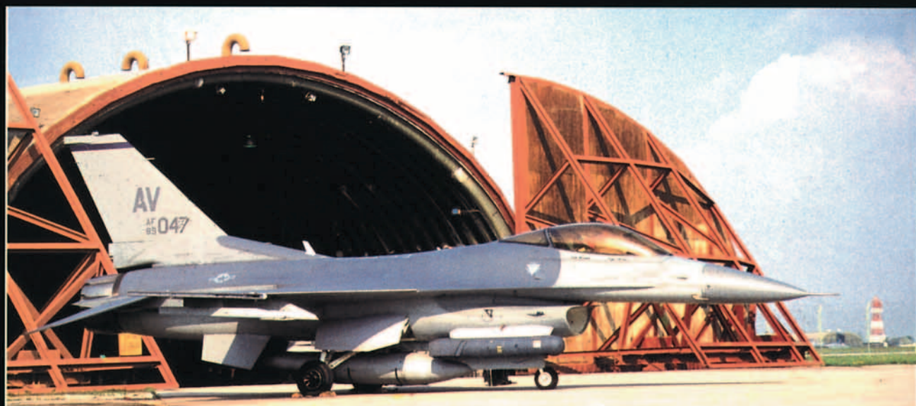
Avión F-16 americano en Aviano.