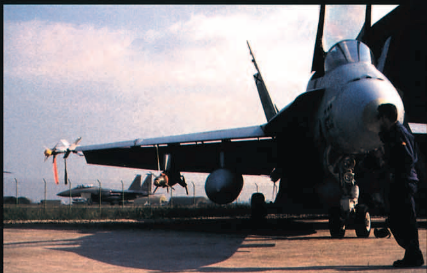
F-18 español en Aviano listo para el lanzamiento. Al fondo, un F-15E rodando.

5º) Repliegue de los aviones de apoyo a sus bases.