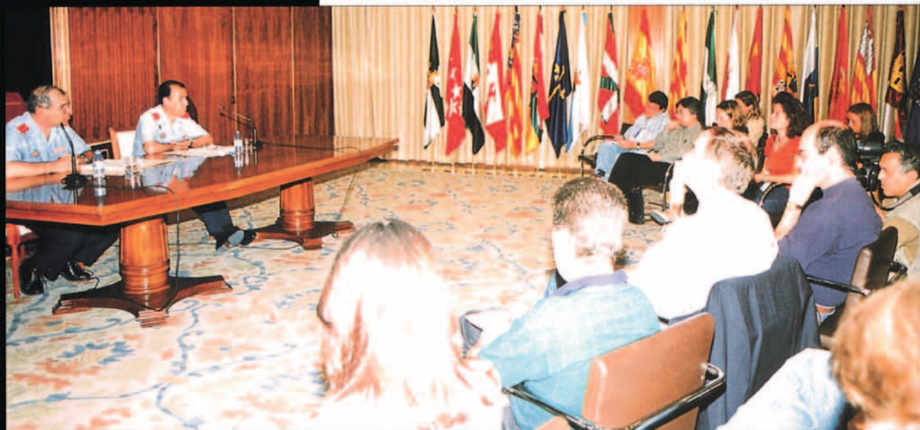
Los generales Rubió Villamayor y Álvarez López durante la rueda de prensa a los medios informativos.