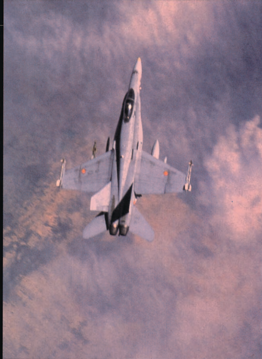
F-18 español patrullando sobre los Balcanes.

más cercana a la frontera y a la Base Aérea de Pristina en la RFY, donde estaban desplegados interceptadores y defensas SAM.