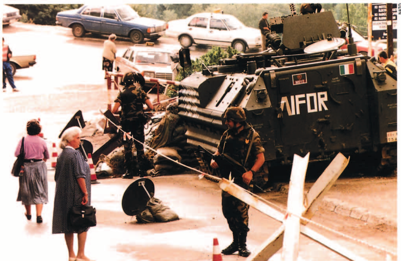
Las nuevas misiones de gestión de crisis y mantenimiento de la paz implican para las fuerzas aliadas un contacto con el elemento civil para el cual deben estar preparadas de antemano. En la fotografía, un punto de control establecido por las fuerzas italianas en las inmediaciones de Sarajevo durante el año 1996.

En cuanto a las Tareas Fundamentales de la Alianza, el documento identifica cuatro o cinco dependiendo de cómo se quiera interpretar el texto. En cualquier caso, las tres primeras se mantienen básicamente iguales a las ya existentes en el Concepto Estratégico de 1991. Esto es de una lógica cartesiana en una organización de defensa basada en el Tratado de Washington, con el fin primordial de la defensa colectiva y de establecer una relación especial de amistad y colaboración entre América del Norte y Europa. En lo que sí se diferencia el nuevo Concepto del anterior es en que desaparece entre las tareas fundamentales la de "preservar el balance estratégico en Europa". La nueva situación en nuestro continente creada tras la desaparición de la Unión Soviética hace innecesario identificar este objetivo. En cambio alcanzan ahora categoría de tareas fundamentales la de gestión de crisis y la asociación, la cooperación y el diálogo con otros países del área euro-