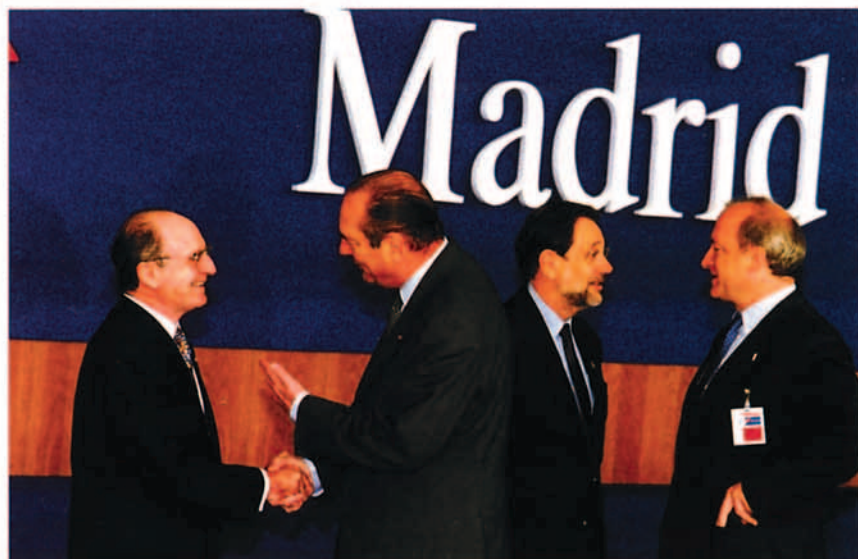
Durante la Cumbre de Madrid, celebrada en los días 8 y 9 de julio, se tomaron decisiones de especial relevancia en el futuro de la seguridad europea.