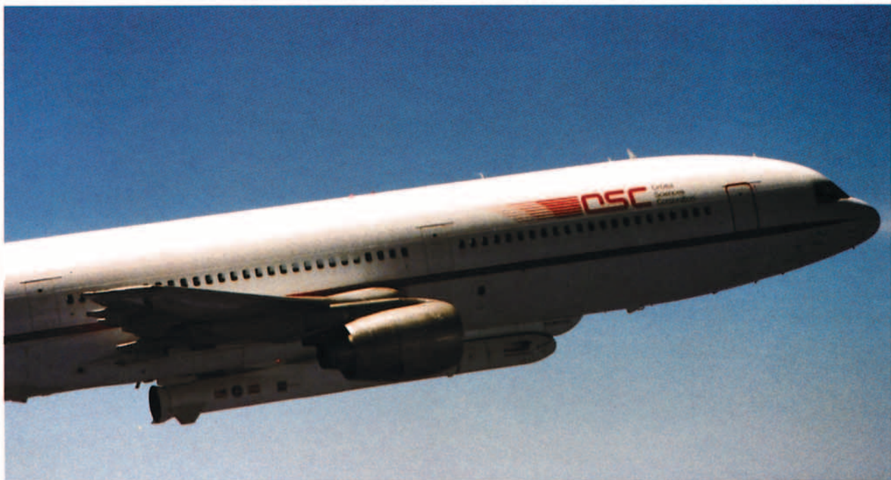
La puesta en órbita del Minisat 01, satélite de diseño y fabricación totalmente españoles, ha supuesto un verdadero hito en el desarrollo tecnológico de nuestro país.

los pueblos azotados por la guerra. Entre ellas cabe destacar las realizadas en Guatemala, la antigua Yugoslavia, Eslavonia Oriental, Moldavia, Chechenia y Nagorno Karabaj.