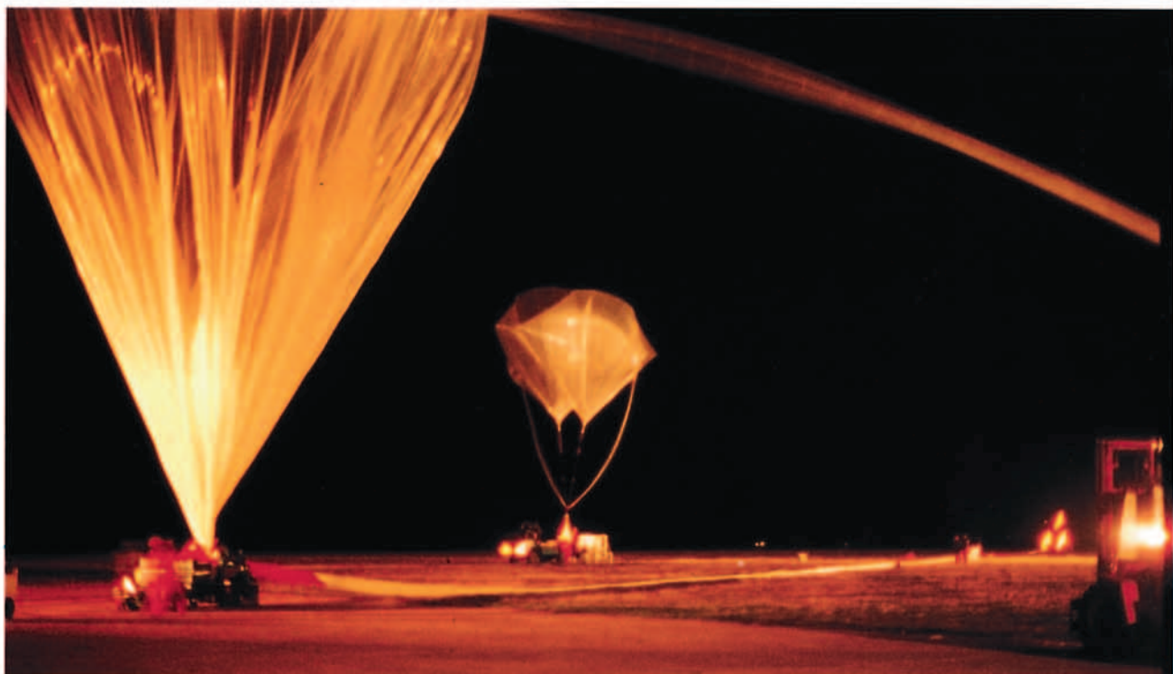
El INTA, a través de su laboratorio de Atmósfera, participa activamente en los estudios sobre la destrucción de ozono en nuestro planeta.

un auténtico hito en el desarrollo tecnológico de nuestro país al poner en órbita, el 21 de abril, el MINISAT 01, primer satélite de diseño y fabricación totalmente españoles.