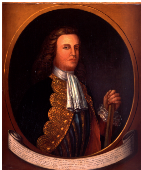
El teniente general Blas de Lezo. Óleo sobre lienzo (94x79 cm), Museo Naval de la Armada en Madrid (núm. inv. 431).

El almirante español, a bordo de su buque insignia, Galicia , de 70 cañones, ordenó a los únicos seis navíos de guerra que habían quedado en Cartagena —buques de 60 y 80 piezas, algunos incluso de menos— que se posicionasen en las entradas de Bocachica y Bocagrande y en el canal de entrada a Getsemaní, para repeler los primeros intentos de desembarco. Estos navíos eran el San Carlos y San Felipe , de 80 piezas, y el África , el Dragón y el Conquistador , de 70 cañones cada uno (33). Blas de Lezo ordenó abrir fuego contra los primeros barcos ingleses de desembarco, para impedir que su infantería sitiase el fuerte del Boquerón y, sobre todo, el de San Felipe. Los primeros ataques en pos de las costas cercanas a Cartagena, llevados a cabo por virginianos, fueron rechazados pero, dada la desproporción de efectivos antes señalada, la fuerza atacante, en sucesivas oleadas, fue ocupando algunos puntos cercanos al Cerro de la Popa, desde el que resultaba fácil bombardear la ciudad.