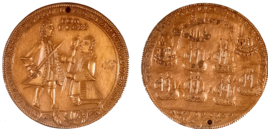
Anverso y reverso de la medalla conmemorativa de la victoria en Cartagena de Indias que, prematuramente, ordenó acuñar la metrópoli británica.

menor que el del enemigo, también había sido considerable. Ante la tenaz resistencia española, la intensidad de los ataques ingleses fue remitiendo, hasta quedar reducidos a algunos disparos esporádicos de cañón. La fuerza asaltante había perdido hombres y navíos en una proporción mucho mayor de lo que había previsto Vernon, quien a bordo de su buque insignia, el HMS Princess Caroline , veía cómo la desmoralización cundía entre sus tropas. Para colmo, las altas temperaturas tropicales habían contaminado el agua a bordo, elemento indispensable para las tripulaciones, lo que causaba continuas bajas añadidas entre los soldados. Forzado por tal estado de cosas, comisionó a dos oficiales para que, con bandera blanca, se acercasen al San Felipe y solicitaran una entrevista con el almirante Lezu en demanda de agua potable, de la que había abundancia en Cartagena. El almirante español les prometió barricas de agua limpia, siempre y cuando la flota inglesa levase anclas. Los comisionados cargaron el precioso líquido en barcazas, y los maltrechos restos de la flota asaltante se perdieron en el horizonte rumbo a Jamaica, para reponer fuerzas y lamer sus heridas antes de regresar a Europa.