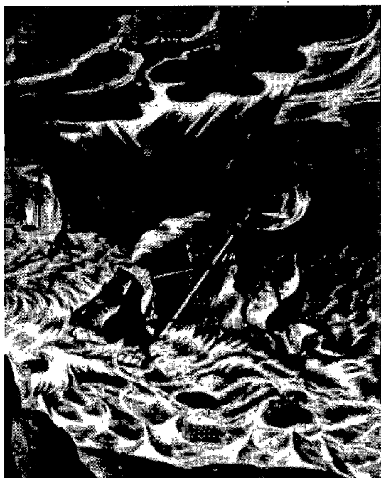
Detalle: D. Tempestad y naufragio a la vista de Chipre