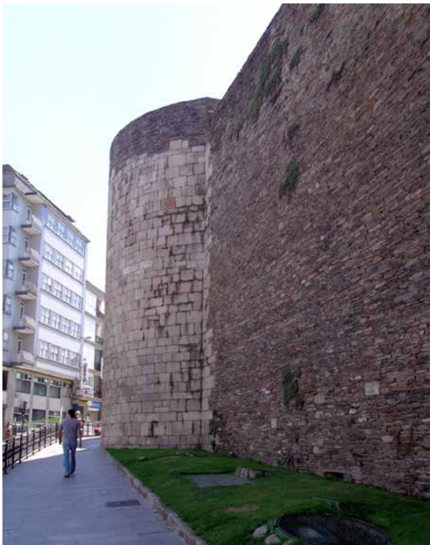
Muralla de Lugo, detalle

actuaciones hay que alabar el que se haya preservado de la destrucción unas tipologías arquitectónicas de carácter militar que tienen un significativo valor arquitectónico, además de histórico, y que se las haya integrado en el entramado urbano de la ciudad, no como un edificio de acceso restringido, sino como zona abierta a la población.