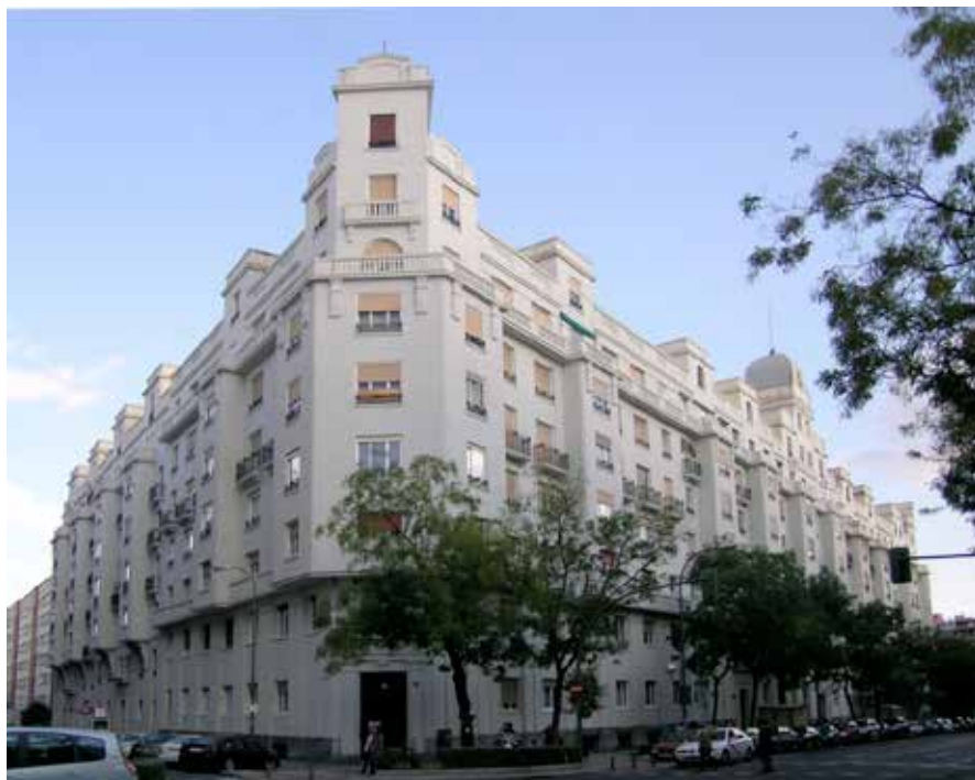
Casas militares, Santa Engracia, Madrid

En Barcelona, cabeza de la Cuarta Región Militar, hubo problemas por no disponer el Estado de terrenos que pudieran ser destinados para la construcción de las viviendas militares y resultar muy onerosa la compra de solares, con lo que en un primer momento no pudo acometerse la tarea.