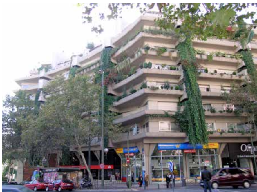
Casas militares, glorieta Ruiz Jiménez, Madrid