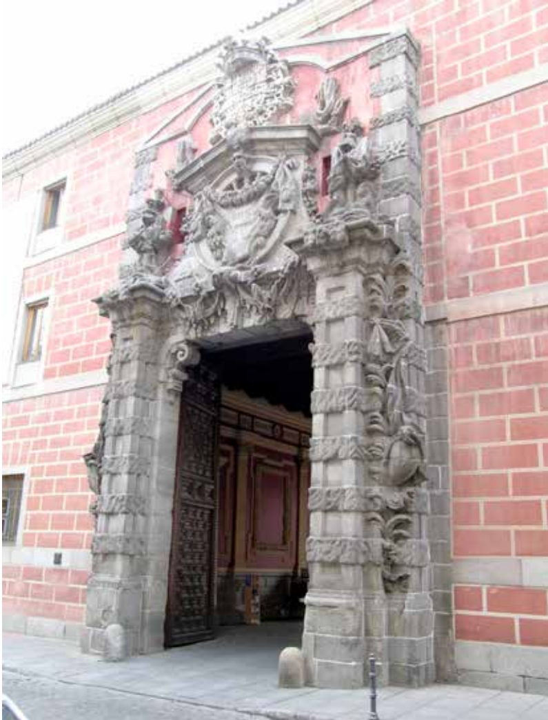
Cuartel de Guardias de Corps, Madrid

banizarse se le dio el nombre de paseo de los Ocho Hilos —actual calle de Toledo— por las ocho filas de árboles que se plantaron y que embellecieron la vía. Tomando este eje como bisectriz, dispuso otras dos vías, el paseo de Pontones hacia el suroeste y el paseo de los Olmos hacia el sureste, con lo que se diseñaba el tridente. Estas dos últimas vías desembocaban en sendas plazas —actuales plazas de Francisco Morano y de Ortega y Munilla—,