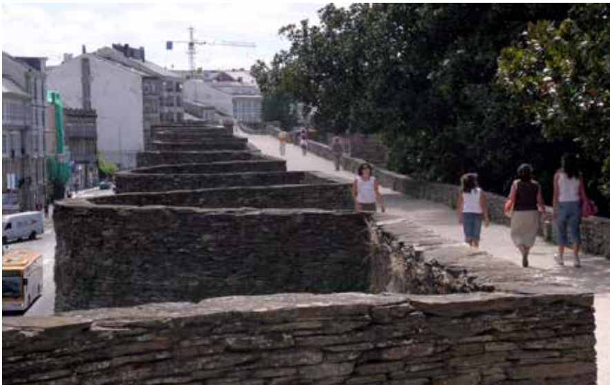
Muralla de Lugo

De todos es sabido cómo algunos campamentos acabaron dando lugar a poblaciones que pasaron de una estructura militar a otra civil perfectamente organizada y funcional 4 , lo que ha sido determinante en la estructura en damero del actual planteamiento urbano de los núcleos centrales de ciudades como Lugo, León, Astorga o Zaragoza, en las que por su condición de ser diseñadas por el ejército romano se hacen visibles los presupuestos racionalistas y prácticos que imponía la práctica militar.