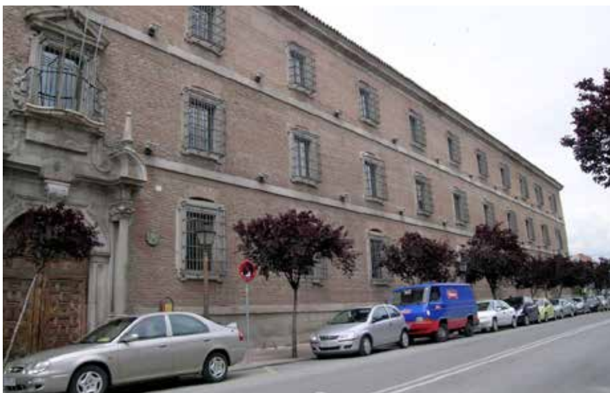
Alcalá de Henares, Colegio de los Jesuitas, antiguo cuartel Mendigorria

gente militar, hizo que la ciudad retornara a su anterior carácter universitario al fundar la Universidad de Alcalá y devolver a esta los antiguos edificios colegiales convertidos en cuarteles.