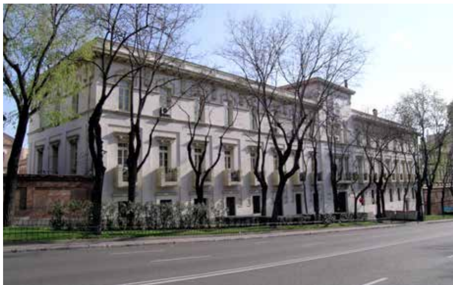
Cuartel del Infante Don Juan, Madrid

determinó que estos se hicieran en el interior de los presidios. Posteriormente, pero también en relación con él, se levantaron las viviendas construidas por el Patronato de Casas Militares que facilitaron la urbanización de la trasera del cuartel, y más recientemente, tras un proceso en que se proyectó su derribo para levantar en su solar el Centro Cultural de la Defensa, se han ubicado, ocupando los antiguos pabellones del acuartelamiento, algunas dependencias del Ministerio de Defensa, y sobre todo, el Instituto de Historia y Cultura Militar con los fondos del Archivo General Militar de Madrid y la Biblioteca General Militar, lo que implica un acierto de profundo sentido urbanístico dada su cercanía con la Ciudad Universitaria de Madrid.