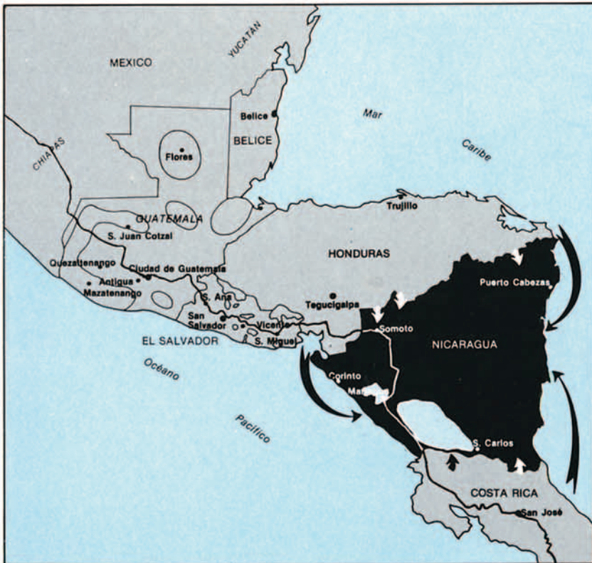
Dos enfrentamientos se encabalgan a veces, el ideológico entre el Este y el Oeste, y el económico entre el Norte y el Sur.

No sólo es que la riqueza así lograda sea mayor, sino que la búsqueda tradicional por medio de la conquista se habría vuelto totalmente prohibitiva para quien lo intentase, militar, económica, política y moralmente. Por un lado, el mundo actual no es mundo vacío sino bien armado y dada la eficacia de los modernos sistemas de armas, incluso un escaso puñado de hombres puede infligir un gran daño al atacante: en segundo lugar, dada la sofisticación de los medios militares actuales y sabiendo de la voracidad en material de los enfrentamientos modernos, cualquier batalla no puede resultar barata. Una ocupación o una lucha contra la guerrilla no pueden serlo menos; finalmente, el derecho internacional y la moral son elementos que deben entrar en consideración. La retirada de embajadores puede ser significativa, un embargo puede serlo todavía más. Un bloqueo u otras sanciones deben de producir un resultado negativo. Tampoco hay que olvidar que el mundo se halla dividido básicamente por dos conflictos que se encabalgan a veces: el ideológico entre el Este y el Oeste y el económico entre el Norte y el Sur. Una acción agresora puede ser condenada inmediatamente por uno de los bloques si no por todos, dependiendo de la posición relativa del agresor en el tablero de las tensiones mundiales. Si además consideramos otros binomios como Blanco-Color, Occidentalidad-Islamismo, etc., puede comprenderse la dificultad para un país con visos de conquista de no ser atrapado por una fácil condena.