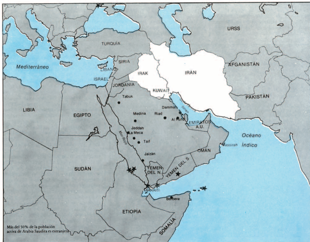
El mundo se halla dividido por varios conflictos, uno de ellos representado por el binomio blanco-color, occidentalidad-islamismo.

Por otro lado, la impresionante destructividad de los nuevos ingenios nucleares y su diseminación que ponían en peligro ya no sólo a las fuerzas del enemigo y a su población, sino a las gentes del mundo en general, conducía a pen-