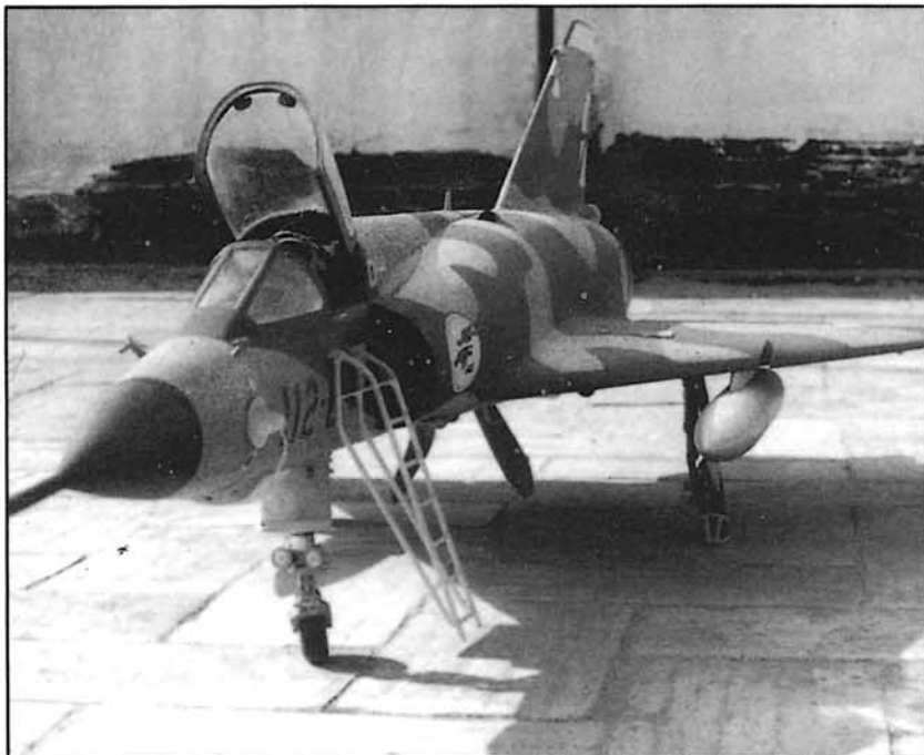
Aeromodelismo: entre la ficción y la pura realidad.

Facilitarle los medios materiales (locales, aparatos, etc.), de existencia habitual por otro lado, difundir adecuadamente la sesión, elegir el día y la hora precisa para no interferir el trabajo y para que la asistencia voluntaria se vea facilitada, es la labor a realizar. Al igual que las recogidas en el punto anterior, los programas que regulen estas actividades podrían realizarse anualmente, para que los cuatro reemplazos del año tuvieran al menos una vez en ese tiempo la oportunidad de recibir esa formación o información.