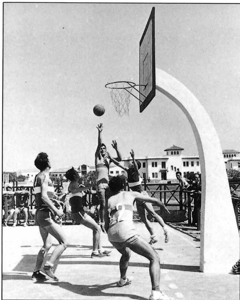
Los deportes de equipo fomentan el compañerismo.

Además de las citadas en este título, cualquier otra actividad puede tener cabida si algún profesional se interesa por el tema, o algún soldado que realiza el servicio militar es buen conocedor del mismo.