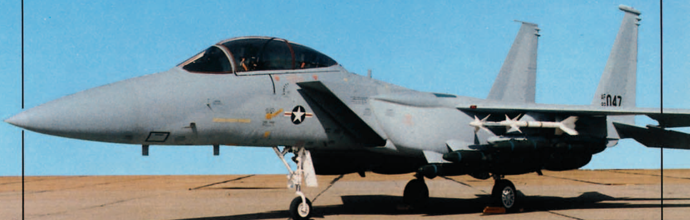
Tipica fotografía obtenida en Saint Louis, donde se nos muestra el biplaza F-15B, que intervino en los vuelos de evaluación. En este caso los Fast Pack llevan lanzadores de bombas.

El piloto dispone en la cabina delantera, de un HUD (Head Up Display) y dos pantallas TRC (Tubos Rayos Catódicos) para la presentación de las imágenes radáricas y FLIR (Forward-Looking Infra-Red). El puesto trasero del avión, que ocupa el navegante/operador del sistema de armas, dispone de dos pantallas en color de 12,7 cms de diámetro y situadas a uno y otro lado de otras dos pantallas de 15,25 cms dispuestas a su vez una junto a otra por encima del pupitre, a la altura de