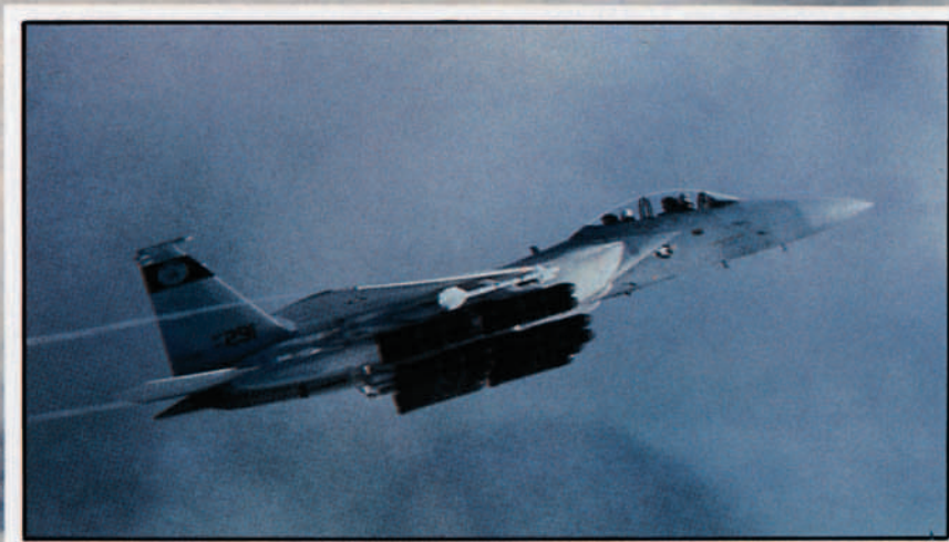
El F-15E dispone de una muy alta capacidad de carga militar, que puede llegar hasta las 11 toneladas.

condiciones meteorológicas adversas". A lo que añadimos nosotros: Más aún teniendo en cuenta el gran avance tecnológico de los sistemas de armas del Pacto de Varsovia, que les permitirá operar en muy breve espacio de tiempo, si no ya, sin importales las limitaciones climatológicas.