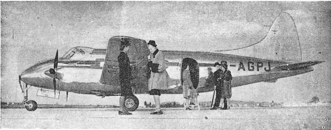
El Havilland "Dove", bimotor de pasajeros con tren de aterrizaje triciclo, que presta servicios en líneas aéreas británicas.

d) Adopción de medidas preventivas. El Consejo de Seguridad, para hacer efectivas sus decisiones, insta a los miembros de la O. N. U. para que adopten medidas que no impliquen el uso de la fuerza armada: interrupción de relaciones económicas, de las comunicaciones ferroviarias, marítimas, aéreas, postales, telegráficas,