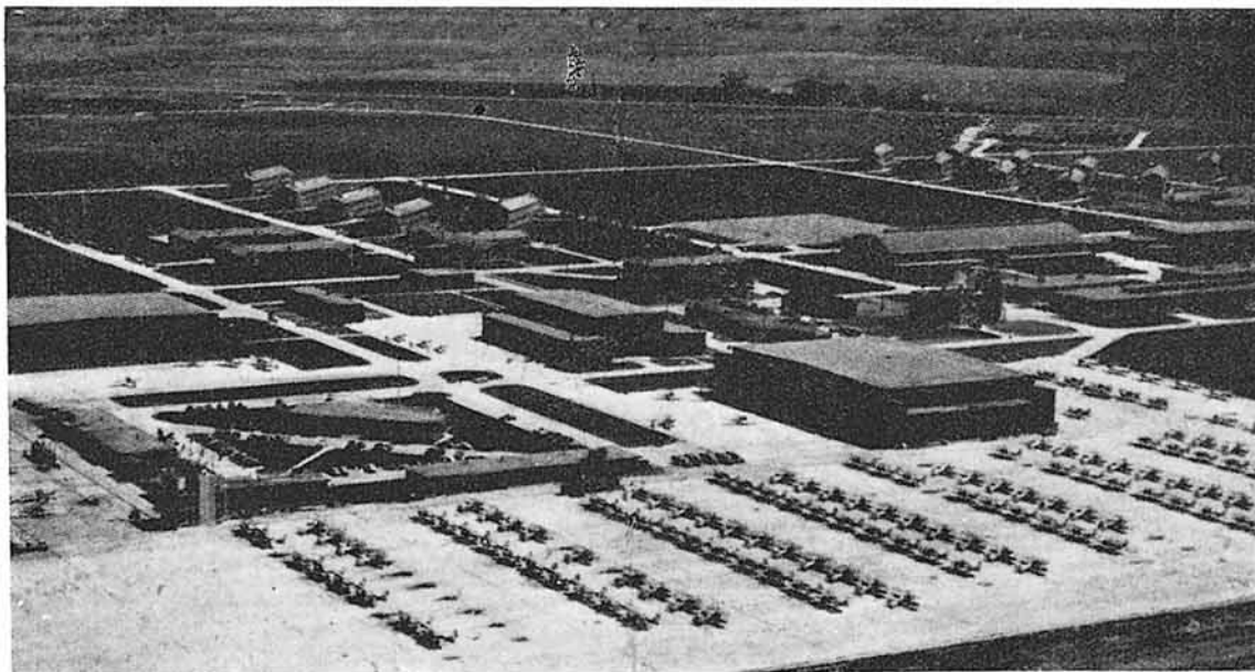
El aeropuerto de Ottumwa, Iowa, proyectado por valor de quince millones de dólares y ahora aeródromo-escuela para pilotos de la Aviación naval de los Estados Unidos. Ottumwa tiene, además, su aeropuerto municipal.

Indudablemente, antes de consagrar "el respeto universal a los derechos humanos y a las libertades fundamentales de todos, sin hacer distinción por motivos de raza, sexo, idioma o religión", como dice la Carta al tratar de las misiones que incumben al Consejo Económico y Social, deberá la O. N. U. cumplir con las promesas de la Carta del Atlántico, cuyo espíritu informa a la Organización al afirmar que pro-