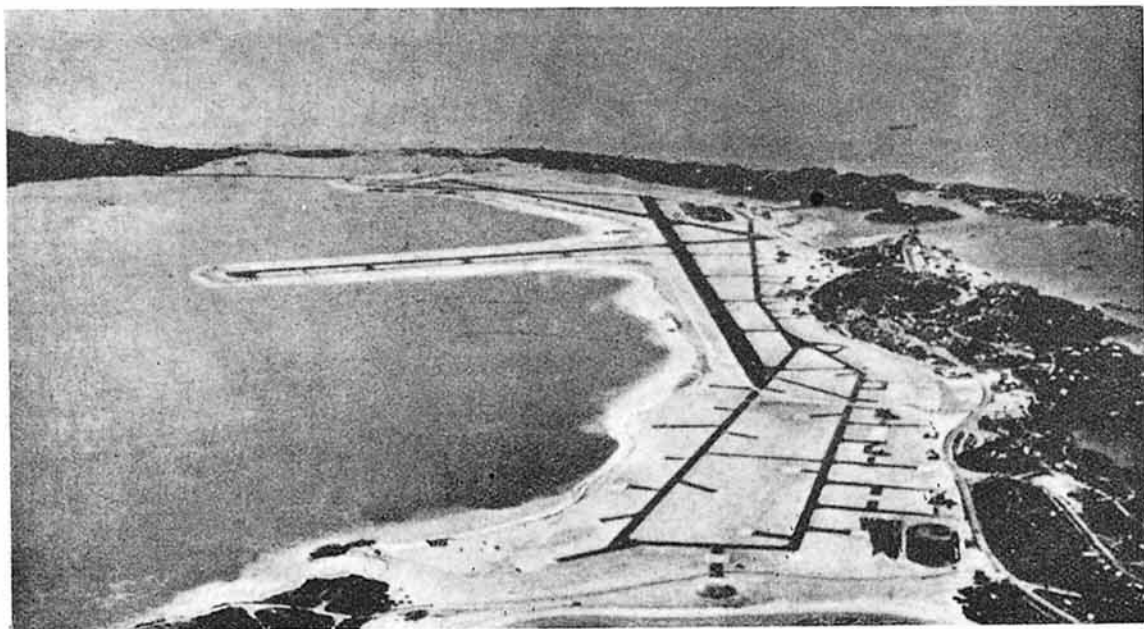
Aeropuerto americano en las Bermudas. Ejemplo de utilización de una estrecha península de arena como aeropuerto militar durante la guerra.

El otro de los acuerdos básicos de la Carta de San Francisco es, según hemos dicho, la Conferencia de Dumbarton Oaks. Precisamente aquí se planeó, a grandes rasgos, lo que debiera ser la llamada Organización de las Naciones Unidas, en la que—se dijo—pudieran tener voto todas las naciones amantes de la paz . Igualmente se acordó la creación de "una fuerza militar conjunta" para su empleo en evitación de toda