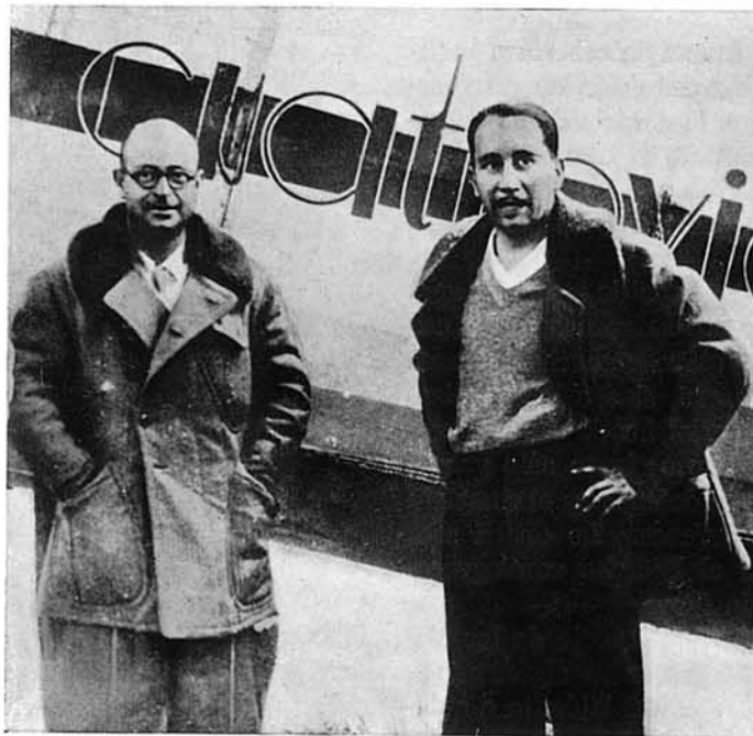
Los gloriosos aviadores Barberán y Collar, junto al avión Cuatro Vientos , momentos después de tomar tierra en Camagüey, tras haber realizado su maravilloso vuelo Sevilla-Cuba, de 7.600 kilómetros de distancia directa.

Héroes y mártires por el ideal de España, la gloria de Barberán y Collar no cesa de crecer a medida que el tiempo destaca más y más el mérito de su portentosa hazaña.