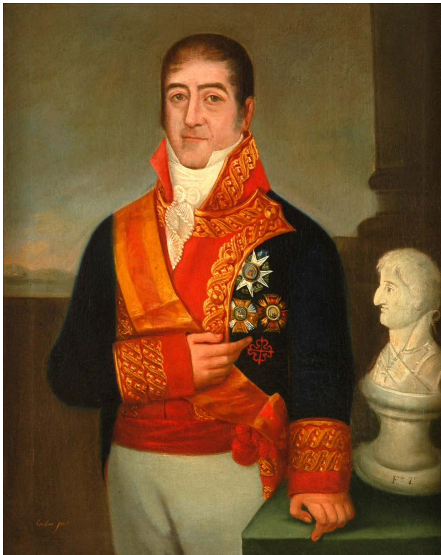
Retrato de Juan José Ruiz de Apodaca y Eliza (1754-1835), XVI capitán general de la Armada. Museo Naval