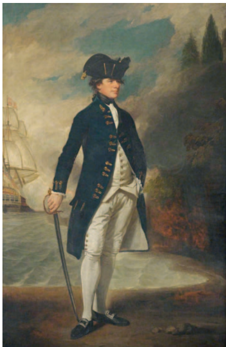
Retrato del vicealmirante Hyde Parker.

allí el ancla el navío Monarca , cargado con 4.357.065 pesos en caudales 63 y que, además, había apresado dos naves mercantes durante su travesía 64 . Pese a que el navío no tuvo novedad alguna en su navegación, las fragatas padecieron la caza de buques enemigos, muy especialmente la Mercedes , que por el esfuerzo de vela que hizo tuvo averías en todas sus cofas 65 . En septiembre 1798 arribaron al Caribe desde la metrópoli las fragatas Esmeralda , Santa Clara y Medea , que como los buques antes mencionados se dirigieron a Veracruz para cargar caudales y llevarlos de vuelta a Europa. Tan pronto como Hyde Parker recibió noticias de estas naves, levó con su escuadra de Jamaica para sitiar La Habana y las rutas del Seno Mexicano; así, el 16 de noviembre 1798 aparecieron sobre La Habana tres navíos, cuatro fragatas y dos de sus bajeles menores 66 . El vicealmirante inglés ansiaba apoderarse de los caudales, pero por falta de provisiones hubo de regresar