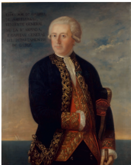
Retrato de Gabriel Aristizábal y Espinosa.

no al capitán de fragata Francisco de Castro Navarro, quien dio la vela al día siguiente; ambas regresaron la tarde del 30 de agosto custodiando 29 embarcaciones cargadas con 3.000 cajas de azúcar; y, aunque el mismo día apareció a la recalada sobre el puerto un navío enemigo de 48 cañones, las acertadas maniobras de Castro lograron salvarlo «con admiración del pueblo que lo veía y mucha satisfacción mía», según reportó Araoz 86 . Según declaración del propio don Francisco: «asegué el convoy y el buque de mi mando con diferentes maniobras que ejecuté sin empeñar las Armas del Rey a un combate con fuerzas tan desiguales y conforme a las prevenciones que llevaba para la escolta de los mencionados buques, que había sacado de los puertos de Matanzas, Santa Cruz y Jaruco, donde se hallaban bloqueados con inminente riesgo de ser apresados por diferentes corsarios ingleses, a quienes perseguí e hice retirar salvando dicho convoy» 87 . Bien merece el señor Castro esta mención de su persona, pues en abril de 1797 gobernó las fuerzas marítimas de la isla de Puerto Rico cuando los británicos intentaron conquistarla durante diecisiete días, hasta su «vergonzosa retirada». En recompensa a tan memorable defensa 88 , obtuvo el mando de la Gloria .