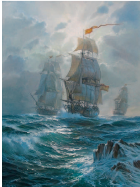
Óleo titulado El oro de España , del pintor navalista Alexander Shenderov, en el que se representa a una división española de fragatas cargada con caudales. Cortesía del artista. (Procedencia: internet [www.etsy.com])

Ambicionando la captura de un convoy jamaicano del que Araoz tenía noticias, el 31 de enero del mismo año zarpó de La Habana una división gobernada por el capitán de fragata Juan-José Elizalde, formada por las fragatas Anfitrite (insignia) y Juno , la corbeta Diligencia y los bergantines Galgo Inglés 54 y San Antonio . A primeros de febrero, la Anfitrite remitió al puerto una goleta que había detenido por carecer de pasaporte. Pero durante los días siguientes apareció a vista de puerto una imponente escuadra británica, y en ella, el vicealmirante sir Hyde Parker sobre el alcázar del HMS Queen , flamante navío de tres puentes y 98 cañones. Parker llevaba a sus órdenes, por lo menos, cuatro navíos de línea y seis fragatas más 55 . Alertadas, las naves de Elizalde tuvieron que tornar al puerto cubano el día 4 siguiente, mientras la corbeta y los bergantines eran acosados a cañonazos por las fuerzas del inglés y perseguidas hasta Matanzas, donde al día siguiente soltaron el ancla. Dos días después, el inglés destacó las fragatas HMS Trent y HMS Ceres para cazar una goleta cañonera al mando del patrón corsario Pedro Benet, quien logró burlar el bloqueo y,