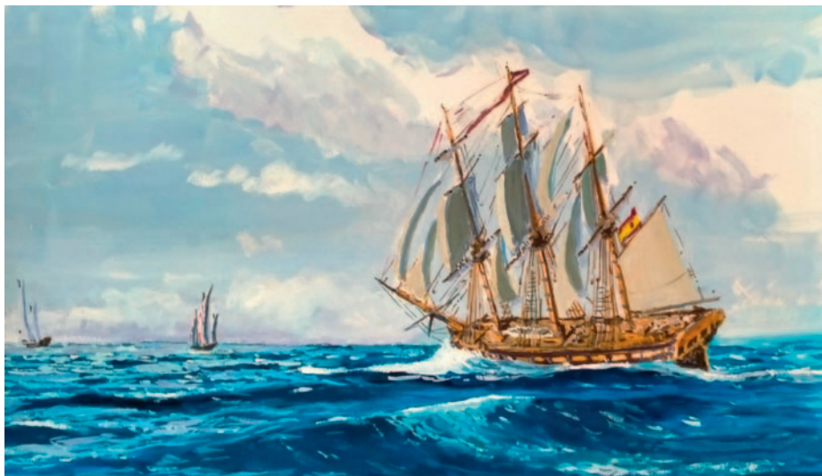
Fragata española dando caza a dos corsarios en alta mar. Acuarela de José Antonio Rodríguez Cruz. Colección privada del autor

fragata británica –cuyo mando asumiría meses después, curiosamente, el capitán Capel– siguió navegando por esas aguas al acecho de caudales hasta naufragar, en junio 1801, en los arrecifes del Triángulo –misma Sonda de Campeche–. Su dotación quedó prisionera en Veracruz 79 .