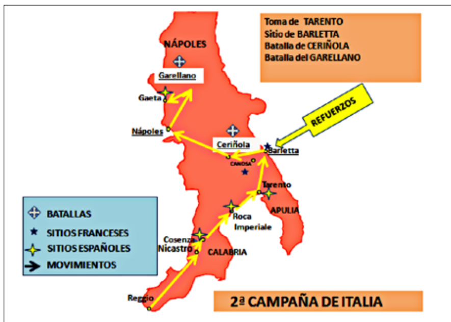
Figura 5.- Original del autor

Tarento es una plaza de un valor muy especial, por su vital situación geográfica y porque en ella se halla recluido el duque de Calabria, heredero al trono de Nápoles.