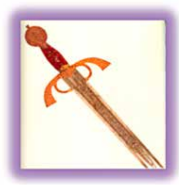
Figura 4.- Reproducción de la espada del Gran Capitán. Museo del Ejército 5

¿Y cómo era el factor humano en aquel Ejército? ¿Cómo eran aquellos hombres a los que instruirá en sus conocimientos y que de forma tan brillante lo llevarán a cabo con tanto brío como fe en su líder?