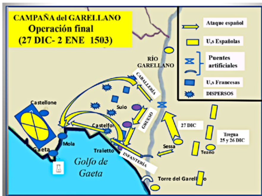
Figura 8.- Original del autor

Ya en la otra orilla, lanza el Gran Capitán, a D'Albiano con una importante fuerza de caballería, que hace un amplio arco que envuelve todo el flanco izquierdo francés.