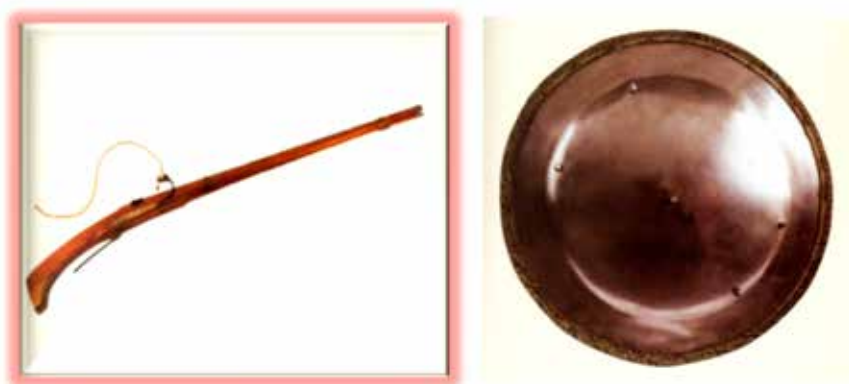
Figura 2.- Arcabuz y rodela

Pero la gran revolución la impondrá en la infantería, en la que mantendrá a los piqueros, que garantizan la integridad de los cuadros, pero irá sustituyendo a los ballesteros por los arcabuceros, que constituirán la elite de sus tropas, con menos guardias y mejor pagados, en atención a los mayores riesgos que correrán y a los gastos y dificultades técnicas que tienen que afrontar. Los arcabuces, con un alcance de 80 metros y especialmente eficaces a los 30, situados por delante de las picas, diezmaban de tal modo a las cargas de caballería que lo que llegaba ante los cuadros era incapaz de romperlo.