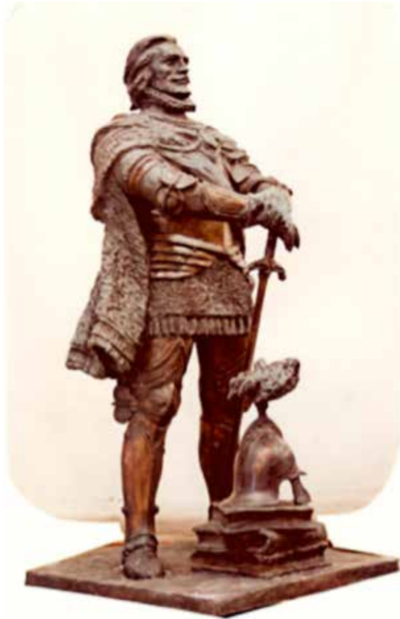
Figura 1.- Estatua del Gran Capitán de Antonio Colmeiro. Cuartel General del Ejército

batallas campales, estas no dejaban de ser sino el duelo de los caballeros de ambos bandos que eran quienes decidían el resultado final de la contienda. Los caballeros de todas las naciones eran una auténtica casta en la que predominaba el respeto y la caballería entre ellos.