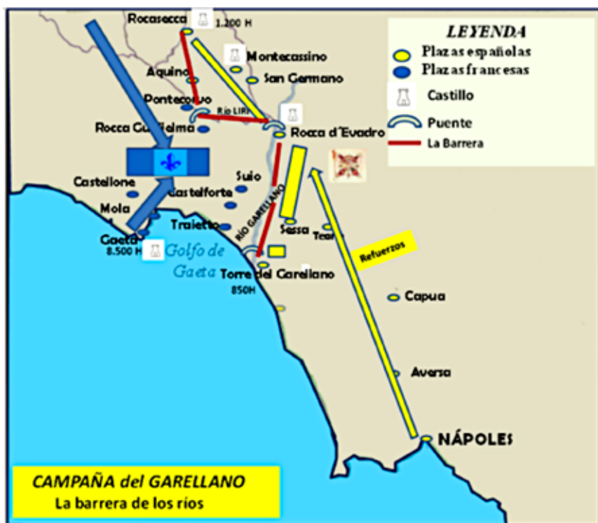
Figura 7.- Original del autor

Por ese puerto llega también el nuevo general en jefe de los franceses, Francisco de Gonzaga, marqués de Mantua, ex jefe de la liga veneciana y veneciano él mismo, por lo que no es aceptado plenamente por sus tropas.