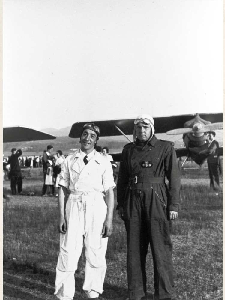
Oficiales pilotos ante un avión Breguet XIX en 1935, ambos con blusón mono del modelo de 1931: el de la izquierda con el de verano, y el otro con el de invierno.

elegante, en el que hay pocas diferencias entre el de tropa y el de oficiales.