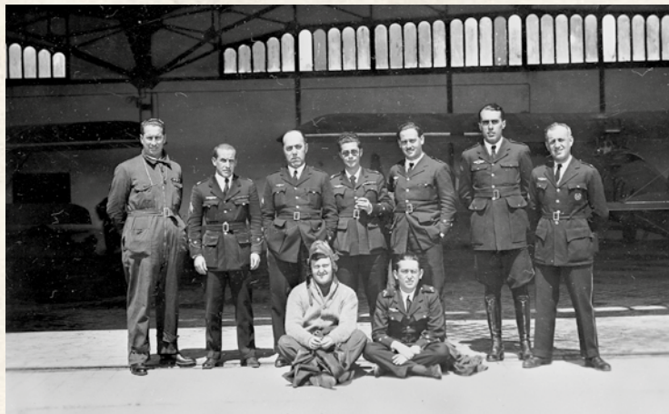
Grupo de oficiales del curso de paracaidismo en 1930 con el uniforme del modelo 1926.

En 1922 se declara reglamentario para las tropas del Servicio, como prenda de abrigo, el chaquetón de paño (tabardo) en sustitución del capote. Este chaquetón era de color azul oscuro, cruzado con dos filas de cinco botones del cuerpo, tapabocas bajo el cuello, que podía subirse, y dos bolsillos con tapa en los faldones. Esta prenda va a ser de uso muy común en el Ejército español y no nos va a abandonar hasta los años 90 del pasado siglo, siendo ya muy pocos los afortunados que la hemos usado.