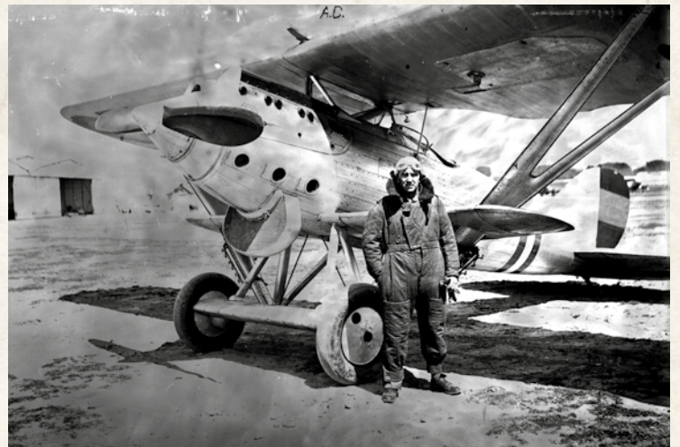
Oficial piloto ante un avión Nieuport 52 con mono de vuelo del modelo de 1933, de sarga de color azul y con forro de lana gruesa, una prenda excelente.

Poco después, por Real Orden Circular de 16 de abril del mismo año, se aprueba el reglamento para el Servicio de Aeronáutica Militar, cuyo director dependerá directamente del ministro de la Guerra.