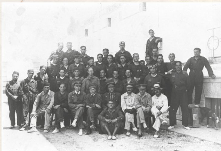
Grupo de profesores y alumnos del curso de bombarderos en Los Alcázarres, 1925. Blusón mono de faena de varios tejidos y tonos kaki y azul.

Posteriormente, por Orden Circular de 11 de julio del mismo año, modificada pocos días más tarde por Orden Circular de 18 de julio, se publica otro reglamento de uniformidad para los jefes, oficiales y tropa del Cuerpo General de Aviación, que es un punto y aparte en la vestimenta, ya que se introduce un cambio radical que le da un aspecto acorde con los tiempos, mucho más moderno y práctico.