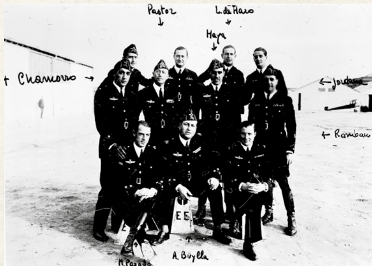
Grupo de oficiales del primer curso de vuelo sin visibilidad en 1932, entre los que se puede observar a los capitanes García Morato y Haya. Visten el uniforme modelo de 1926 y el mono de vuelo de ese mismo año.

No obstante lo anterior, y tal como se puede apreciar en fotografías, hasta los años 20 conviven en África los uniformes kaki y azules con los uniformes de lona de rayadillo, más común este en la tropa que en la oficialidad.