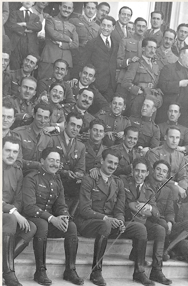
Grupo de oficiales en Cuatro Vientos en 1926, entre los que se puede reconocer al teniente D. Ignacio Hidalgo de Cisneros, que años más tarde será el jefe de las Fuerzas Aéreas de la República. Se pueden apreciar los uniformes de los modelos de 1914 (con cuello cerrado y botones), de 1917 (con cuello cerrado y frente sin botones a la vista) y de 1920 (con cuello abierto, camisa y corbata).

Es importante señalar que dentro del Servicio de Aviación prevalecerán las categorías aeronáuticas, prescindiendo del empleo y antigüedad en el Ejército, ya sea en paz o en