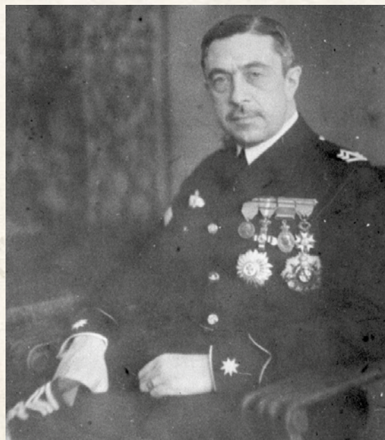
Comandante D. Emilio Herrera Linares en 1926, con el uniforme de gala establecido ese mismo año. Obsérvense los nuevos galones de empleo en Aviación.

- Los jefes y oficiales del servicio llevarán en el hombro del uniforme la insignia de su categoría en el servicio, y