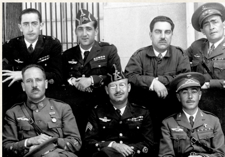
Profesores y alumnos del curso de observadores en Cuatro Vientos (1930), entre los que se puede observar al capitán D. Mariano Barberán. Se pueden apreciar tres uniformes que coexistieron: el del modelo 1926 (con gorro isabelino con borla), el del modelo 1920 (con cuello abierto y corbata) y el uniforme general único del Ejército, de 1926 (con cuello cerrado).

Por último, aprovecho la oportunidad para reiterar lo que expresé al comienzo de estas líneas, la necesidad de tener en cuenta el origen y la evolución de los elementos de uniformidad para cualquier cambio que se pretenda incorporar en el actual uniforme del Ejército del Aire.