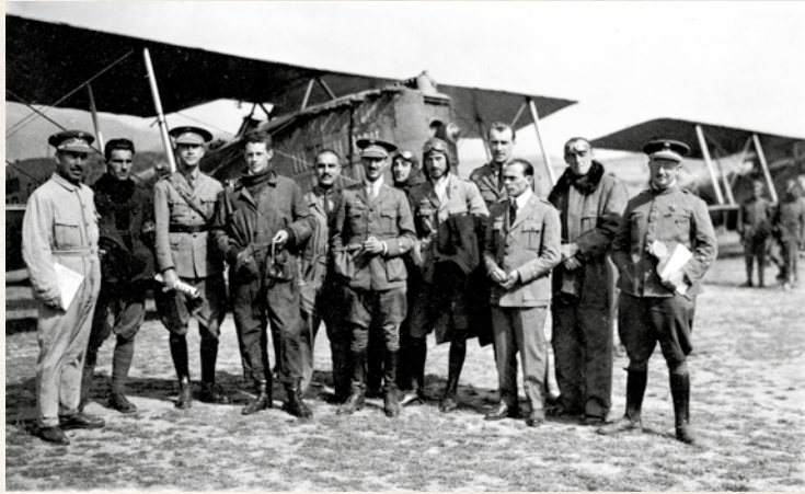
Grupo de oficiales en Tetuán, frente a un avión Breguet XIV, 1922. Esta fotografía ilustra la variedad de uniformes que se utilizaban en los años 20. El primer oficial por la derecha viste el uniforme de 1914, y la mayoría, la guerrera de cuello abierto con camisa y corbata adoptada en 1920, que, como se puede observar, era muy popular. También se puede apreciar, en el segundo oficial por la izquierda, el uso del tabardo azul, una muestra más de la mezcla de uniformes kaki y azul.