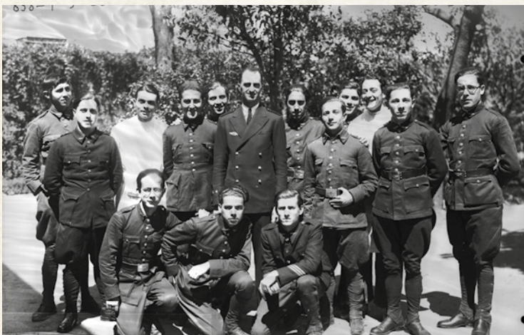
Grupo de aviadores en 1934, profesor y alumnos del curso de información. Visten el uniforme modelo de 1931 para oficial (color azul tina oscuro) y para tropa (color azul Vergara). La chapa del cinturón de cuero de la tropa pervive en los correaes, que todavía se utilizan en la AGA.

En cuanto al uniforme, por Real Orden de 20 de junio de 1913, se declara reglamentario para jefes y oficiales del Servicio el uniforme kaki 5 establecido en 1906 para las guarniciones de África, y se especifica que para vuelo se utilice un chaquetón de cuero y el pantalón de paño azul, en invierno, y la guerrera y pantalón azules en verano.