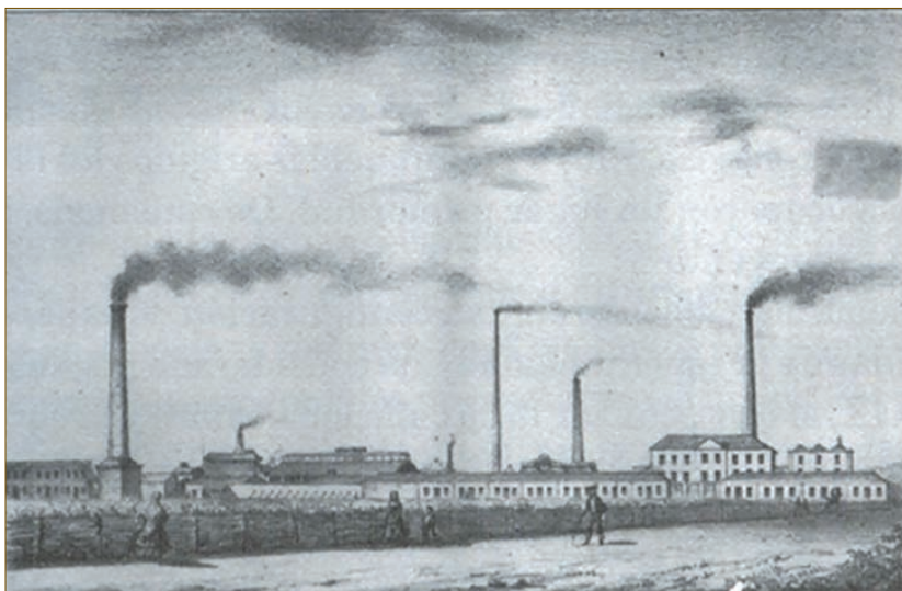
El Perchel a principios del Siglo XX.

En el Boletín Oficial del Estado (B.O.E.) nº 115 de fecha 12 de febrero de 1937 aparece la Orden siguiente: "Por resolución de S.E. el Generalísimo de los Ejércitos Nacionales, y con objeto de capacitar especialistas