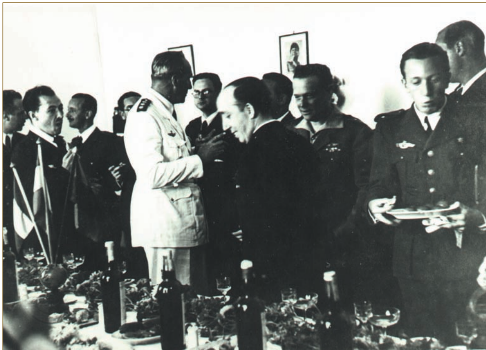
El Infante de Orleans.

En vista de ello el comandante Iglesias, en un informe de fecha 1º de agosto de 1938, propone dos soluciones para la reorganización y ampliación de la Escuela: la primera consiste en transformar