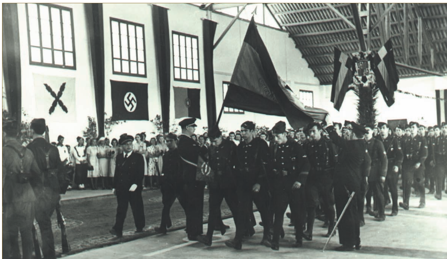
Jura de Bandera del 3º Curso.

A mediados del siglo XIX, Málaga llegó a ser la segunda ciudad industrial de España con ferreterías, textiles, químicas, vinos, frutos secos, etc. La mayoría de sus factorías se instalaron en esta popular barriada, el río dividía la ciudad en dos zonas: la derecha industrial y proletaria y la izquierda comercial y burguesa, cuando se instaló la Escuela la mayoría de las fábricas habían cerrado o estaban en