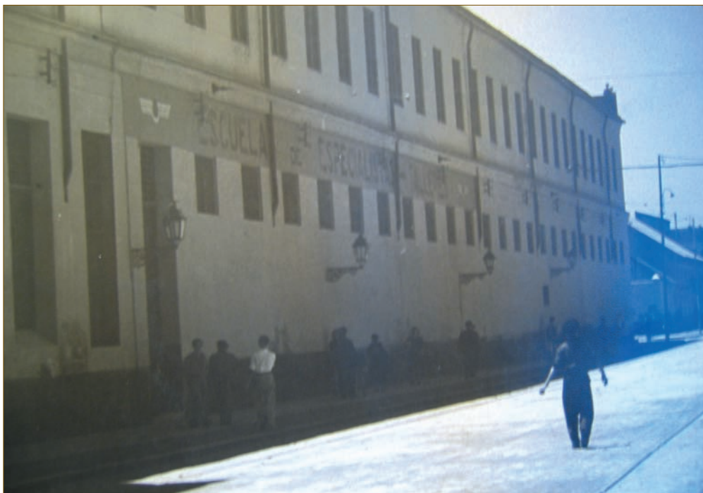
Talleres de ajuste, soldadura y calderería en la calle Ayala.

El 6 de enero de 1938 el comandante Iglesias Brage es comisionado, para que se traslade a Málaga, con el fin de buscar locales para la instala-