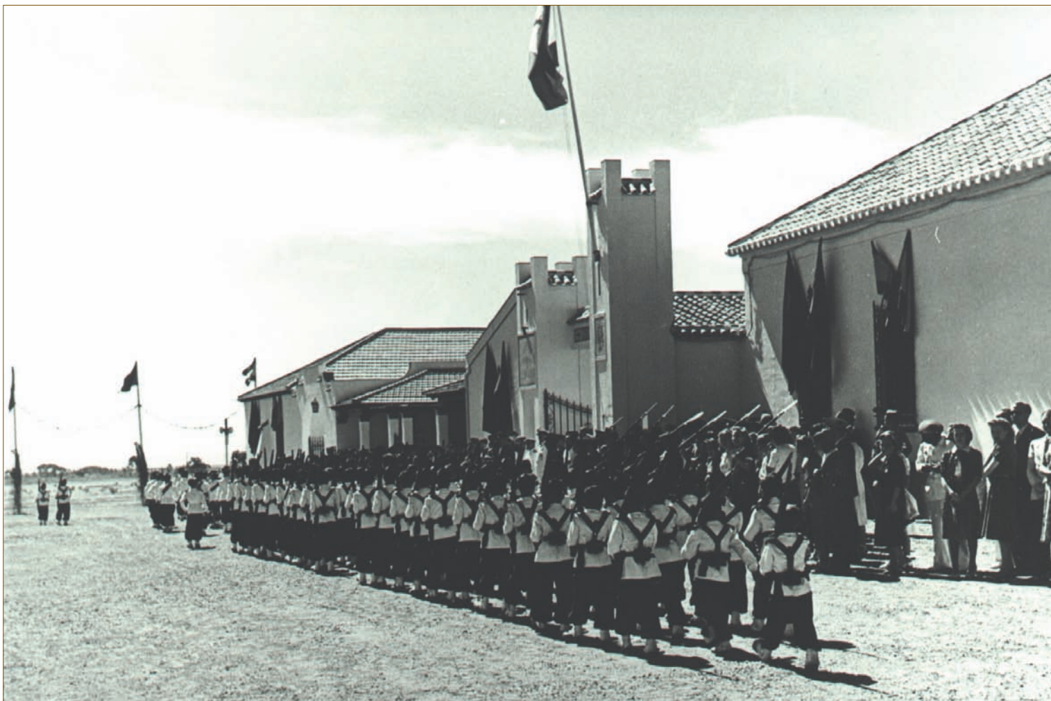
Desfile de los Flechas del Aire de la centuria García Morato.

especialistas se consignan en la Convocatoria de Especialistas del Arma en el BOE nº 240 de 28 de agosto del año actual”, es decir la convocatoria del cuarto curso.