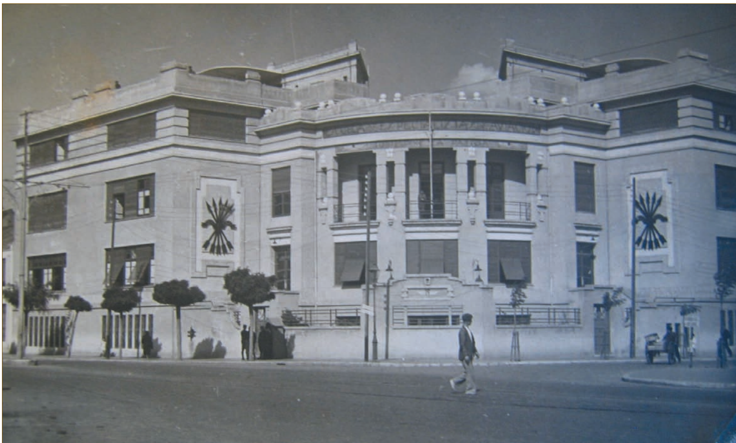
Edificio principal de la Escuela de Especialistas.

(mecánicos, radiotelegrafistas, armeros, etc.) para Aviación, se crea la Escuela de Especialistas de Aviación, dando comienzo en el plazo más breve los cursos de las distintas especialidades. Burgos 10 de febrero de 1937". La mencionada Orden dice que se crea la Escuela pero no dice donde, teniendo en cuenta que Málaga fue conquistada unos días antes, es posible que desde un principio se pensara en Málaga para su ubicación.