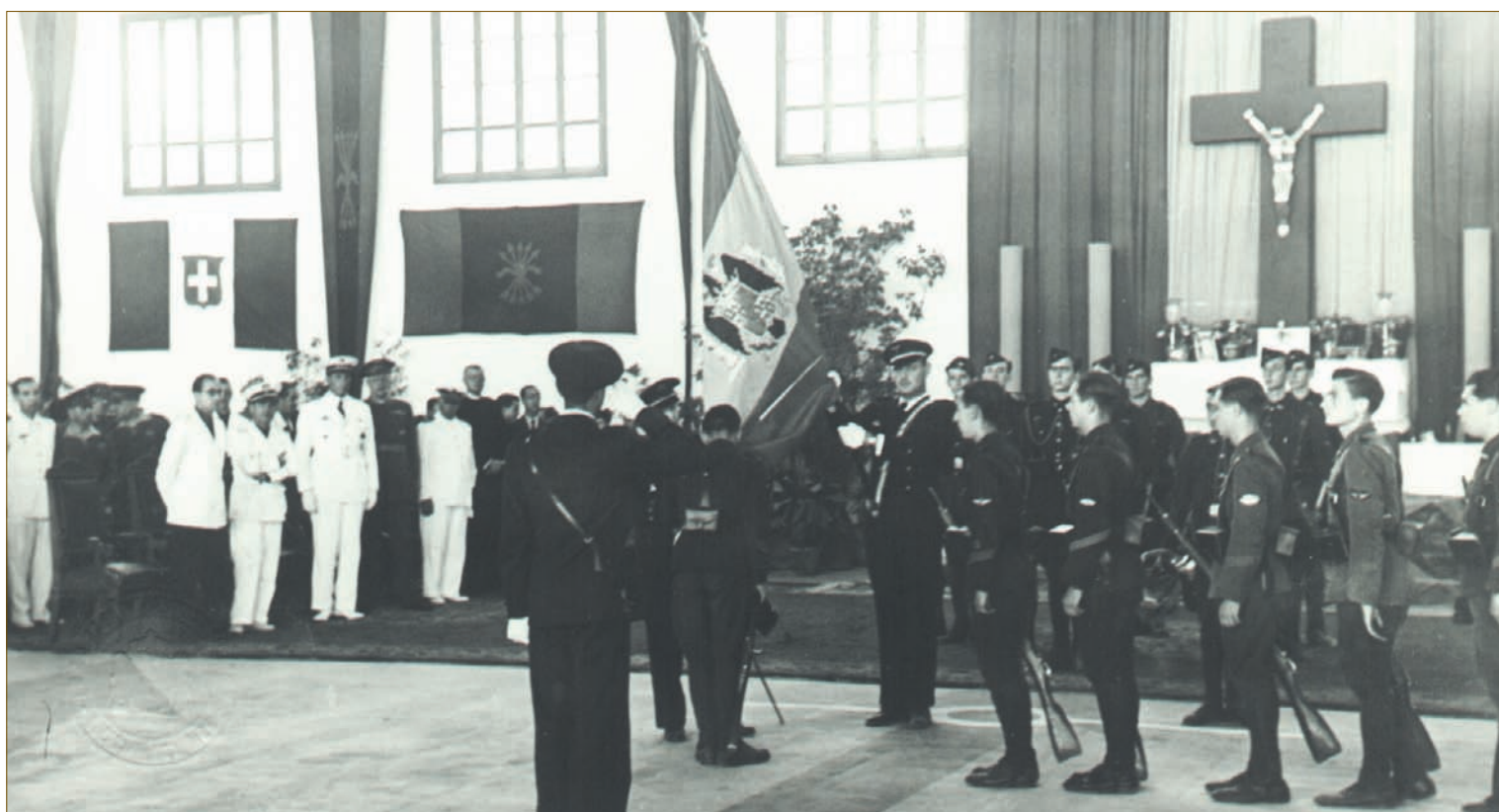
Jura de Bandera en un hangar de El Rompedizo.

1938 dio comienzo el 1º Curso con 429 alumnos (151 mecánicos, 102 montadores, 85 armeros y 91 radios), el examen de ingreso lo habían realizado en Tablada en cuatro tandas sucesivas. Como las instalaciones de calle Cuarteles aún no habían terminado las obras de adaptación, los alumnos fueron alojados, provisionalmente, en el Campamento Benítez y en el Cuartel de la Aurora hasta el 8 de abril que se trasladaron a las nuevas instalaciones. Estos días los dedicaron a la instrucción teórica y táctica sin armas.