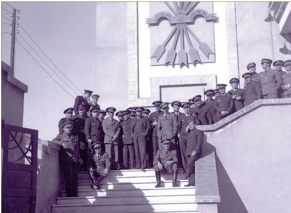
Profesores 2º Curso.