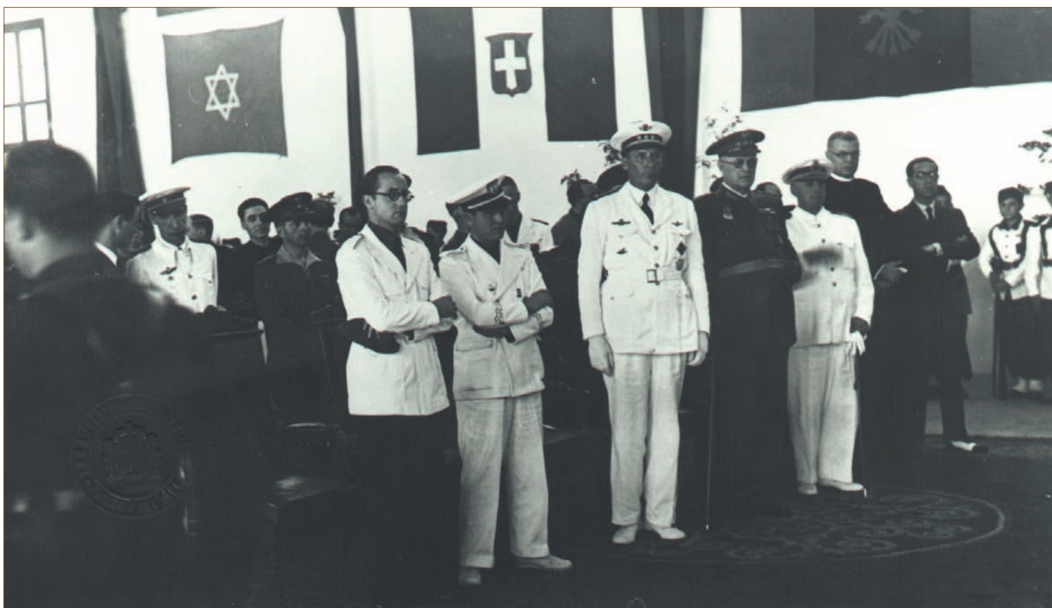
Autoridades civiles y militares durante la Santa Misa.

En cuanto a los premios y medidas disciplinarias, el comportamiento militar se solía premiar con permiso para poder llegar más tarde los sábados y domingos o castigar las faltas leves con la privación del paseo dichos días festivos, si la falta era más grave "el castigo reglamentario de calabozo, aunque esto se procura no imponerlo, siendo preferible para el alumno indisciplinado la baja definitiva en la Escuela". El comportamiento académico se solía premiar con 5 pesetas