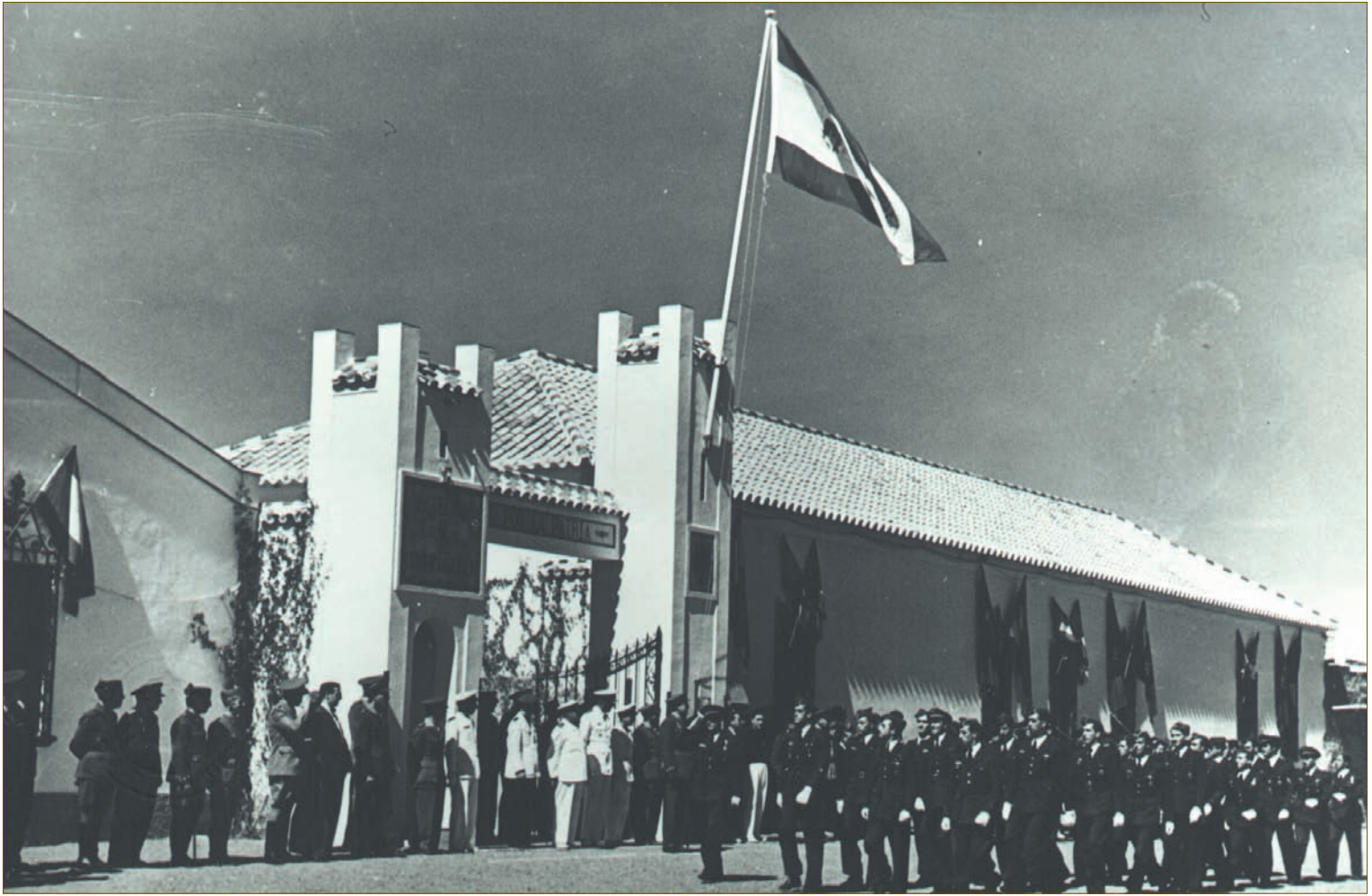
Desfile de profesores en la jura de Bandera.

le ocurrir en estos casos, no apareció el culpable. Con la marcha de los italianos las fotos de Mussolini fueron retiradas.