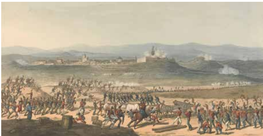
Figura 10. Badajoz during the Siege of June, 1811. Acuarela de Charles Turner, que se conserva en Yale Center of British Art de New Haven, Connecticut, y en la que se puede apreciar los preparativos del cerco en el margen izquierdo del Guadiana iniciados por la III División del general Picton

al foso en lugar de pasarlas a través de las empalizadas. Después saltaron sobre ellas, advirtiendo de inmediato que eran incapaces de moverlas, pues además de encontrarse trabadas, la madera verde de la que estaban hechas pesaba tanto que resultó imposible liberarlas. Como consecuencia de tal cúmulo de despropósitos, casi todo el destacamento acabó masacrado en el foso 65 .