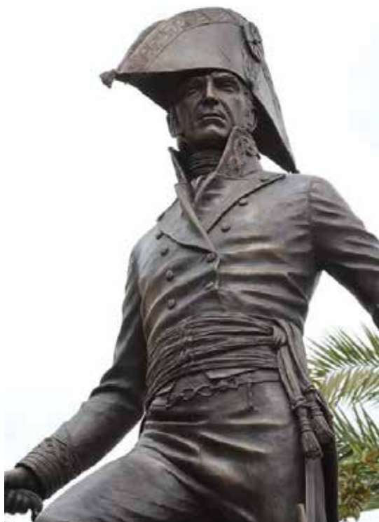
Figura 2. Estatua del general Menacho realizada por Salvador Amaya, inaugurada en 2019 en Badajoz

espera de las cuatro divisiones españolas que finalmente entraron el 6 de febrero. Estaban bajo el mando interino del teniente general Gabriel de Mendizábal porque el marqués de La Romana había muerto de apoplejía quince días antes en Cartaxo. Pronto se demostró que la capacidad de Mendizábal no estaba a la altura exigida: cuando el 7 de febrero cosechó su primera derrota frente a los muros de la plaza, decidió cruzar el río para llevarse las tropas a acampar al otro lado, en lugar de continuar hostigando a los franceses, cortar sus líneas de comunicación o presentar batalla. Mendizábal mantuvo inoperativo al Ejército durante días dejando vía libre al enemigo para que extendiera las paralelas, de tal modo que la noche del 10 de febrero los franceses tomaron el descuidado fuerte de Pardaleras, exponiendo a un ataque todo el sector meridional, como pudo verse de inmediato, cuando iniciaron una zapa en zigzag amenazando el camino cubierto frente a la cortina de San Francisco, donde se proponían emplazar la artillería de brecha para batir los muros de la plaza.