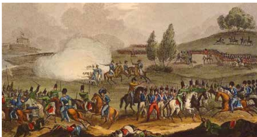
Figura 5. Defeat of a French Division Before Badajoz, acuarela de Thomas Sutherland de 1815 en la que se representa el combate librado en las inmediaciones de Badajoz, el 25 de marzo de 1811

Para hacer efectivo este plan, el mayor Alexander Dickson 25 hizo reunir en Elvas un tren de sitio compuesto de veinticuatro piezas de 16 libras, dieciséis de 8, diez obuses de 2 pulgadas y ocho de 6. En total treinta y dos bocas de fuego de distinto calibre, servidas por cinco compañías portuguesas, que a la postre se revelarían insuficientes teniendo en cuenta las cincuenta y cuatro usadas por los franceses en el cerco anterior. En cualquier caso, ninguna estuvo lista de inmediato, puesto que una nueva crecida del Guadiana se llevó por delante el puente de barcas y no fue sino hasta el 4 de mayo cuando las columnas británicas pudieron presentarse finalmente ante Badajoz. Cuatro días más tarde el cerco fue completado, y el 11 de mayo tres piezas de 24 libras junto a dos morteros de 8 pulgadas abrieron fuego contra San Cristóbal. Pero esa misma noche la batería fue silenciada con la que habían emplazado los franceses en el castillo, y como al día siguiente los informes alertaron del fuerte contingente que, al mando de Soult, se aproximaba desde Andalucía, Beresford ordenó levantar el sitio.