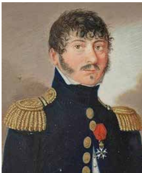
Figura 8. Retrato del general Armad Philippon, gobernador de Badajoz. Miniatura realizada por Friedrich Karl Rupprecht en 1807, cuando aquel era aún coronel del 54º regimiento de infantería de línea