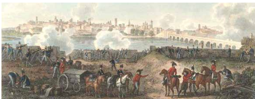
Figura 9. Siege of Badajoz. Acuarela de Henri Leveque, publicada un año más tarde del sitio británico de 1811 y que se conserva en la Anne S.K. Brown Military Collection de la biblioteca de la Universidad de Brown. En la misma pueden apreciarse en primer término las baterías dispuestas por el mayor Dickson para contrarrestar las emplazadas por el coronel González en la alcazaba

Los días sucesivos, el coronel González continuó dirigiendo el fuego de los Villantroys contra las baterías británicas emplazadas frente al castillo, impidiendo que aproximaran los caballeros de trinchera para batir con efectividad sus muros. Tres días más tarde había reducido la potencia de fuego del enemigo un 30%, por lo que este solo podía oponer catorce piezas operativas contra el castillo y diecisiete contra San Cristóbal 56 . No obstante, en este último sector el débil revestimiento de uno de los parapetos hizo caer finalmente parte de la camisa del flanco derecho del fuerte, por lo que, contra el parecer del grupo de ingenieros que dirigía el ataque, Lord Wellington dictó las órdenes oportunas para probar el asalto esa misma noche 57 .