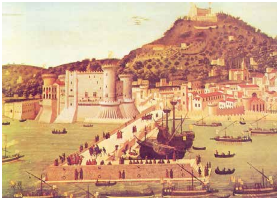
Figura 2. Castell D'Ovo, tomado por las tropas españolas de El Gran Capitán tras la explosión de la mina de Pedro Navarro el 11 de junio de 1503

El Gran Capitán se encontraba sitiando Gaeta, donde se había refugiado Ivo de Alegre con los supervivientes de Ceriñola. Luis XII aprestó una escuadra en Génova a las órdenes del marqués de Saluzzo para socorrer Gaeta y organizó los almacenes de víveres para apoyar el avance del marqués de La Tremouille hacia el sur de la península italiana. Este ejército estaba formado por 30.000 hombres, incluía un cuerpo de mercenarios suizos de 8.000 soldados, 9.000 caballos y un tren de artillería compuesto por 36 piezas.