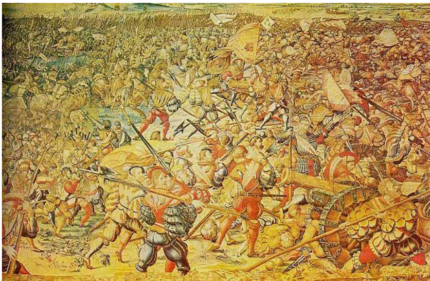
Figura 6. Cuadro de la batalla de Pavía del Museo de la Armería de Álava. Ataque de los lansquenets imperiales a la artillería francesa, cruzando la “roggia Vernaola”

Sobre la relación, extraída de las cartas de los Capitanes del Emperador, dice: “acudió mucha de nuestra gente y mataron el cavallo al Rey de francia y caído en terra los alemanes lo querían matar pero el temiendo la muerte dio boces diziendo que no le matasen que hera el rrey de francia y en esto sobre vino el bisorrey de napoles y lo salbo la vida tomando lo en presión”. 28