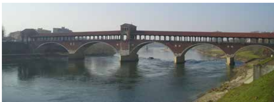
Figura 4. Ponte Coperto. Internet, Pavía, Ponte Coperto

Al Oeste se encontraban dos puertas; una de ellas unía a dos pequeñas aldeas, San Stefano y San Lanfranco, con Pavía y otra puerta desde la cual salía una carretera hacia Novara.