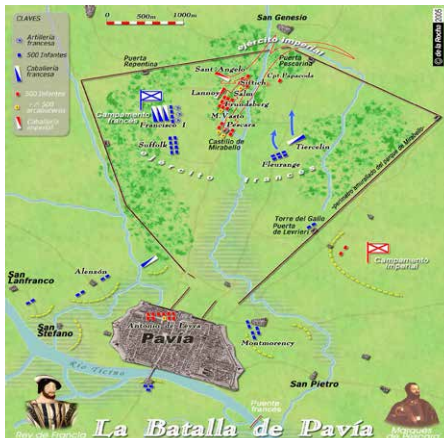
Figura 5. El campo de batalla del día 24.

El ejército del rey había sido prácticamente aniquilado. Se estima en unos 15.000 el número de bajas, incluyendo 3.000 “esguizaros” capturados, que serían puestos en libertad a cambio de la promesa de no volver a servir contra el imperio. La lista de bajas, entre muertos y prisioneros, por el lado francés nos muestra lo más granado de la nobleza francesa, encabezada por su propio rey, aparecen entre ellos; el rey de Navarra, el gran maestre de Francia, Montmorency, La Tremouille, La Palice, Bussy, Bonnivent (este se suicidó ante la gran debacle), Nevers, etc.