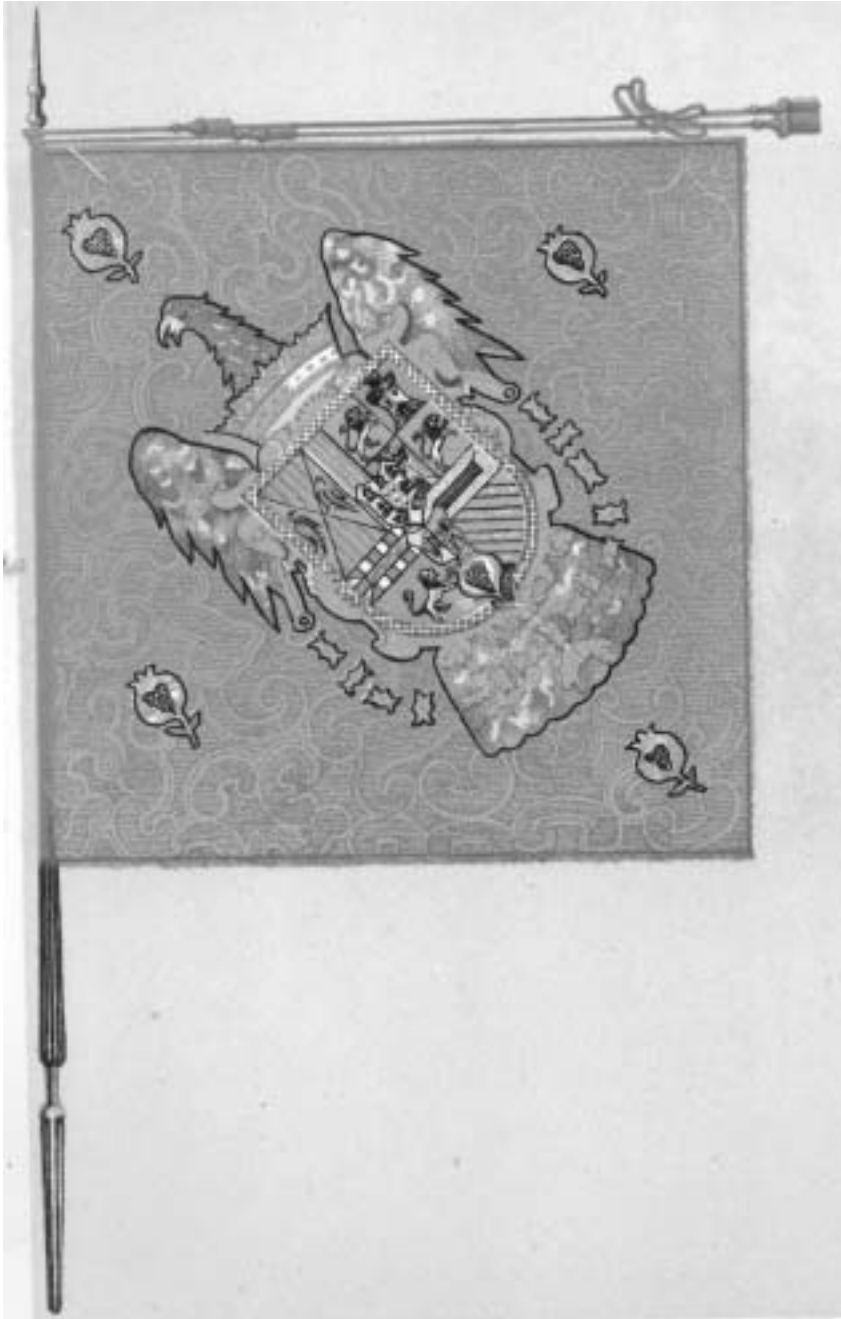
Estandarte de los Reyes Católicos