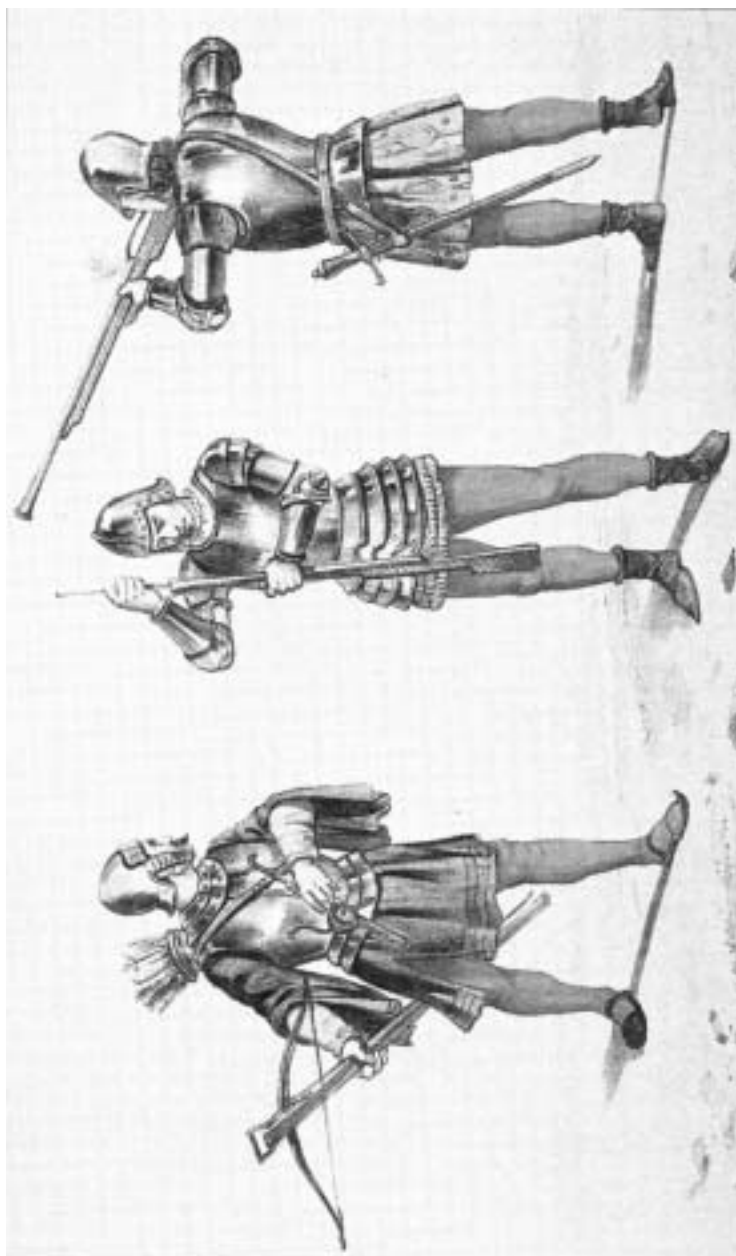
Ballesteros y espingarderos del siglo XV