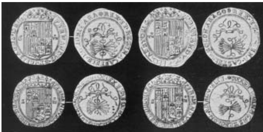
Monedas de los Reyes Católicos