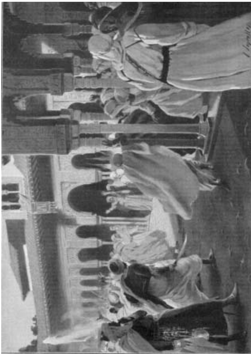
Boabtil declara la guerra a los Reyes Católicos (1490)