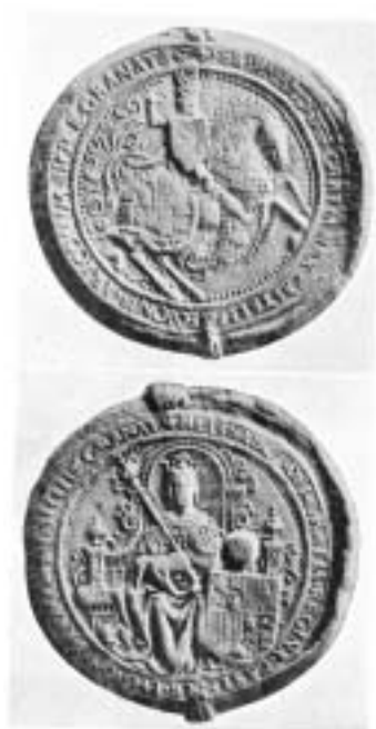
Sello de los Reyes Católicos