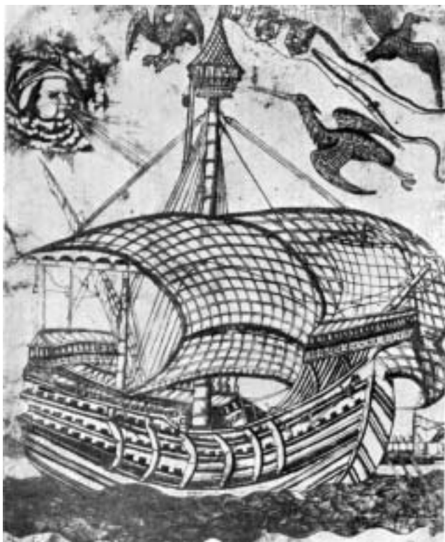
Carraca del siglo XV