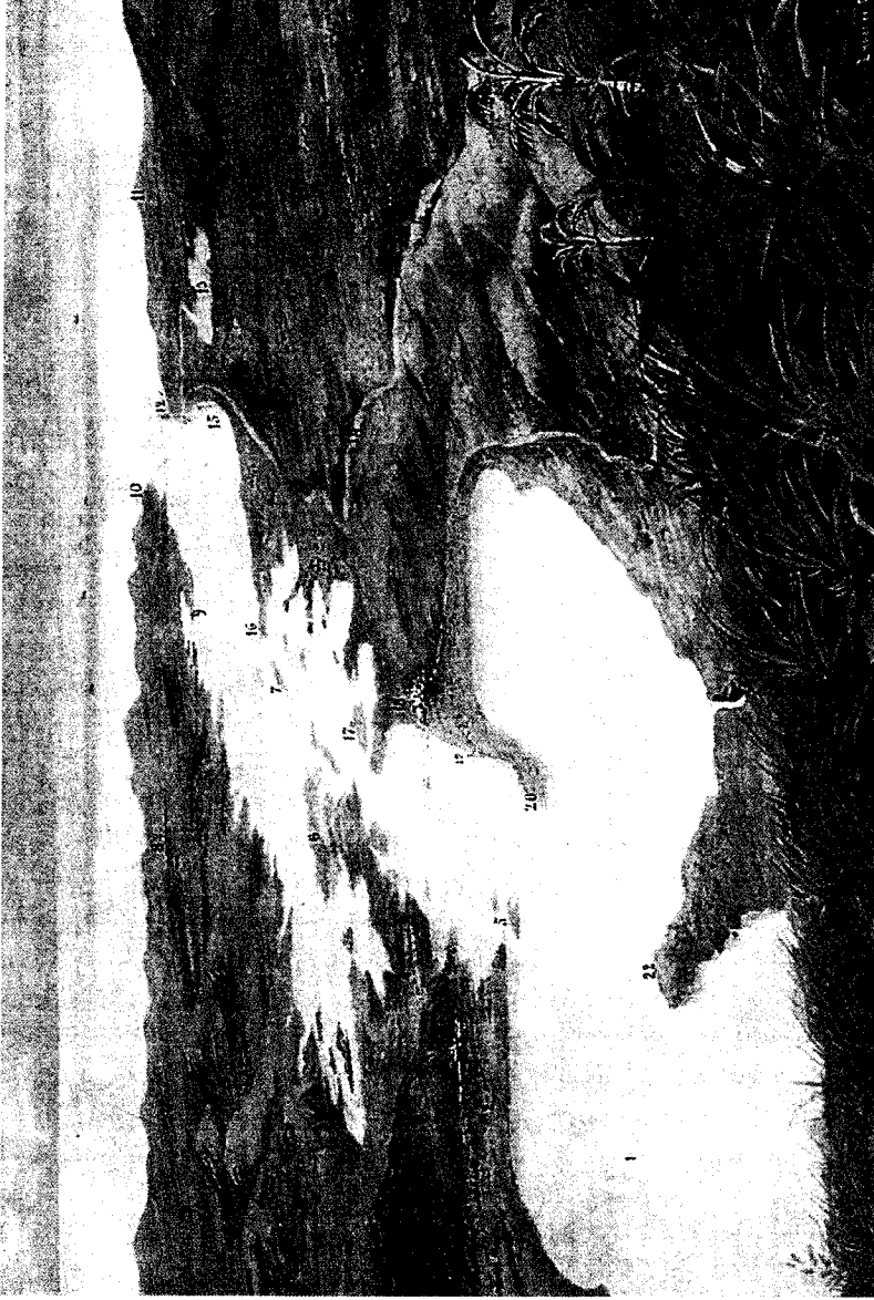
1. Ensenada de Joa.-2. Playa de Pescadores.-3. Cayo del Toro.-4. Fuerte.-5. Cayo Bamón.-6. Cayo del Medio.-7. Cayo del Hospital.-8. Ocujaí.-9. Punta Pescador.-10. Punta de Barlovento.-11. Punta de Sotavento.-12. Punta de San Nicolás.-13. Ensenada de Malmilla.-14. Río de Guantánamo.-15. Rincón del Río Frío.-16. Punta del Hicacal.-17. Cayo de Caoba.-18. Caimanera.-19. Faro.-20. Punta Salinas.-21. Ferrocarril a Santa Catalina de Guantánamo.-22. Punta Rubí o Manatí.