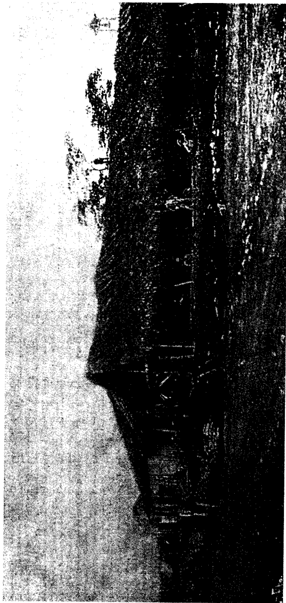
Atrincheramientos españoles en el ingenio Soledad