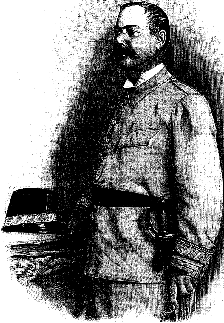
EXCMO. SR. D. JOSÉ TORAL Y VELÁZQUEZ, GENERAL DE DIVISIÓN, GOBERNADOR MILITAR DE LA PROVINCIA Y PLAZA DE SANTIAGO DE CUBA.

Excmo. Sr. D. José Toral y Velázquez. General de División. Gobernador Militar de Santiago de Cuba